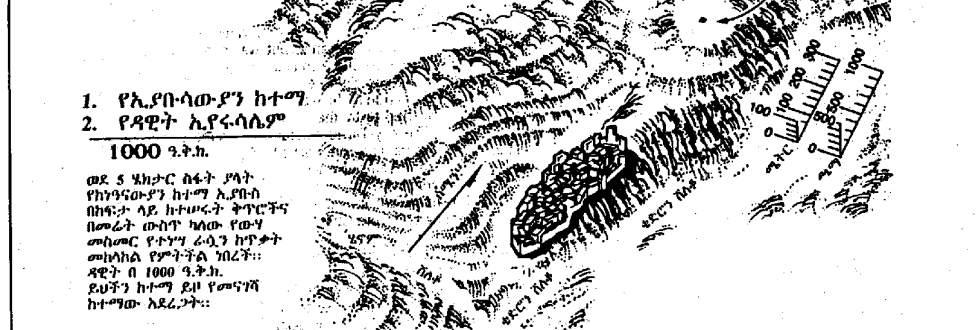
1. የኢያቡሳውያን ከተማ 2. የዳዊት ኢያቡሳውያን 1000 ዓ.ት.ክ.

አከተማን መጽሐፍ ቅዱሳዊና መጽሐፍ ቅዱሳዊ ያልሆኑ ታሪካዊ መረጃዎች የጢርስን ቤተ መቅደስ (ከዚያም በፊት የክርብሌን የሰለሞንን ቤተ መቅደስን) በጎሥ ዳዊት ለእግዚአብሔር መሆኑን የሠራቱትን ቦታ ላይ እንደተሠሩ ይገልጻሉ። ዳዊት ይህን መሬት ለሰውድማ ከሚሰጥበት ከኢያቡሳው ከአርሱ ገዛ (2ኛው 24:18-25)። በትውፊት ይህን ቦታ አጠርግሞ በሞሪያም ተራራ (ቤፍ 22:1-19) ላይ ከሠራው መሆኑን ጋር በማመሳሰል ለጆ ቅርጽና ይዘቱን ያሳያል። የቤፍጥረን መጽሐፍ ጸሐፊ የሞሪያም ተራራን «አእግዚአብሔር ተራራ» ጋር እና ለሌት በአካላዊ መሆኑን ላይ ከተጀመሩት የባሉይ ኪዳን መቅደሳት ጋር ያስተካክላል።