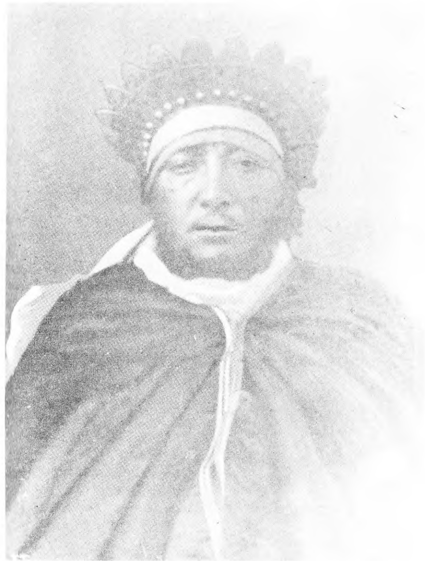
የወላም ባላባት ጦና ከአባ ማሲያስ መጽሐፍ