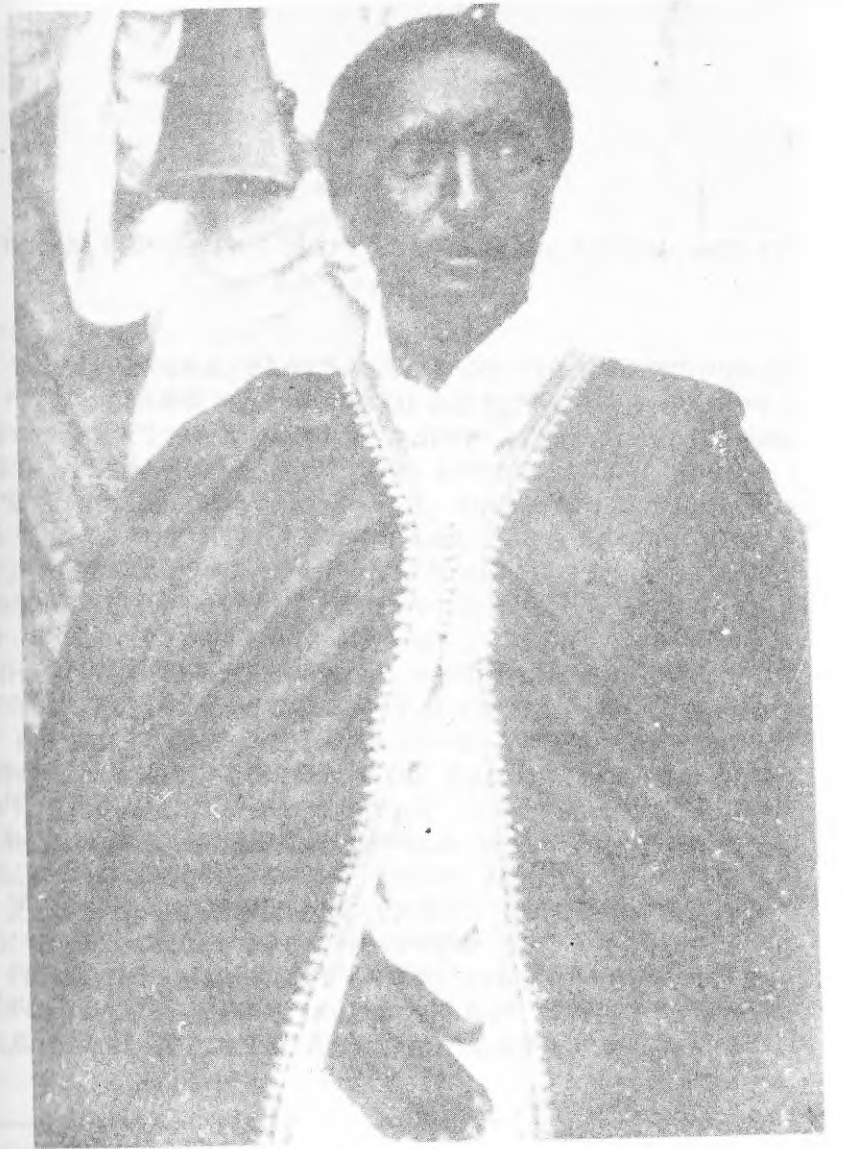
ራስ አባተ ዒ ያለው በአናራቶሪ