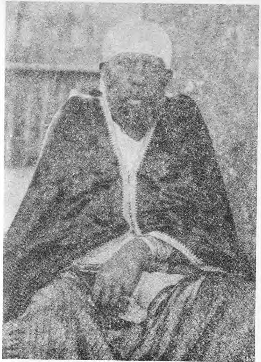
ዐፄ ምኒልክ በዓድዋ ጦርነት ጊዜ ከኔላ ቲራ ዴ ንጉሥ ከተባለው መጽሐፍ