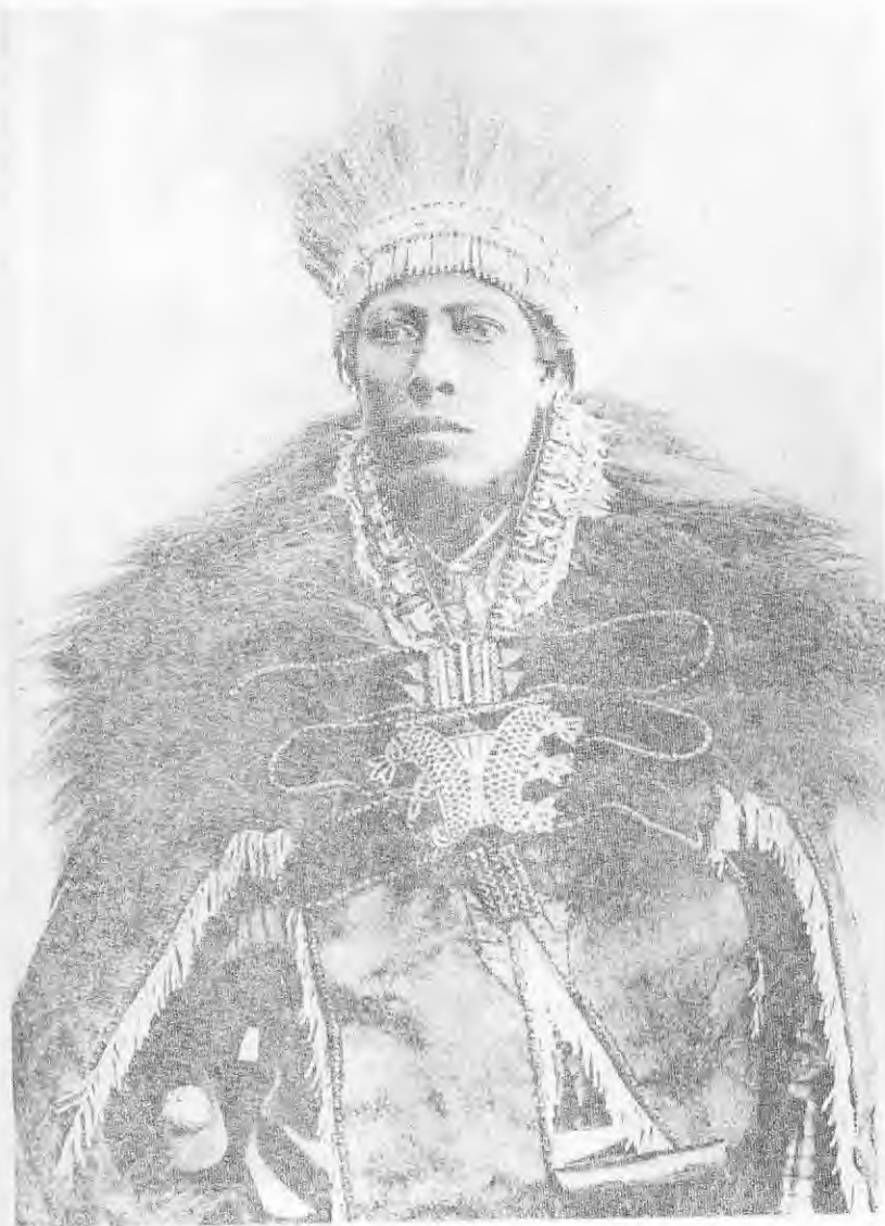
ደጃዝማች ባልቻ ከሞሪስ ደኮፔ

ማንቴጋዛ የሚባለው ፡ “ወዳዲ ምኒልክ በዕርቅ ምክንያት አንድ ወኪል እንልክ የነበረው ፡ ጊዜ ለማግኘት ወይም አንድ ራስ ንጉሡን እንዲከዳ ለመገፋፋት ብቻ ነበር” 2 ብሏል ። ዋናው አዝማች ገፍኔራል ባራቲዬሪ ከዓድዋ በኋላ ባዘጋጀው መጽሐፍ ፡ “ራሶቹን ለመጀመሪያ ጊዜ ምኒልክ በኛ ላይ ለማሰለፍ ዐወቀበት” 3 ብሏል ። በኢትዮጵያ የታሪክ ጥናት ስመጥሩ የሆነው ኮንቲ ሮሲኒ ደግሞ ፡ “ምኒልክ ታላላቆቹ አለቆች እንዲከተሉት ለማስገደድ ያደረገው ክንውን እስደናቂ ነው” ይልና ከዚያ እልፍ ብሎ ፡ “አበሻን በሙሉ በጎኑ አሰልፎ ለማዋጋት በመሰብሰብ ረገድ ምኒልክ አንድ ተአምራት ፈጽሟል ... ይኸን የመሰለውን ያውም ከዚህ ያነሰውን ያንድነት ታሪክ ለመፈለግ ከአሁን ወልደ ኢብራሂም ጋር ወደ ተደረገው ጦርነት መሔድ አለብን” 4 ...” ብሏል ። ወደ ግራኝ ጦርነት ማለቱ ነው ።