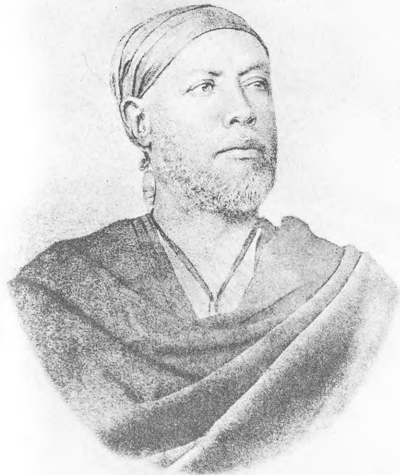
ԵՆ ԳՇԵ ՎՍԱ ՄԱՆ ԻՓԵՆ ԶԻՄ ՍՏԻՔ