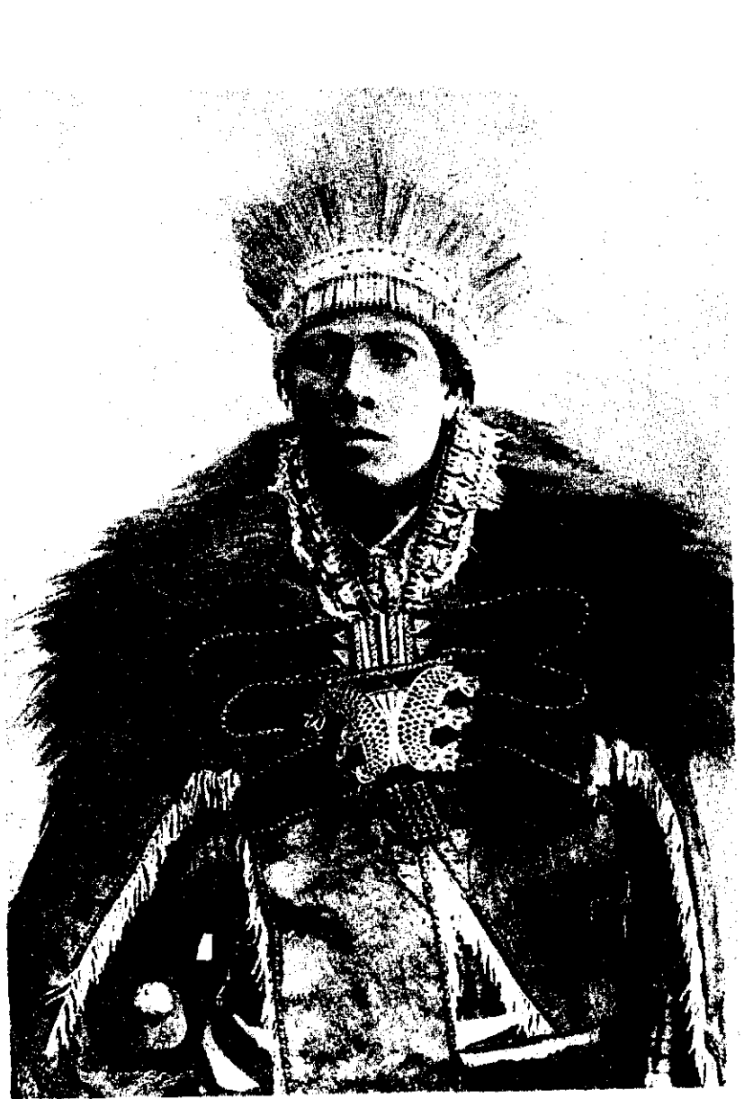
ደጃዝማች ባልቻ ከሞሪስ ደኮፒ

ማንቴጋዛ የሚባለው፣ “ወዳጅ ምኒልክ በዕርቅ ምክንያት አንድ ወኪል እንልክ የነበረው፣ ጊዜ ለማግኘት ወይም አንድ ራስ ንጉሡን እንዲከፋ ለመገፋፋት ብቻ ነበር” 2 ብሏል። ዋናው አዝማች ገጭራል ባራቲዬሪ ከዓድዋ በኋላ ባዘጋጀው መጽሐፍ፣ “ራሶቹን ለመጀመሪያ ጊዜ ምኒልክ በኛ ላይ ለማሰለፍ ዐወቀበት” 3 ብሏል። በኢትዮጵያ የታሪክ ጥናት ስመ ጥሩ የሆነው ኮንቲ ሮሲኒ ደግሞ፣ “ምኒልክ ታላላቆቹ አለቆች እንዲከተሉት ለማስገደድ ያደረገው ከንውን አስደናቂ ነው” ይልና ከዚያ አልፎ ብሎ፣ “አበሻን በሙሉ በጉኑ አስልፎ ለማዋጋት በመሰብሰብ ረገድ ምኒልክ አንድ ተአምራት ፈጽሟል... ይኸን የመሰለውን ያውም ከዚህ ያነሰውን ያንድነት ታሪክ ለመፈለግ ከአሁን ወልደ ኢብራሂም ጋር ወደ ተደረገው ጦርነት መሔድ አለብን” 4 ...” ብሏል። ወደ ግራኝ ጦርነት ማለቱ ነው።