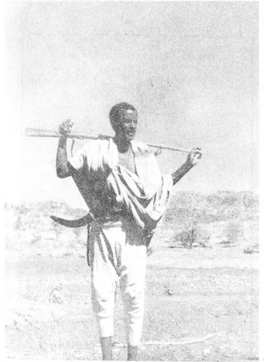
በዚህ ዘመን ያንድ ኢትዮጵያዊ ወታደር ትጥቅ ከገን ያስም መጽሐፍ