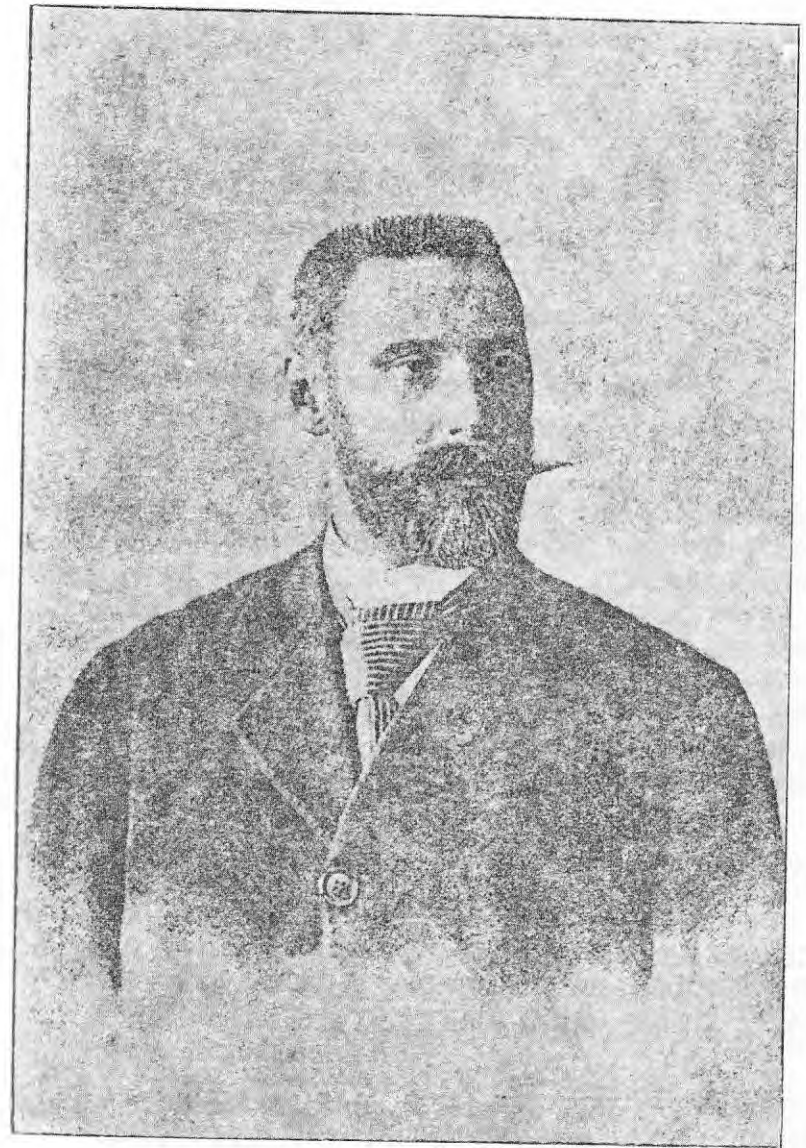
ኒኮላይ ሰርጌይቪች ሌዎንቲቭ ከሻቲካን ቤተ መጽሐፍ