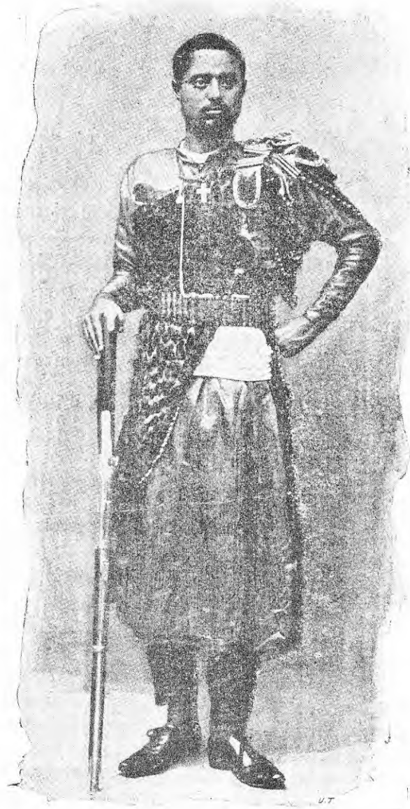
ራስ መኩንን ወ/ሚካኤል በዓድዋ ጦርነት ጊዜ ከሞንታዶኔ መጸሐፍ