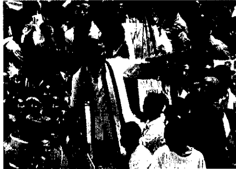
ቦግ ብሎ በሚታይ ሁኔታ ልደቱ መጣ ::

ለመኪና ማቆሚያ ቦታ እንደማይኖር እየተነገረ ባለበት ሰአት፣ መልእክቱ ቢደርሰውም በተለየ አለባበስ ባንዲራችንን አንገቱ ላይ አጣፍቶ ከሩቅ