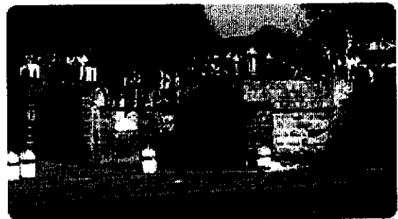
« ስለመብት! » የአዲስ አበባ ዩኒቨርሲቲ ተማሪዎች

እስከዛሬ፣ ኢህአዴግ ሥልጣን ላይ ከወጣ ጀምሮ ባለው ጊዜ ግን «ድብቅና ከተጠያቂነት የተገለለ፣ አዘጋሚና ውጤት አልባ፣ ጸረ ልማትና መልካም አስተዳደር አልባ የሆነ ተቋም» ነበር ማለት ነው?። ምናል ሁሉም መንግሥታዊ ተቋማት እንደዚህ እውነት እውነቱን ቢናገሩ! ብራቮ! ስቪል ሰርቪስ ኮሚሽን።