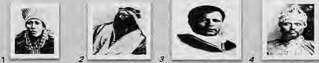
1/ ምስል 1ኛ ደጃዝማች ባልቻ አባነብሶ 2/ ራስ አሉላ አባኔጋ 3/ ፊታውራሪ ሃብተጊዮርጊስ ዲነድጌ 5/ ራስ መኮንን ናቸው!

የአድዋ ድል፤ ስለ አድዋ ጦርነት በአገርና በውጭ አገር ደራሲያን እጅግ ብዙ የተጻፈ ሰለሆነ ዝርዝሩን ማወቅ የሚፈለግ ሰው የተለያዩ መጻሕፍትን ማንበብ ይችላል። ለዚህ መጣጥፍ ፍጆታ ያህል ግን ከዚህ በታች ያለውን እንመልከት። ጣልያኖች ከመቀሌ ተሸንፈው ከወጡ በኋላ ሃይላቸውን እንደገና አደራጅተው በድጋሚ ለአፄ ምኒልክ ከአሁን በኋላ ጦርነት እንዳይቀጥል ከፈልጋችሁ ይህንን የእርቅ ሃሳብ ተቀበሉን በማለት ማጀር ሳልሳ ይኃ ላይ ከሰፈሩት ከአፄ ምኒልክ ዘንድ ደርሶ 1ኛ/ራስ ቢትወደድ መንገሻ 2ኛ/ራሥ መኮንን 3ኛ/ ፊታውራሪ ሃብተጊዮርጊስ በተግኙበት ያቀረበው አዲስ የመደራደሪያ ሃሳብ ባጨሩ እንዲህ የሚል ነበር ።