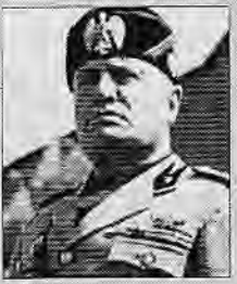
2/ ቤንቶ ሞሶሎኒ