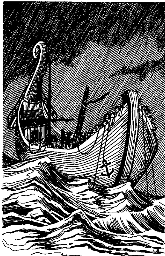
አረ ፕከቴተ ቀረዬ ስልፕለ ተከን ሚሌሄቴተ ከደመትን መርከፕ ቃትን። (27:29)

ከተን አዌ ኩያተ ኩደንከ አፍረተኤይ፣ 34 ሴመለ እከ ኡንተ ደምተኔኤን እሽን ቅንሰን። ደምቶሴ ኔፎ እሽነ ኮኮነሰ። ኡመ ረኮተ ተከ ኔፎ እሽን ቀረኤን ዴቶ።» 35 ከ አር ላቆተ ቄደ ከ እሾን ፕሰ ተረ ዋቀ ከለተይሰዴ ከ ሞሰዴ ከ ደምተ ፕዩ። 36 ስትይ አር፣ እከ ፕሰንት ሽሰ አርሰዴን ከ ደምተ ደሜን። 37 ነመ መርከፕሴ ቀረ ቾ፣ እኖ አን ነመ ድፕ ለከ ኩንደ ተፕ ሌህ። 38 ኤቴ ፕሰንት