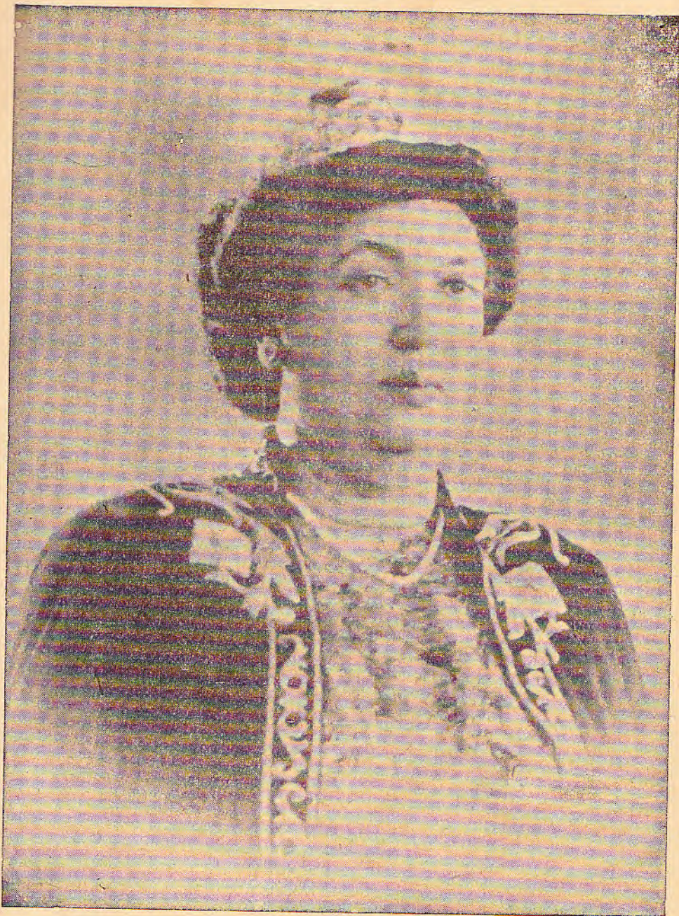
ገርማዊት ኦቲን መንግሥት