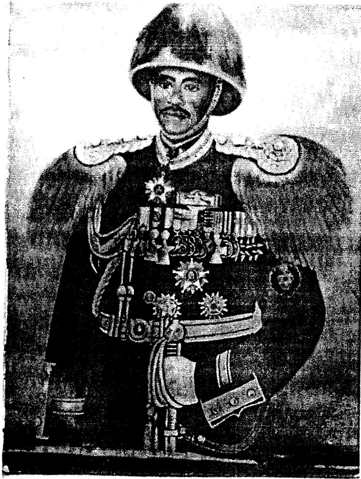
ሻምበል አብዲሳ አጋን በጦር ልብስ የሚገልጽ ስዕል