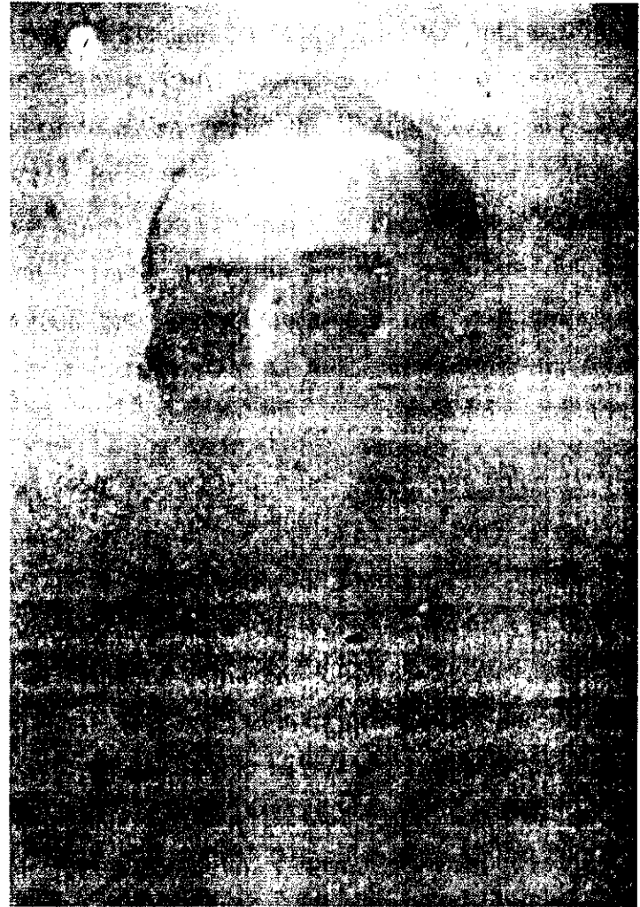
ጁሌ ታኪች ዩጎዝላቪያን አርበኛ መሪ በዚህ ዐይነት ጠላትን ያጠቁ ነበር።

ይህን እጃችን ካደረግን በኋላ ከከተማው በስተምዕራብ ወጣ ብለን የተማረኩትን አራቱንም የእጅ በምቦች ወደ ገደል ስንወረውረው በገበያው ላይ የነበረው የከተማና የባላገር ሕዝብ ገሚሱ ወደ ገጠር ገሚሱ ወደ ከተማ መባረር ያዘ። ዘረፋና ሽብርም ተፈጠረ። ለከተማዋ ጥበቃ የታዘዙት ፖሊሶች ነፍሳቸውን ለማትረፍ፣ ከሲቪሉ ቀድመው ሽሽት ቀጠሉ። ይህ ሲሆን እኛ በእግዚአብሔር እርዳታ እንድንገዛ ችግር ሳያጋጥመን ገድለንና ማርከን ለመመለስ ችለናል። የተማረኩትም 6 አቶማቲክ መሣሪያዎች 9 የእጅ በምቦች 658 ጥይቶች ናቸው።