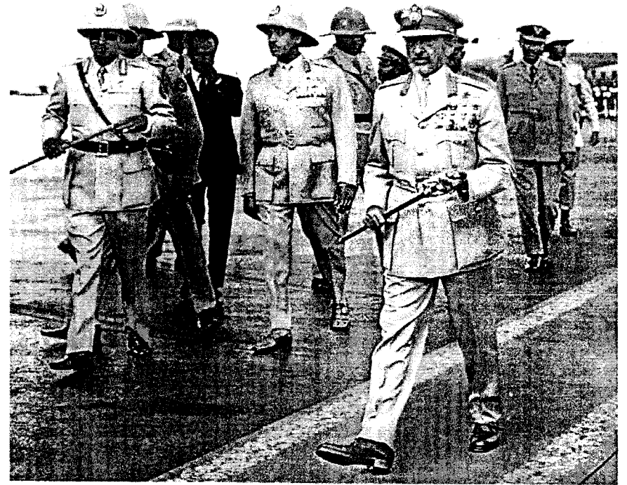
ሻምበል አብዲሳ አጋ ንጉሥ ነገሥቱን በክብር አጅበው