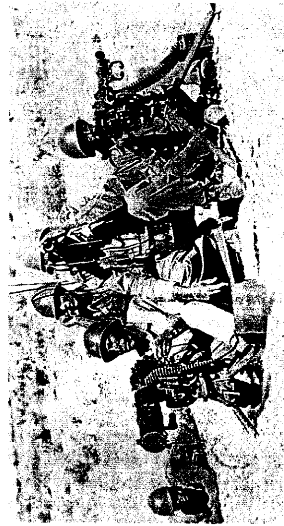
የሻምበል አብዲሣ አጋ በሩቅ የጠላትን ሰፈር በመነጻር እየተመለከተ በሁለት መትረየስ ግራና ቀኝ ሲያስመታ

በ፪ ኛው ክፍል ደግሞ የእንግሊዝን ሰንደቅ ዓላማ የያዙ ፫፻ ወታደሮች ሲገኙ 1.60 ቁመት ያላቸው ሜጂር ፋይል በጎላ በጦር ሜዳ ሌ/ኮሎኔል ማዕርግ አግኝተው የወርቅ ሜዳዬ የተሸለሙት ጀግና ነበሩ። እኒህ ሰው አስቀድሞ በአፍሪካ ምድር በሊቢያ ውስጥ በገኛው እግረኛ ክፍለ ጦር በአየር ወለድ የፓራሹት ክፍል አዛዥ ነበሩ። ከዚያም ወደ ፔፔሊያ ለጦር ስለላ ተልከው አይሮፕላናቸው በድንገት በመትረየስ ስለተመታ በፓራሹት ወርደው በፋሺስት ወታደሮች ተማረኩ። ከእሥር ቤት ካመለጡም በጎላ ከኦርቦኞች ጋር ተቀላቅለው በአዛዥነት ሲያገኙ ሲያገኙ ቆይተዋል። ብዙውን ጊዜ በአሜሪካና ከእንግሊዝ የጦር ጓዶች በአይሮፕላን የሚላኩልንን ምግቦችና መድገኒቶች በእርሳቸው ትእዛዝ በሚተላለፈው የሬዲዮ መልእክት አማካይነት ነበር።