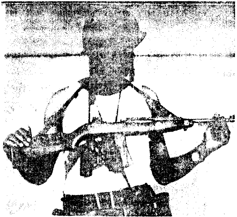
አብዲላ በጦር ሜዳ በዚህ ዓይነት ልብስ ይጠቀም ነበር።

ጋር እንዲሁም በገንዘብ የጎገዙ ቺ የእጅ ሰምዖች ብቻ ናቸው። እንግዲህ እኛ ፀ ለዎች ስንሆን ለጊዜው የቆጠርኩልህ መሣሪያዎች በእጃችን ይገኛሉ ታዲያ በምን ዐይነት ልንረዳችሁ የምንችል ይመስላችኋል?