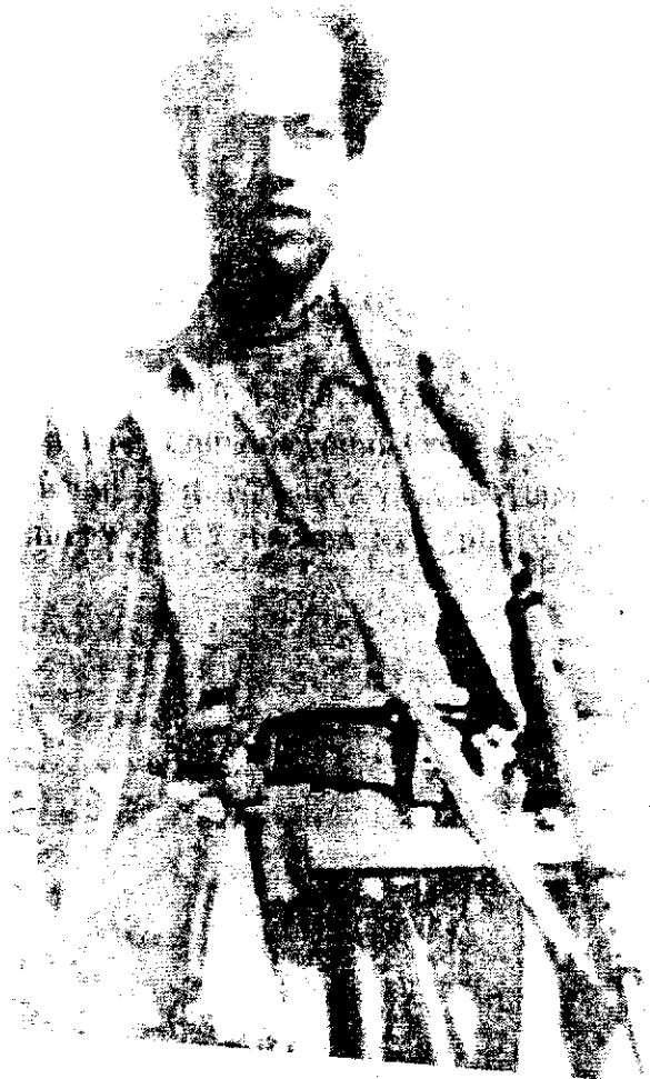
ሻምበል አብዲሣ አጋ በአርበኝነት ጊዜ።

ያለሁበት ዘመን ልክ የጀኛው ዓለም ጦርነት ዋዜማ መሰለኝ። ስምብ እንደ በረዶ ከሰማይ የሚወርድበት ቁጋዝ ጢስ የሚረጭበት የንጹሐን ሕዝቦች አስከሬን በየሜዳው የሚረፈረፈውን ያ የብስልና የጥሬ መለያ ወንጌት የሆነው ቀውጢ ቀን ከፊቱ ድቅን አለብኝ።