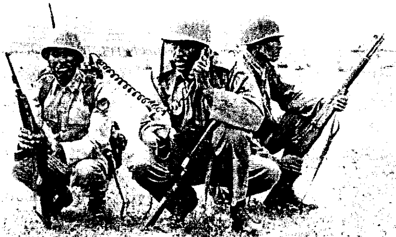
ሻምበል አብዲሣ አጋ በጦር መስመር ከሠራዊቱ ጋር ግንኙነት ሲያደርግ