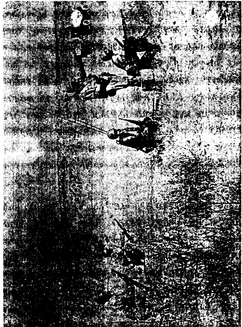
ሻምበል አብዲሣ አጋ በሩቅ የጠላትን ሰፈር ሲመለከቱ።