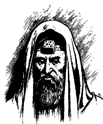
አረ አይሁድ ቃሌተ ዋቀኤ ታፍን ከ ኸለሸ ከረ ኻየን። (23:5)

23 1 ሴከመዬ ዮሱስ ሰመይተ እሾ ተማሪዋድእ ክዴ፥ 2 «ኮልሰምጥየ አሴረ እሾ ፈራሰዌው ፖረ ሙሴ ቀጥዴን ከ ቀረ ተማርሰሰ ቃኤን፥ 3 ወ እሾተ እሸነ ኪነኔ ጥሰ ኮደ