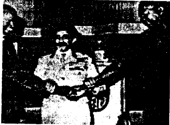
ራስተፈሪያውያን ከጃምይ ጋር ጃሊባሉ

ሁኔታም አንዳች አልባት ላይ ሳይደርስ በእንጥልጥል እንዳለ አለ። ነገር ግን የብዙዎች አቋም ቦብ ማርሌይ እንዳለው “HOLD ON TO WHAT YOU HAVE GOT” ስጦታችሁን ጠብቋት የሚል ነው። እኛም የሙጥኝ ብለዋል። የሆነው ሆኖ የዚህ ሁኔታ ዋናው የታሪክ መነሻ የዓድዋ ድል ነው። የጥቁር ህዝቦች ኩራት ስለሆነም ያንን የየካቲት 23ቱን ድል መሠረት በማድረግ መላው የዓለም ጥቁር ህዝብ ወሩን “The BLACK HISTORY MONTH” በማለት ሁሌም እያከበሩት ይገኛል። ስለዚህ ኢትዮጵያ የተሰፋይቱ ምድር ሆነች። በዚህ ማን ይከፋዋል? ጃ ራስተፈሪያን” ብሎ መቀበል ነው።