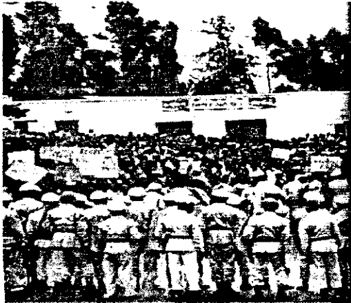
የጸጥታ ጠባቂዎች እና የተማሪዎች ግብግብ

ጥቂቶች ሲገደሉ ብዙዎች ቆሰሉ። ዓለም አቀፉ ተቃውሞም እጅግ እየበረታላል ሄደ።