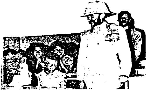
ቀዳማዊ ኃይለሥላሴ ተማሪዎችን ሲገቡ

ከጦርነቱ በኋላ ባሉት ተከታታይ 10 ዓመታት ምሁራንን የማበርከቱ ስራ ቀጥሎ ጃንሆይ ብዙዎችን ወደ ውጭ አገር ልከዋል። በ1934 ዓ.ም የትምህርት ሚኒስቴር ተቋቁሞ የትምህርት ሚኒስትርነት ስልጣኑን ንጉሱ ራሳቸው ደርበው ይዘው እስከ 1958 ዓ.ም ድረስ ቆይተዋል። ይጠነቀቁለትም ነበር።