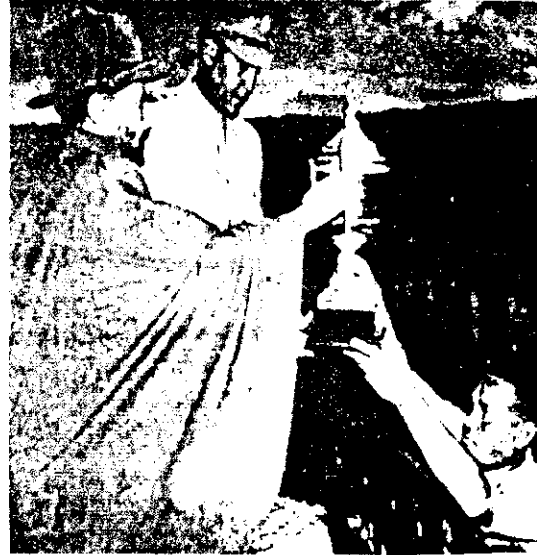
ይድነታቸው ከቀ.ገ.ሥ ዋንጫ ሲቀበል

በእንጨት ታጥር የነበረውና በሚሰማር ተራ በኩል ባለው የጎል ጀርባ ወንዝ የሚያልፍበት የዛሬው የአዲስ አበባ ስታዲየም የቀድሞው የቀዳማዊ ኃይለስላሴ ስታዲየም ከመሰራቱ በፊት ጨዋታዎች በጃንሆይ (ጃን) ሚዳ ላይ ነበር የሚካሄዱት። ጃን ሚዳ 30 ሺ ተመልካች የመያዝ አቅም ነበረው። ከ50 ዓመታት በላይም አገልግሏል።