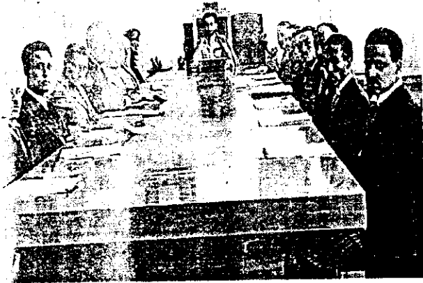
አዲስ የተቋቋመው የሚንሰትሮች ካቢኔ

ከንጉሠ የሚመነጨውና በማዕከል ከሚኒስትሩ ቢሮ ወደታች የሚተላለፈውን የሥራ አመራር በክፍለ አገር ደረጃ በተግባር ላይ የሚያውሉ የአገር ግዛት ሚኒስትር ባለሥልጣናትና ሠራተኞች፤ 1. ጠቅላይ አገር ገዢዎች፤ 2. ዳይሬክተሮች፤ 3. ፀሐፊዎች፤ 4. የአውራጃ፤ የወረዳና የምክትል ወረዳ ገዢዎች፤ 5. ዳኞች፤ 6. የኃይል አዛዦች፤ 7. ወታደሮች፤ የፖሊስና የፀጥታ ተወካዮች፤ 8. ሌላ አግባብ ያላቸው፤ ለምሳሌ የገንዘብና የጤና ሚኒስቴር መሰሪያዬቶች ተወካዮች ናቸው። የአገር ግዛት ሚኒስቴር መሰሪያ ቤት ሁለት ዋና ተግባራት አሉት። በአንድ በኩል በፀጥታ፣ በፖሊስ፣ በወህኒ ቤት፣ በጠረፍ ጥበቃና በኢሚግሬሽን ክፍሎች አማካኝነት የመንግስትን ደህንነትና ፀጥታ መጠበቅ፤ በሌላ በኩል በልዩ ልዩ የግብር፣ የቀረጥና የብድር ምንጮች የመንግስትን የገንዘብ ገቢ መጠን ማሳደግ ናቸው። በአዲሱ መንግስታዊ አወቃቀር ላይ ታማኝ ባለሥልጣናትን እየሾሙ፤ የሁሉም የበላይ ንጉሠ ነገስቱ ሆነው ሚኒስትሮች አስከ ቀበሌ ድረስ ሰራው በተቀረድ እንዲቀጥል እያደረጉ በደሞዝ መሰራት ጀመሩ። እንደተባለውም የመንግስት ገቢ በግብር፣ በቀረጥ፣ በአገልግሎት ክፍያዎች ላይ ተመሰረተ። የገቢ አሰባሰብን በተመለከተም በተለያዩ ጊዜያት ልዩ ልዩ ድንጋጌዎች እየወጡ ተግባራዊ ተደረጉ።