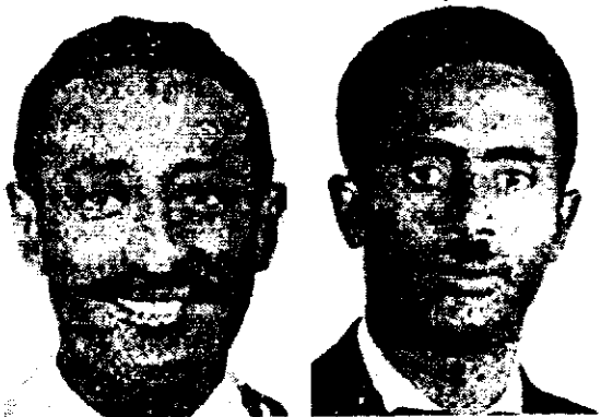
ብርታደር ጄነራል ሙንግስቱ ነፃይ እና ገርግጌ ነፃይ

ጃንሆይ በዚህ ጊዜ ለጉብኝት ከሄዱበት ከላቲን አሜሪካ ወዲያው ተመለሱ። ጳጳሱም ገዘቱ። በጦር ኃይሎች ጠቅላይ ኤታማገር ሹም የተመራው ጦር ከሁለት ቀን የተኩስ ልውውጥ በኋላ አመጹን ተቆጣጠረው። ንጉሡም ከከሸፈ በኋላ ነበር ኢትዮጵያ የደረሱት። እነሙንግስቱም መከሸፉን ሲያውቁ በገነተ ልዑል ቤተ-መንግስት አስረዋቸው የነበሩትን ሹማምንት ገድለው ለማምለጥ ሞከሩ። ኮሎኔል ወርቅነህ ገበየሁ ራሱን ገደለ። ገርግጌ ዝቅላ ደርሶ ከሚያድኑት ጋር ተታኩሶ ሞተ። መንግስቱ ቆስሎ ተይዞ ከመጣ በኋላ ለፍርድ ቀርቦ በስቅላት ተቀጣ። ትግሉ ግን ቀጠለ።