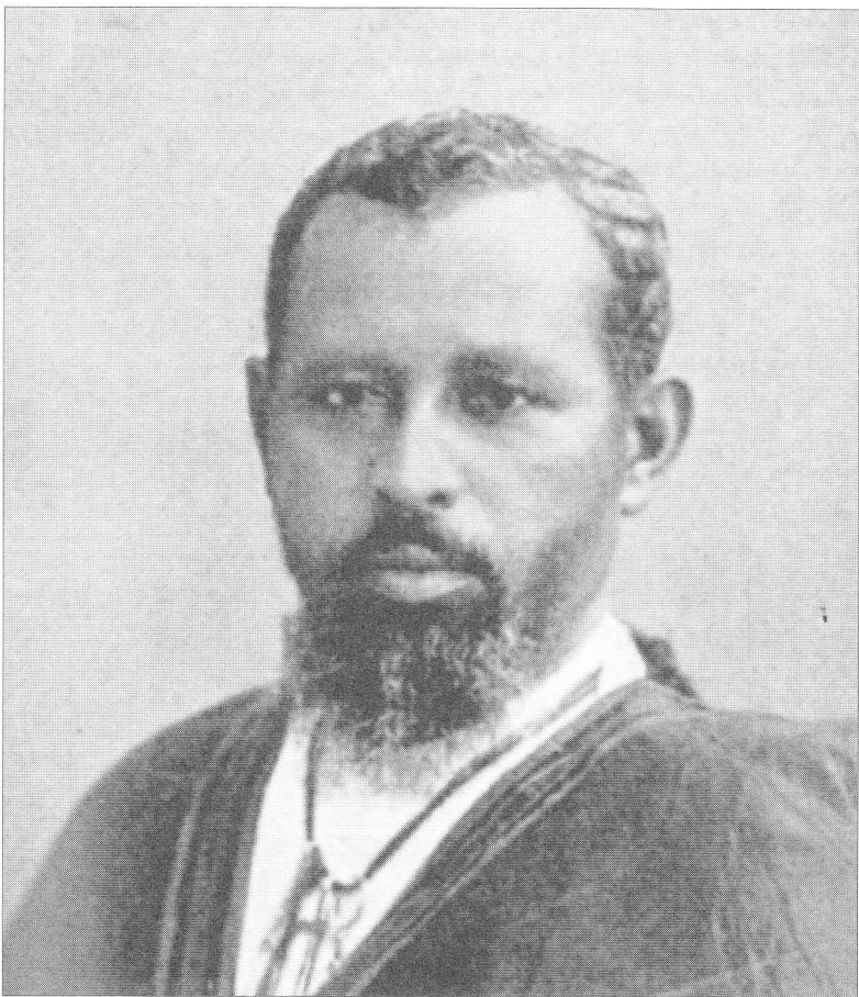
በኢትዮጵያ ታሪክ መጽሐፋቸው ውስጥ ስለ አሮሞች በሰፊው የጻፉ አለቃ ታዮ።