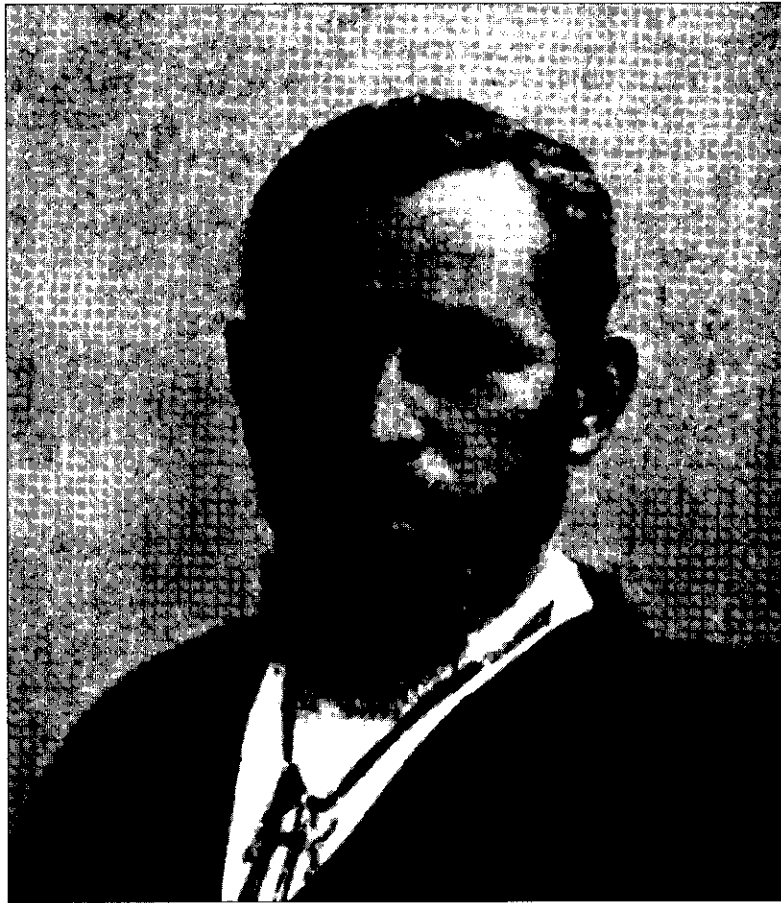
በኢትዮጵያ ታሪክ መጽሐፍቸው ውስጥ ስለ አሮሞች በሰፊው የጻፉ አለቃ ታዮ።

(ከ Gustav Arén, Envoys of the Gospel in Ethiopia , 1999)