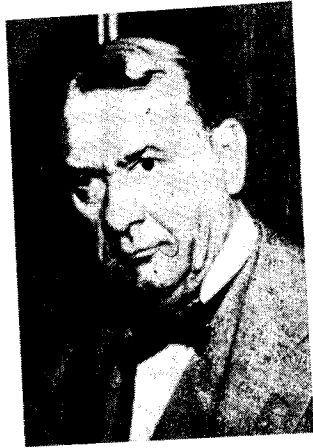
“ዳኛው” ጆሴፍ ፍራንክሊን ሮዘርፎርድ (1869-1942)

በራስላ የአስተዳደር ዘመን የድርጅቱ የሕግ አማካሪ የነበረው ጆሴፍ ፍራንክሊን ሮዘርፎርድ የድርጅቱ ሁለተኛ ፕሬዝዳንት ሆነ። ሮዘርፎርድ በኅዳር 8 ቀን 1869 ዓ.ም. የባፕቲስት ቤት ክርስቲያን አባል ከነበሩ ቤተሰብ በቦንሽል ሚዛሪ ተወለደ። የ16 ዓመት ልጅ ሳለ የሕግ ትምህርት ለመግር ኮሌጅ ገባ። በ22 ዓመቱ በፍርድ ቤት በዳኝነት መሥራት ጀመረ። በቦንሽል ፍርድ ቤት ለአራት ዓመት ከሠራ በኋላ ዋናው ዳኛ በሚታመምበት ጊዜ እንደ ዋና ዳኛ ሆኖ አገልግሎት ለዚህም ነው ሮዘርፎርድ “ዳኛው” የተባለው። ሮዘርፎርድ ከመጠበቂያ ግንብ ባለሥልጣናት ጋር ግንኙነት የጀመረው በ1894 ዓ.ም. ነበር። ወደ እንቅስቃሴው የገባው በ1906 ዓ.ም. ሲሆን፤ የድርጅቱ የሕግ አማካሪ የሆነው በ1907 ዓ.ም. ነው።