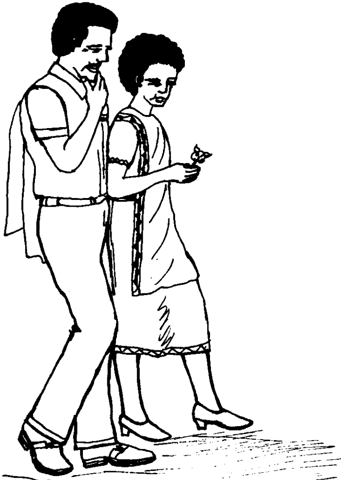
እውነተኛ ጥያቄ ወደ መጋቢ ያስታይ ቤት ጠቃሚ ምክር ለግጥናት ሲሄዱ