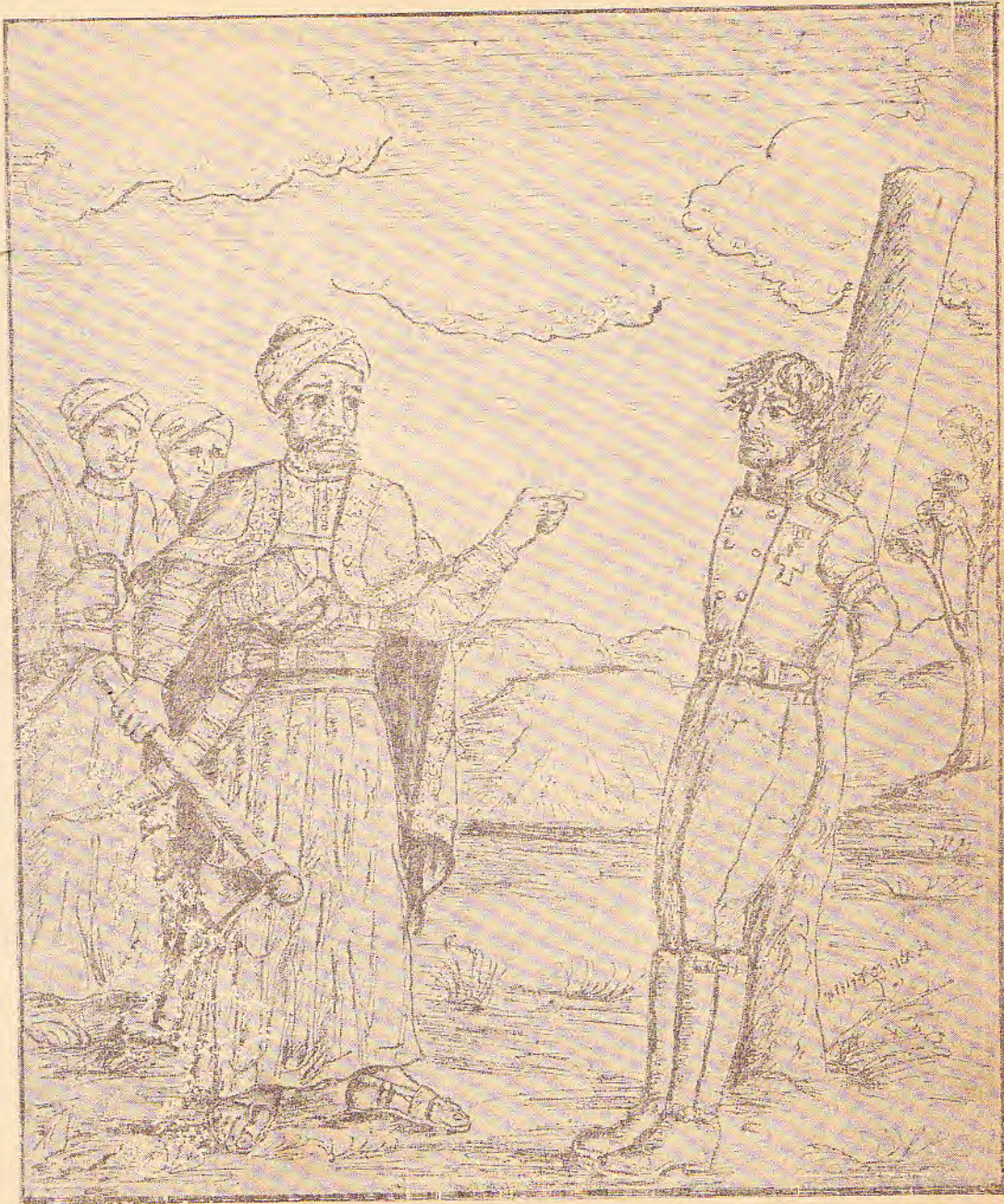
ክርስቶስ ሮስ : ደገማ : ለገደል : በግራኝ : መሐመድ : ፊት : አንደ : ታስረ : (በመላ : የገማስ)