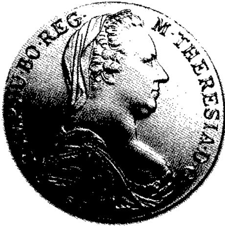
ማርያ ተሪዛ፣ (ማር ተሪዛ)ጠገራ ብር

አሰካሁን ድረስ ግን፣ ጄኔራል ልክ አንደ ጃፓን ሚካይ 87 ወይም አንደቲቤት ላማ ከኔ የተሰወረ ነበር። በነበረው ከፍተኛ ሥልጣን ምክንያት በጣም የሚከበር ሰለሆነ፣ ሊጣሰ በማይቻል የወታደሮች ዘብ አጥር ተከቧል። ከነዚህ በተጨማሪ፣ የሚያንጸባርቅ የወታደር ዩኒፎርም የለበሱ ከፍተኛ ግዕረግ ያላቸው መኮንኖችም አሉ።