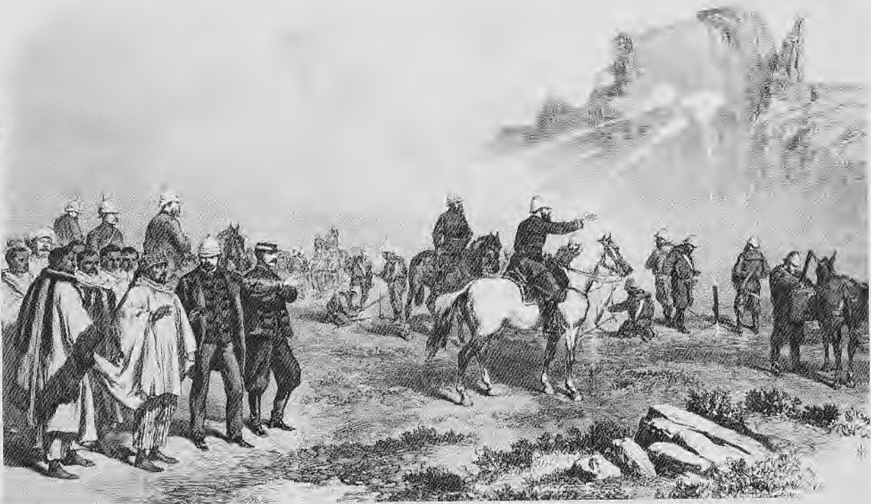
ደኞች ካሳ የሮኪቶች ጉኩሳ ልምምድ ሲመለከቱ