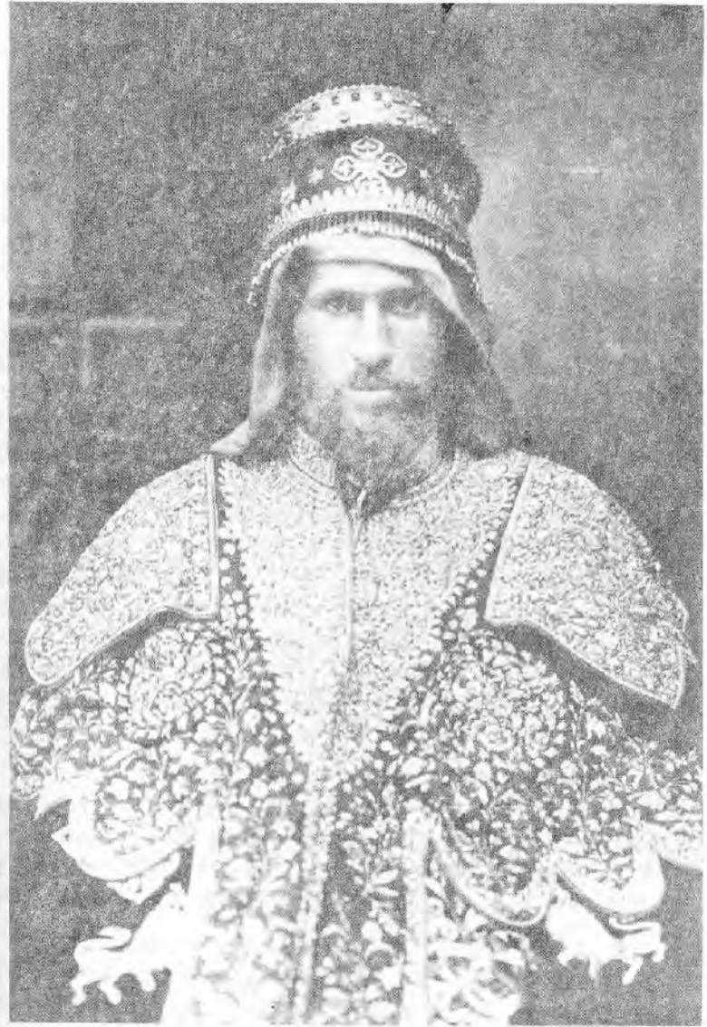
ንጉሥ ተክለሃይማኖት አዲስ አበባ መጥተው ዘውዳቸውን ባስመረቁበት ጊዜ ከፊሊክስ ሮሲር (ዲኒስ ገራልድ)