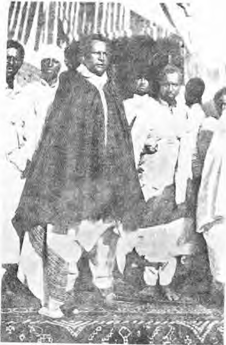
ፊታውራሪ ሀብተ ጊዮርጊስ ቢነግዴ ከሐድሰን መጽሐፍ

የሚኒስትሮች የምክር ቃል የኢትዮጵያ መንግሥት ምንም ከጥንት ገምግሞ ራሱን የቻለ ቢሆን ጭራሽ በዓለም ሁሉ የታወቀው ባዲ ምኒልክ ነው ። . . . ዐፄ ምኒልክ ሕመማቸው በርትቶ እቤት በመዋላቸው አዝነን ሳለን እረኛ እንደ ሌላው በጉች እንዳንበተን ያልጋወራሽ ልጃቸውን ልጅ ኢያሱን በመስጠታቸው እጅግ ደስ አለን . . . እኛ ግን . . . እየተሰማማን መንግሥታችንን እየጠበቅን በፍቅር መኖራችንን ትተን እርስ በርሳችን እየተጣላን ለባእድ መሃለቲያ እንዳንሆን ጃንሆይ የመከፋንን ምክር ጠንክረን ማጽናት ይገባናል ። . . . መንግሥቱን ወደ በአንድነት ተሰማምቶ የሚኖረውን ሕዝቡን አለያይቶ ለማፋጀት ደም ለማፍሰስ ጃንሆይን አንኮበር ሊያወርዷቸው ነው የሚል የሐሰት ወሬ ተወራ ። ጠላትን አጥፍተው ከትንሽ እስከ ትልቅ ሁሉንም በየማዕረጉ ሹመው ፣ ሸልመው ኢትዮጵያን አልምተው ያቆዩንን አባታችንን ጌታችንን ጃንሆይን በዚህ በነፋስ አይውጡብን ብለን ሰንጨነቅ እንዴት ያለ ክርስቲያን አንኮበር ይውረዱ ብሎ ይመክራል? ወይስ እንዴት ያለ ልጅ አባቱን አስወጥቶ እኔ ልገባ ይላል? . . . አሁንም ይህ ሁሉ ክፉ አሳብ በልጅ ኢያሱም ፣ በእኛም ልብ እንዳልታሰበ ያው መሐላና ግዝት ይደረሰብን ። . . . ይኸም የሐሰት ወሬ መንግሥቱና ሀገሩን ከሚወድ ሰው እንዳልወጣ የታወቀ ነው ። አሁንም ይህ ወሬ ከምቀኛ የወጣ ነውና ይህን ወሬ ያወራ ቢገኝ የመንግሥት በደለኛ መሆኑ ይታወቅ ። እሱ ግን ተሰውሮ ይሸን የእንክርዳድ ዘሩን እየዘራ ስንዴ ልባችንን በአረም ሊያበላሽ ያሰበ ነው ። ይኸንን ያወራ ምቀኛ . . . ከመካከላችን ነው ። በመሐላ በግዝት አውጥተን እንለየው . . . ወደፊት ጃንሆይ እንደመከፋን ነፋስ እንዳይገባ ብን አንድ ልብ ሁነን በፍቅር መንግሥታችንን ብንጠብቅ መልካም ነው ። ታኅሣሥ 11 ቀን 1905 ዓ.ም. አዲስ አበባ ከተማ 1