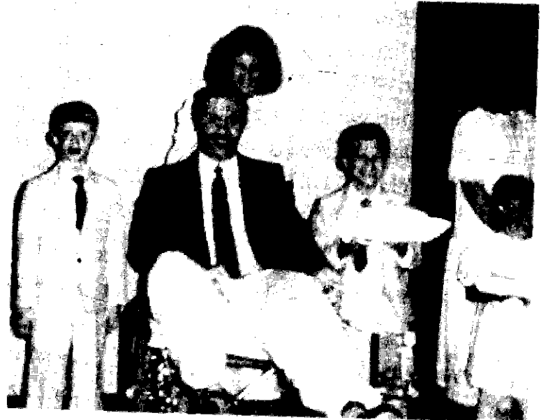
ደን፣ ከአደጋው በኋላ ሴት ልጅ በምትሳተፍበት የ “ልጃገረዶች በተግባር” የዘውድ በዓል ላይ ሲሳተፍ

ዕድሜዎ አስራ አራት አመት በሆነ ጊዜም፣ ሳውዝ ፓርክ ባፕቲስት ቤተክርስቲያን በሰኔ ወር 1989 በሚደረገው ክብረ በዓል ላይ የክብር ተሸላሚ ሆና እንደምትቀርብ ተነገራት።