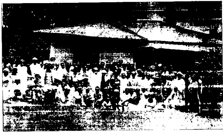
ተለቅ የሚለው የቀበሌ 05 ትልቅ ቤትና በወቅቱ የነበሩ ምዕመናን (1970 ዓ/ም)

ዚያ ቤት ውስጥ 1970 ዓ/ምን ተገልገልንበት። በጥር ወር አቶ በቀለ ወልደ ጻገን፣ ወንጌላዊ ደላላን ደምሴና ፓስተር ተሰፋ ወርቅነህ ከአዲስ አበባ፣ በሰኔ ወር ላይ ደግሞ ወንጌላዊ (አሁን ይክተር ሆኖአል) ዓለማየሁ መኮንን ከባሌ ገባ ስትምህርት ያገለገሉባቸው ሁለት የማኅቀዲያ ኮንፈረንሶችንም በማካሄድ ተናናገሩት።