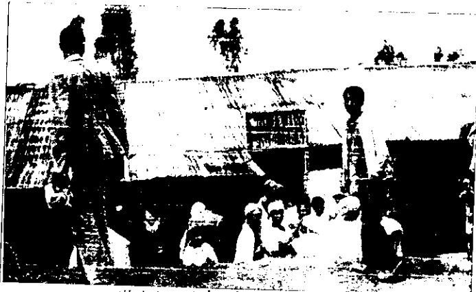
የአራዳው ጸሎት ቤት - ከመዘጋቱ በፊት

ሚያዝያ ወር ላይ፣ የአራዳው ጸሎት ቤት በወቅቱ በነበረው የተበሉው ጽሕፈት ቤት ትዕዛዝ ተዘጋ።