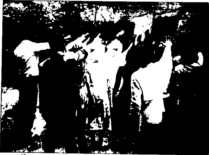
እኛ ግን የአምላካችንን ቤት ከቱ አንተውም በሚለው ቃል መሠረት ለመንፈሳዊ አገልግሎት የተገባ ተምሳሌታዊ ቃል ኪዳን

1971 ዓ/ም በቀላሉ የማይረሱና ዋጋቸው የላቀ ትዝታዎችን ጥሱልን አልፏል። ከእነዚህ መካከል እንዲያው የእግዚአብሔር መንፈስ በኃይል በመውረድ የገበኝነትና ከፊታችን ያለውን ሁኔታ በማስመልከት ግልጥ የሆነ መልዕክት የሰጠበት እስደናቂ የአሁኑ አምልኮ ቀን ነው። ቀኑን በትክክል ባናስታውስም ጊዜው የሰኔ ወር መጀመሪያ ግድም ነበር።