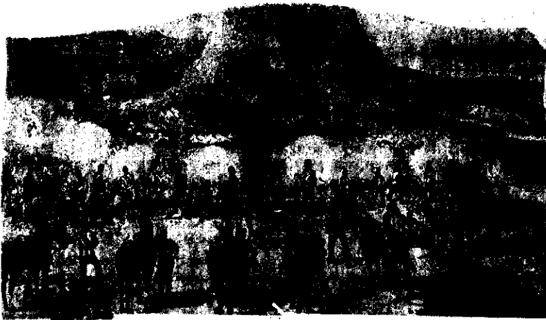
La presa di Magdala chiude vittoriosamente la spedizione inglese di Sir Napier nel 1868. In una cartolina da posta