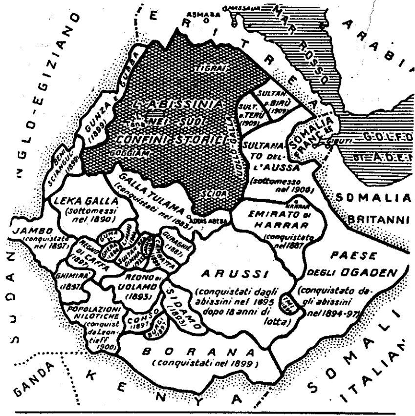
I confini storici dell'Abissinia e le conquiste scioane dal 1882 in poi

በይቡብ ምሥራቅና ምዕራብ ኢትዮጵያ ለጥቃቅን መንግስታት መከተረላ የነበረው የፖለቲካ ሁኔታ የአጼ ምኒልክ ጣሊያ ገብነትና የመልስ ጥያቄ ህጋዊ ያደርገዋል።