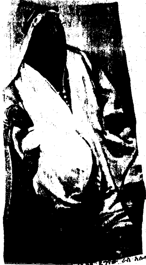
የጸገራ ጸኔ ራስ አሉላ RAS ALULA

ራስ አሉላ ለጊዜው ወደ ጎድግዳ ጉዞውን እንዳይጀምር ለግሊያቢን ይነገረውና ጣሊያኖች ከዊን ተነስተው እንደሆነ ለግረጋገጥ ወደ ጊንዳህ ለመሄድ ይዘጋጃል። ሆኖም ግንኙነት ነገር ቢደርስ ጉዞቸውን የሚቀጥሉ መሆናቸውን ግረጋገጫ ይሰጠዋል። እሱ ገን የጸገራ ጸኔ ሙሉ ለጽኑ ልባት ለጥጋቤ ካልሆነ በመፍራት ከእኛ ለገድ ሰው ወደ ምጽዋ ሄዶ ከጸገራ ጋር እንዲነጋገር ብሎ ሀሳብ ያቀርባለታል። 2 ራስ አሉላ ገን ረያፍ ነጋዴ ግደሆን የሊጣሊያ ጦር ሠራዊት ሻለታ መሆኑን ስለሰግ ጃንጥሪ 12/1887 ዓ.ም ቤት መገንደቅን ሁሉ ወደ ድንኳን ይጠራቸዋል። በግም በተዘተዘ እነጋገር ከአገድ ሰጎት በኋላ በጊንዳህ ጠኑል ወደ ስሐቲ ሄዶ ጣሊያኖች እውነት ሊትቀጽጥ ወረው እንደሆነ ለግረጋገጥ እንደሚረሉ ገልጾ የጸገራ ሙሉን እንደመጣለት ጉዞቸውን የሚቀጥሉ መሆናቸውን ይነገራቸዋል። ጸገራ ገን ራስ አሉላ ከምጽዋ ጣሊያኖችን ለግባረር ከአሥመራ ተነስቶ ወደ ምጽዋ እየ ገሰገሰ መሆኑን የግሊ መረጃ ሰጠደረበው ጥገና ሌሎች ጦር ሠረዞችን በወታደርና በመግሪያ ግጠናክር ጀመረ። በዚያው ለለት ጊንዳህ የደረሰው የሊትቀጽጥ ጦር እኩስ ጃንጥሪ 21 ጥገ ለቀ እንዲወጣ ጎቻ ያዘለ ደብዳቤ ይጽፍለታል። ጸገራ ጸኔ ገን ወታደርነቱ ወደ ጥገ የተላኩ ፀጥታ ለግብዝር ስልጣን ካሉበት እንደግደነሱና እንዲያውም የግሊ ጠናክራቸው መሆኑን ይጽፍለታል፤ ተወግሮ ጦርም ከሆነ፤ እንዲላክለት ይጠይቃል። በዚህ ጊዜ ከገቲባ ከፋ 3 የራስ አሉላ ወንድምና ወኪል በራስ አሉላ ትእዛዝ መገንደቅን አሰር ያለ ምግብ ከአሥመራ ወደ ጊንዳህ እምጥቶ በዝናብና በጠርድ ያስቀምጣቸዋል። ጃንጥሪ 17/1887 ዓ.ም ወደ ራስ አሉላ ድንኳን ቀረቡ፤ በፎግምንቶቹ ተከቦ ተቀበላቸውና ራቱን አቡግትር ለግሊያቢን እንዲህ ሲል ጠየቀው «የሊትቀጽጥ ወዳጅ ሃኝ አላለክኝም ክር?» ግሊያቢን «ምንም እላውትም» አለ። ራስ አሉላም በቀጣ ገንፍሎ «ለጸገራ ጸኔ ከዊን ወታደርነቱን እንዲያስወግድህ ገና ገልግልኝ» አለው።