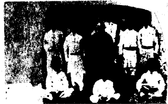
A. EDC. MONX. CATTANEO TRA I GIOVANI CATTOLICI