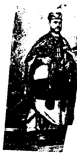
- II. RE GIOVANNI.