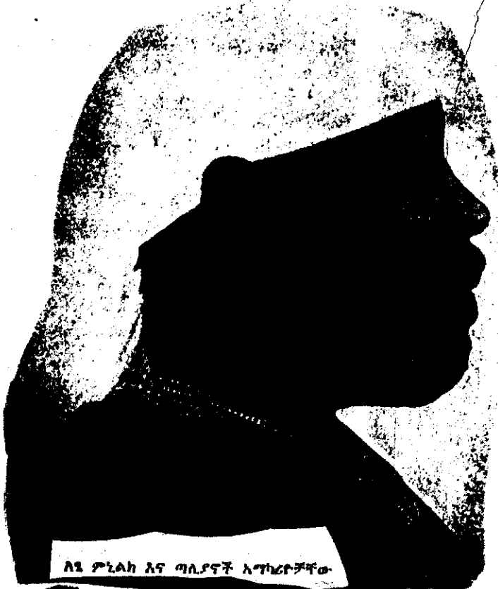
አዲስ ምኒልክ እና ጣሊያኖች አግካሪዎቻቸው