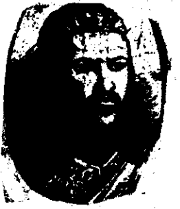
ለጼ ቴዎድሮስ ለርሶ ኖፐር

የተባበሩት የጦሩ ጓዶች፤ ግን ቴዎድሮስ እንደተመኘው ብዙ ሳይቆዩ ተበቃተኑ፤ በዚህም ጊዜ ከሁሉም ኃይለኛ ተብሎ ተፈርቶ የነበረ ራስ ጎሹን ቴዎድሮስ በቡራም ተራራ አጠገብ ደምቢያ ሰብቻው ጦርነት ገጥሞ ዘራስ ጎሹ ላይ የሸገበር 13 ቀን 1852 ዓ.ም. ድል ተቀዳጀ። ለጥሪል 5 1853 ዓ.ም. ራስ ዐሊ 130 ሺ የግደረገዝ ጦር ዘመ ምራት ከቴዎድሮስ ሲሰ የግያህላ ሠራዊቱ ጦርነት ገጥሞ በጥራገራ ሳይተናው ስለተረ ለሁለተኛ ጊዜ ጁን 23 ቀን 1853 ዓ.ም. ጦርነት ገጥሞ ምንም እንኳን በጀገንነት ቢዋጋም ወታደሮቹ ለሰከፉት የራስ ጎሹ ልጅ ብሩም ለአቀድሞ ከቴዎድሮስ ጉን ለመሳልፍ ስለወሰነ ደጃዝማች ወብም ከጦር ግዳ ራሱን ስላገለለ ራስ ዐሊ ተሸናፊ በመሆን ሸሸቶ ወደ ደራ ሄደ። ቴዎድሮስ ወደ ትግራይ እና ወደ ሸዋ ከመሄመቱ በፊት ግይ 1/1854 ዓ.ም. ወደ ጎጃም ከምቶ በራስ ብሩ ላይ የራስ ጎሹ ልጅ ጦርነት ገጥሞ በተላሉ ድል ተቀዳጅቶ ራስ ብሩ ተግርካ በወታደሮች ፊት በእሳት እንዲቃጠል አደረገው።