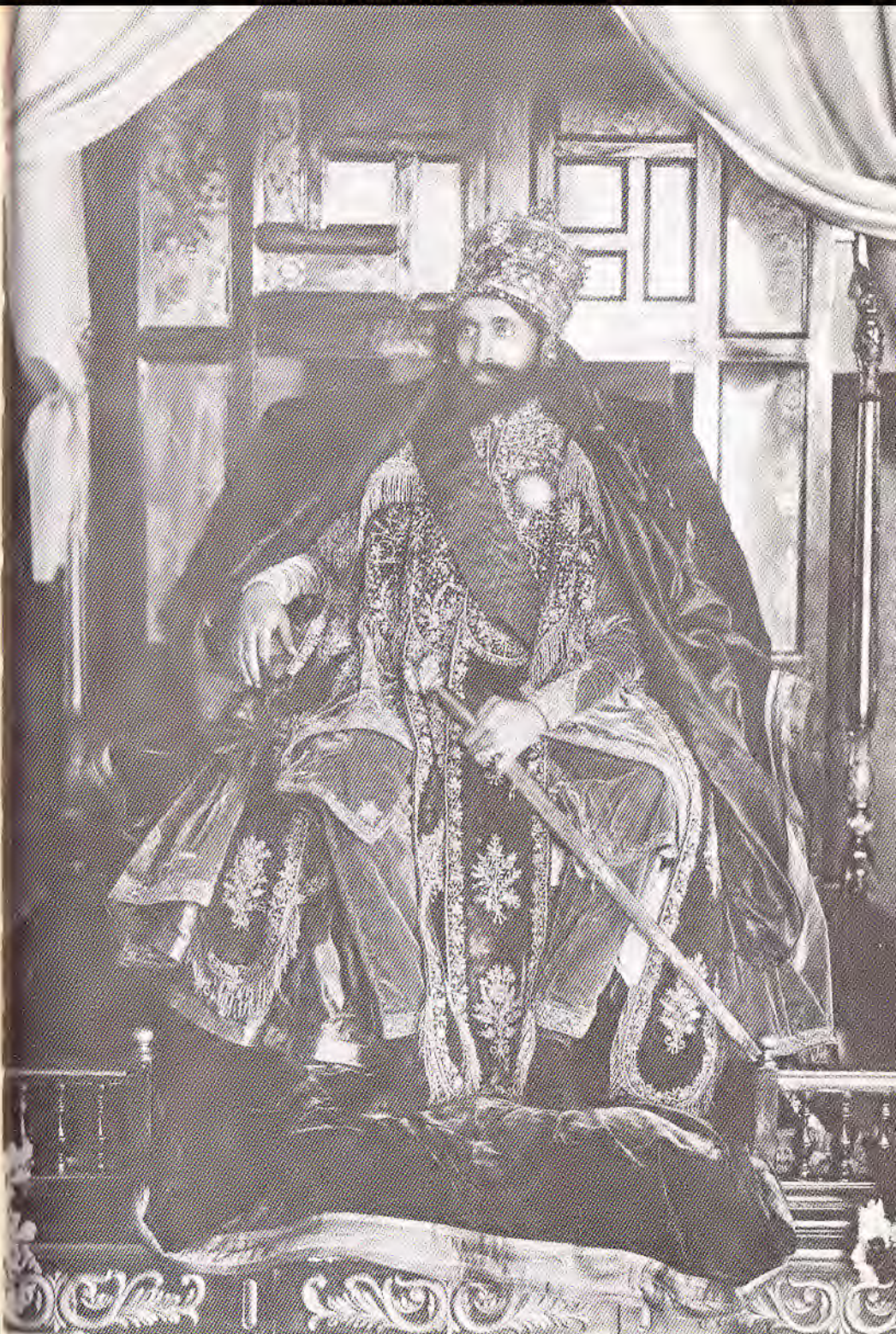
የገንጠት ዘውድ በሜንገ ጊዜ ።