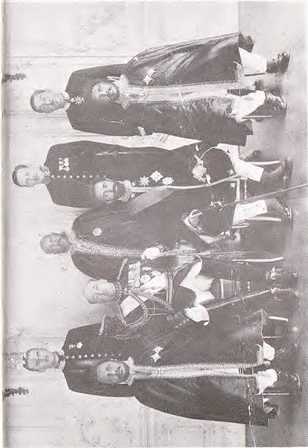
Ամուսնացի Ստեփաննի անդամները: Երեսները: Ծաղիկները: Կրկին (Մ. Բ. Բ.) Ամուսնացիները: