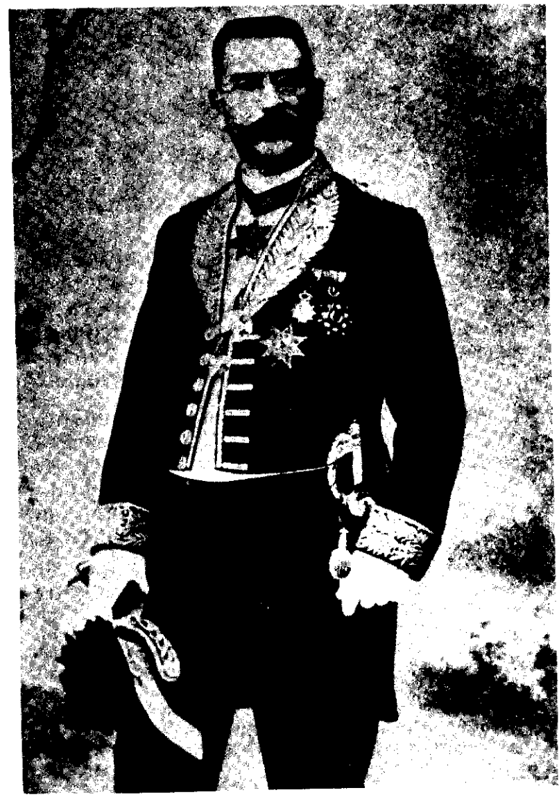
የዐፄ ምኒልክ አማካሪ እንጂኒዮር አልፍሬድ አ.ልግ ከክሪስቲ መጽሐፍ

እንዳንድ የቤተ ክህነትና የቤተ መንግሥት የዋሃን የሆኑት ባሰሥልጣኖች የስልኩንም ፣ የመኪናውንም ሥራ የሰይጣን ሥራ ነው እያሉ ያገረመረሙት እያደር የምኒልክን አያያዝ የተሠራውን ሁሉ የሚሰጠውን ጥቅም በመገምገም ፣ ሌላው ሲያደንቅ የነርሱ ኩር ፊያ ዋጋ እንደሌለው በመረዳት ፣ በግድም በውድም በመጨረሻ የሥል ጣኔው እርምጃ አባሪ ተባባሪ ወደ መሆን አዘነበሉ ።