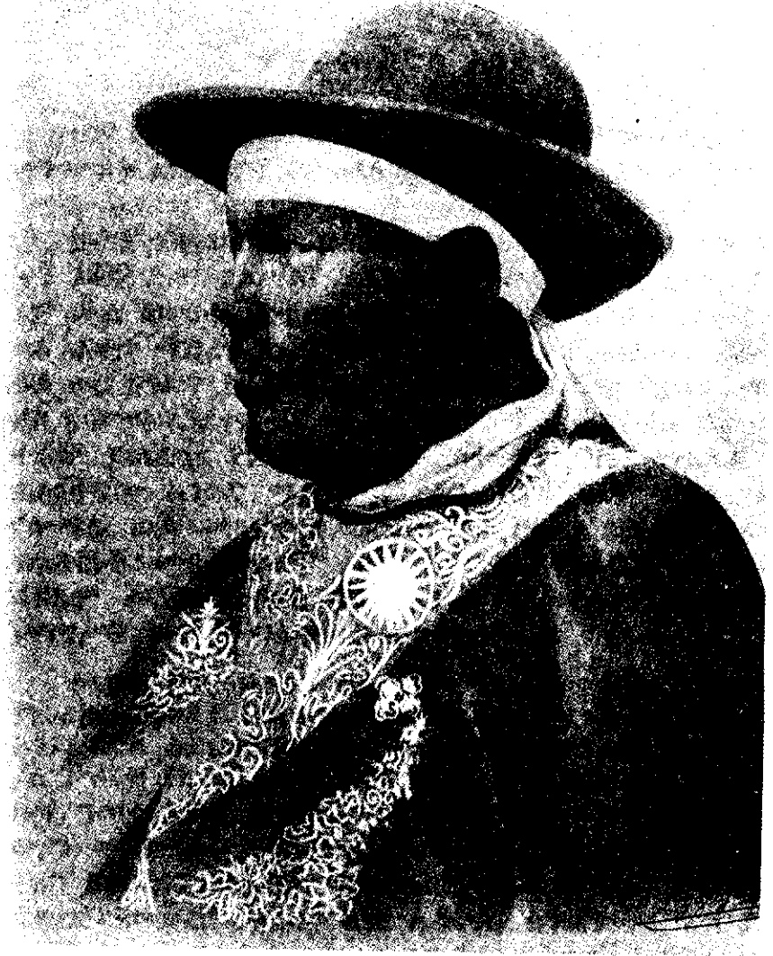
አፈ ንጉሥ ነሲቡ ከሞረስ ደኮፒ መጽሐፍ

ባለቤታቸው ወይዘሮ ደስታም በበኩላቸው፣ “ባንቺ ውቃቤ በእግዚአብሔር ምሕረት ልጅሽ ከሞት ተርፎ መጥቶ በዐይነ ሥጋ ልትገናኙ ነው። መድረሱንና ካንቺ መገናኘቱን ጸፈልኝ። የሚል ጽፈዋል” 3 ። በዚህ ዐይነት ምርኮኞቹ በተለይ ሹማምንቱ በመልካም ተይዘው እንደነበር ለመረዳት አያዳግትም።