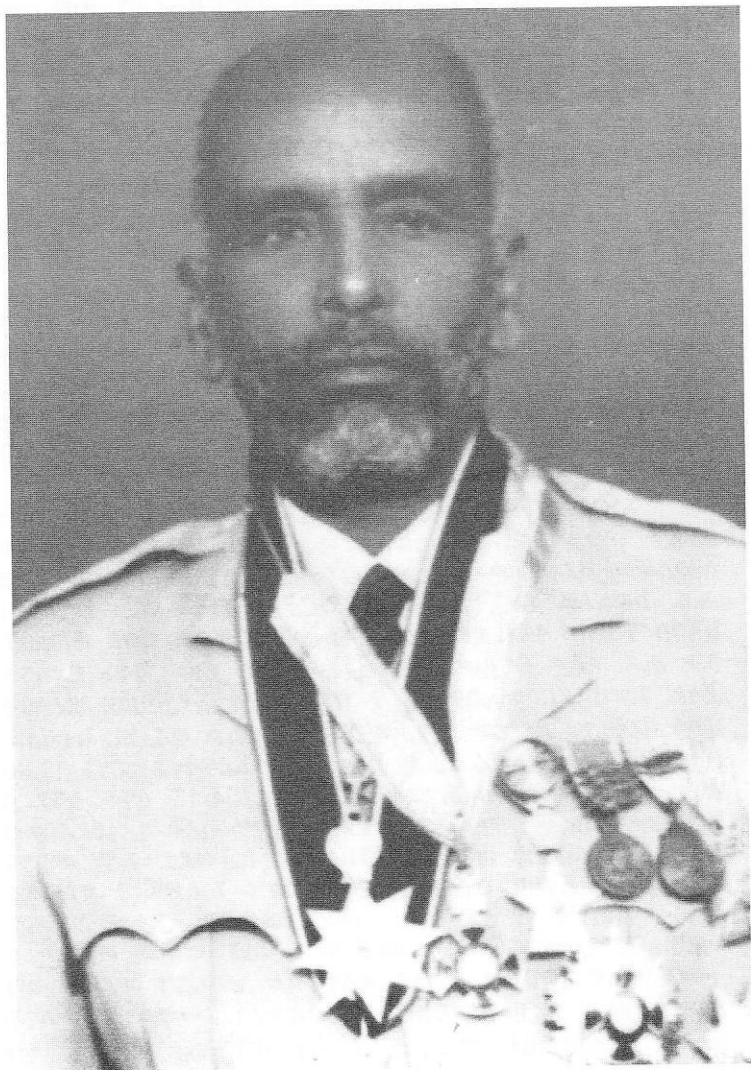
ክቡር ቢትዎደድ አዳነ መኮንን