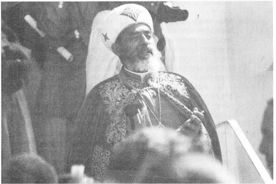
ብጵሶ ወቅዱስ አቡነ መልክ ጸዴቅ