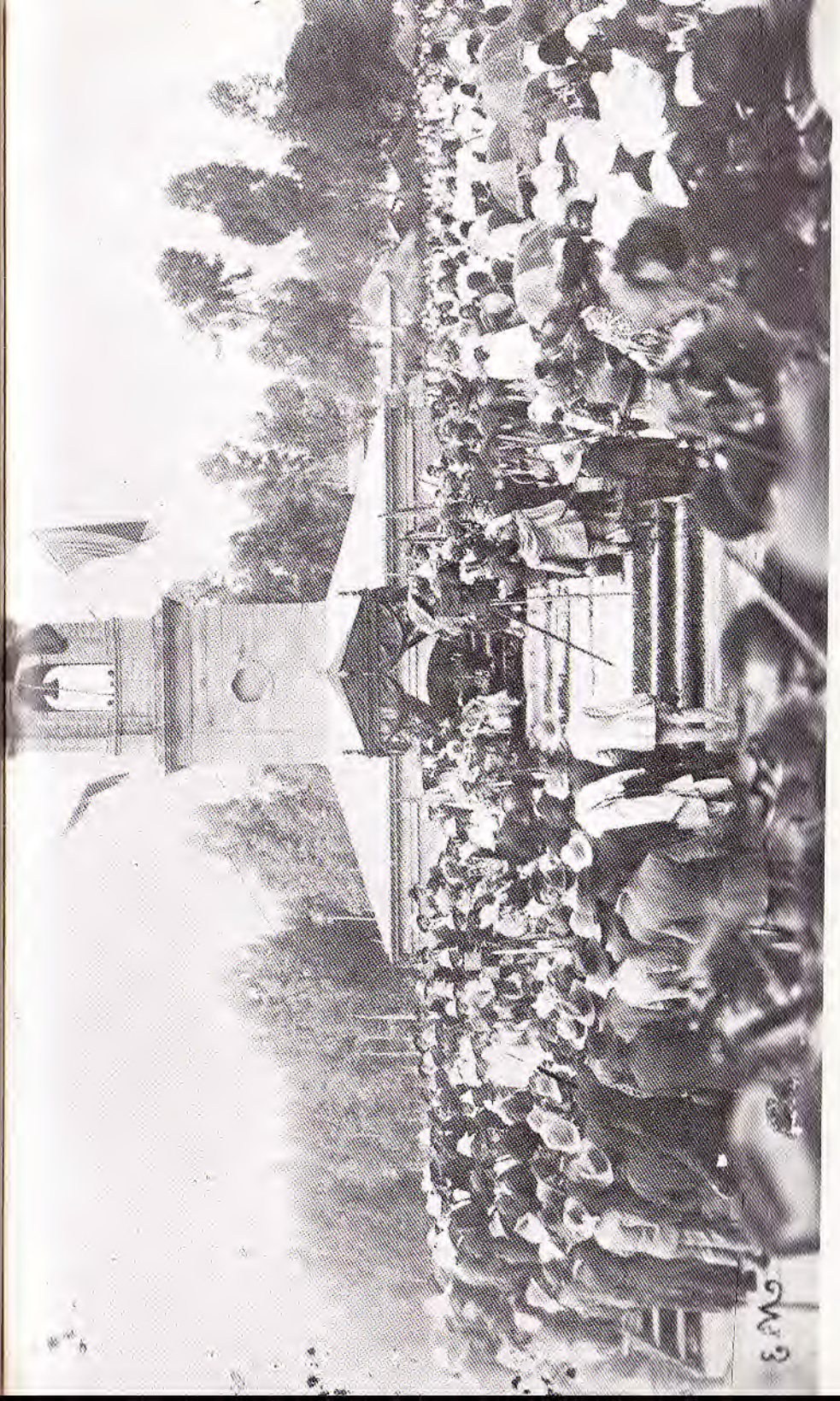
የግሪክ ኦርቶዶክስ ማኅበር ማኅበር