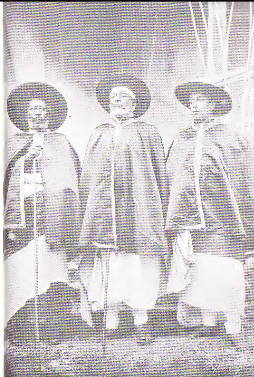
1926 ዓ.ም. ቀኝ ራስ ወልደ ገዮርጊስ (ንጉሥ) ፣ ንጉሥ ሚካኤል ፣ ልጅ አያሱ ።