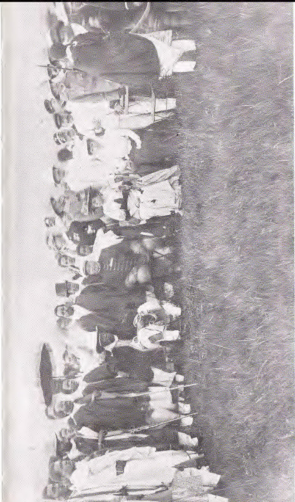
የግንባታ ምኒልክ ባሕብጉ ከቆሙት ሠብዓ ራስ ተግባር ፡ ሠሌዳ ራስ ሠልጣን ገዢ ገብ ደጃች ተፈሪ (ቀ. ፡ ፡ ፡ ፡ ፡) ደጃች ናደሙ ፡ ደጃች ብሩ ፡ ቀንዳግታ ፡ ኃይለ ሥላሴ ሠግቱ ፡ በጅርግድ ዘላቀ ሠብዓ ራስ ፡