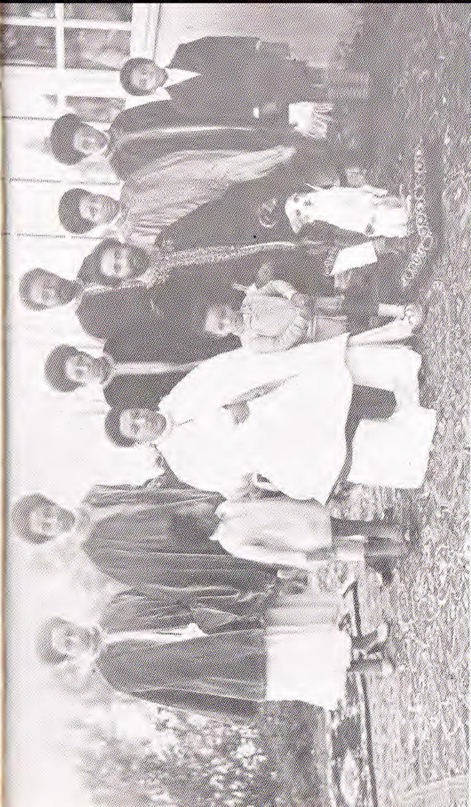
ከቀኝ ወደ ግራ ፡ ልዑል መኩንን ፡ ልዕልት ወለተ ጸኤል ፡ ቀዳማዊ ኃይለ ሥላሴ ፡ ራስ ያስታ ፡ ልዕልት ተናን መርቅ ፡ ግርማዊት ኦቲጊ ፡ መንን ፡ ልዑል አልጋ ወራሽ ፡ ልዕልት ዘገባ ወርቅ ፡ በእቲጊ ግራና ቀኝ ሕዳዊቱ ዓይድዓ ያስታና እምሩ ያስታ ።