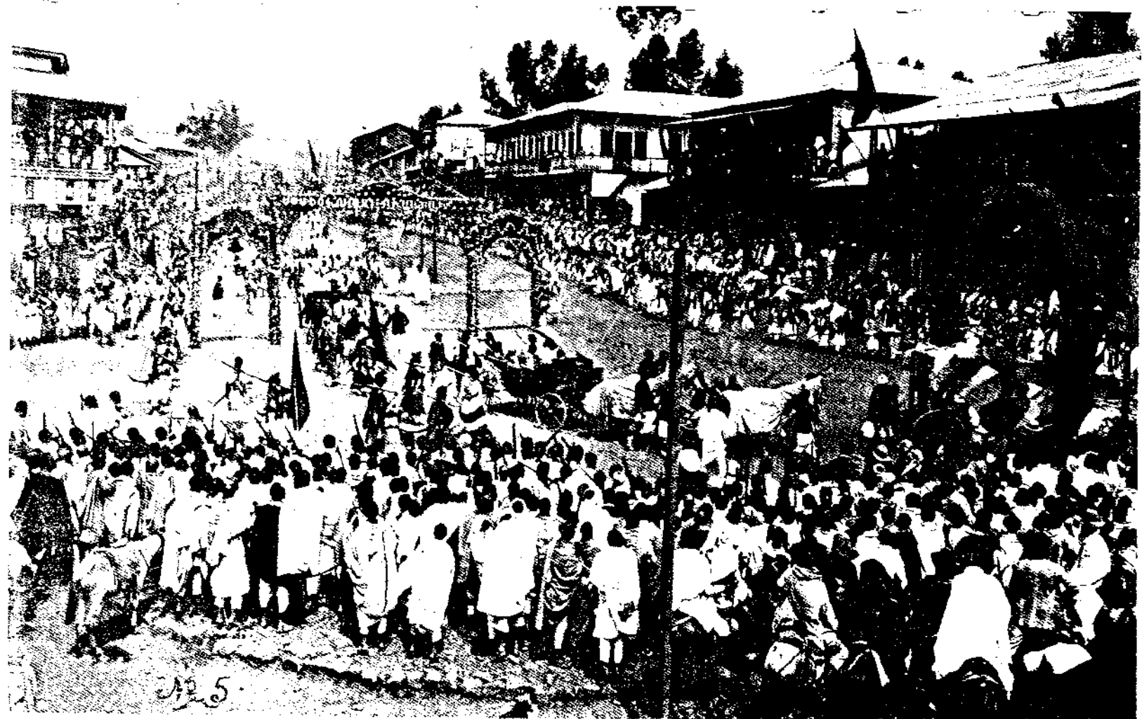
የግርማዎች ንግግር ዘውድ፣ የንግግር ዘዓል ።