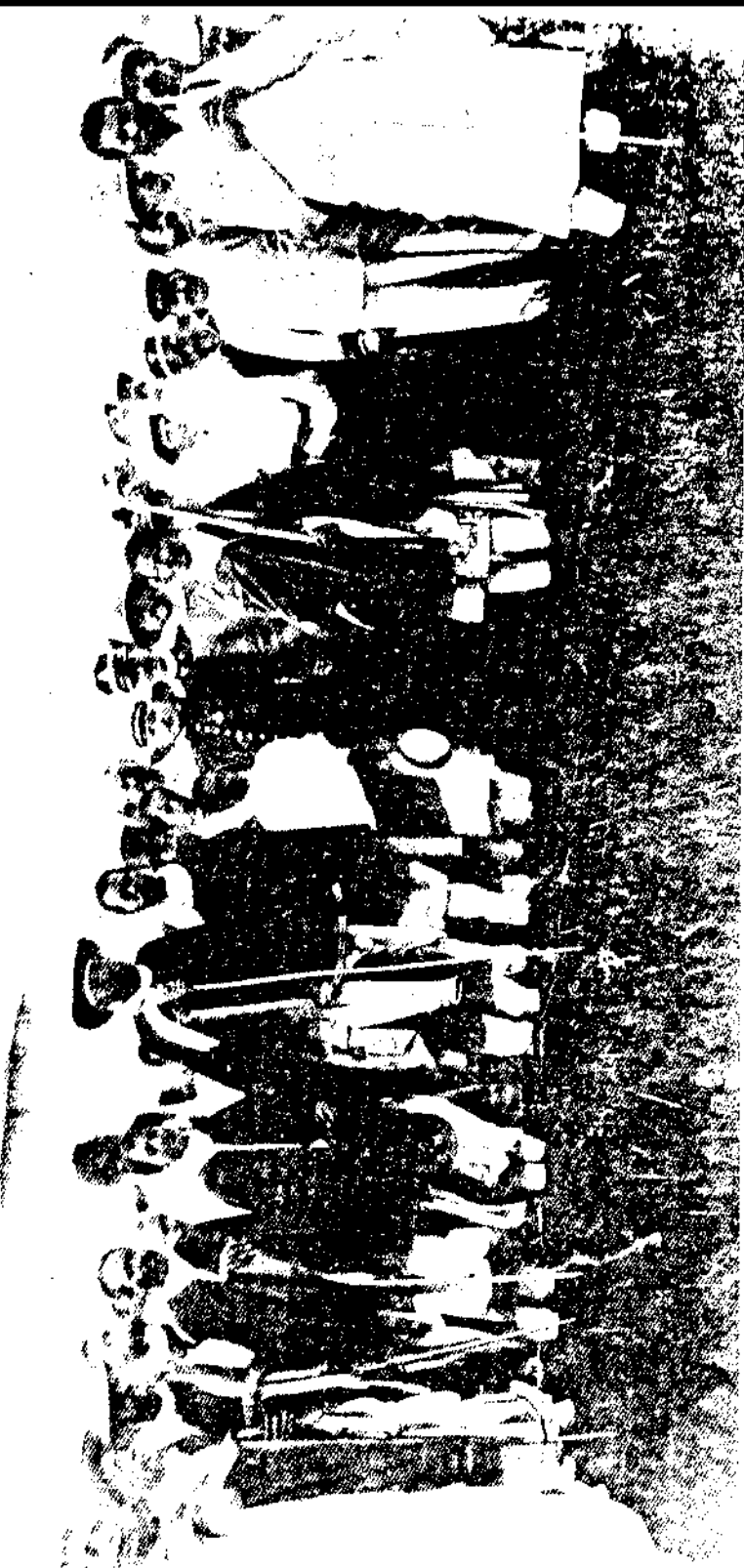
የፖለቲካ ግንባታ ህዝብ ክብር ሲባሉ ሲሆኑ ገና

በሰኔ ፲፬ ቀን የሮማ ፓፓ ፒዮስ ፲፩ኛውን ለመጉብኘት ቀጠሮ ተደርጎ ልን ነበርና በቀጠሮው ሰዓት ወደ ቫቲካን ቤተ መንግሥት ሔደን ተገና