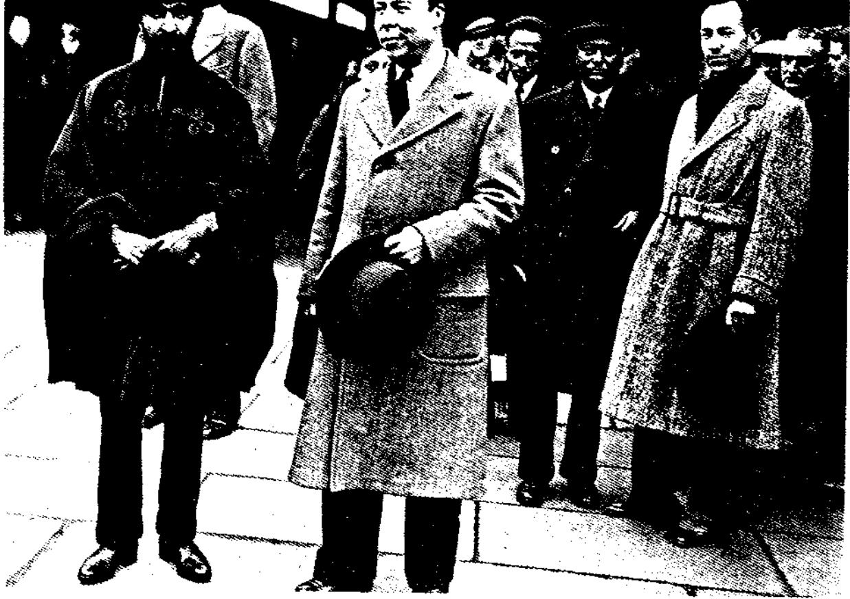
በስደት ላለፉ ጸ