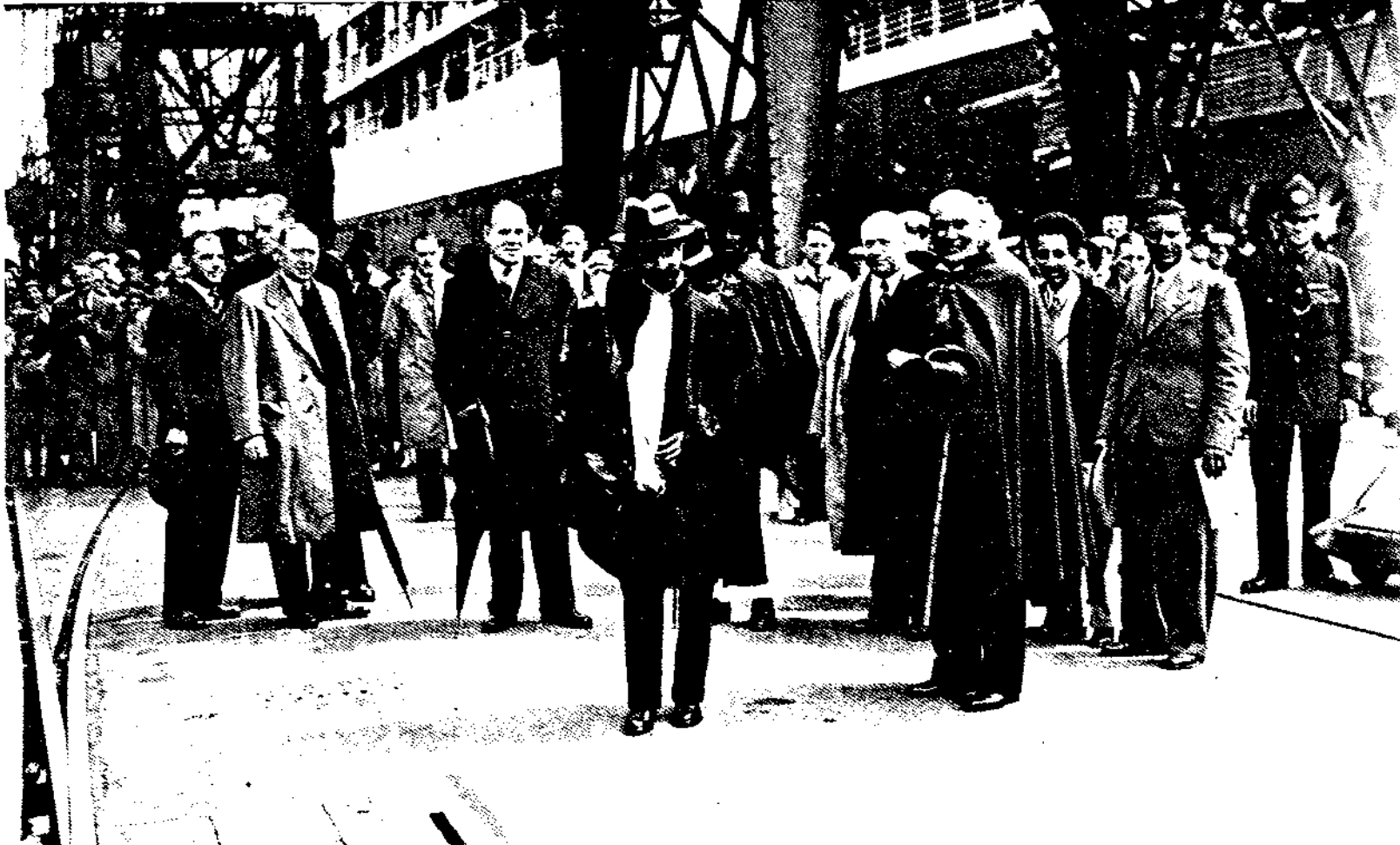
በበይተ ሎንዶን ሰንገረ በግራቸን በኩል የሚታዩት ኢትዮጵያውያን ልዑል ራስ ነሣ፣ አሳዥ ወርቅነህ ልዑል አስፋ ወሰን አቶ ወልደ ጊዮርጊስ (አሐፊ ትእዛዝ)