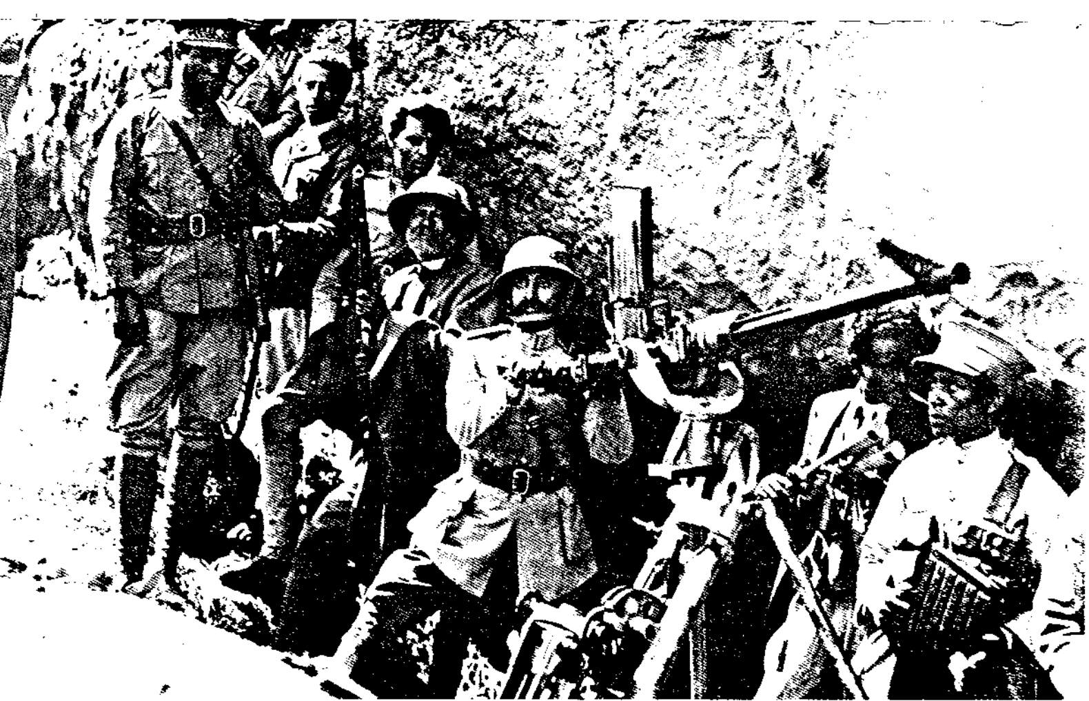
በጦሩ ግንባር ባለገበት ወቅት ።