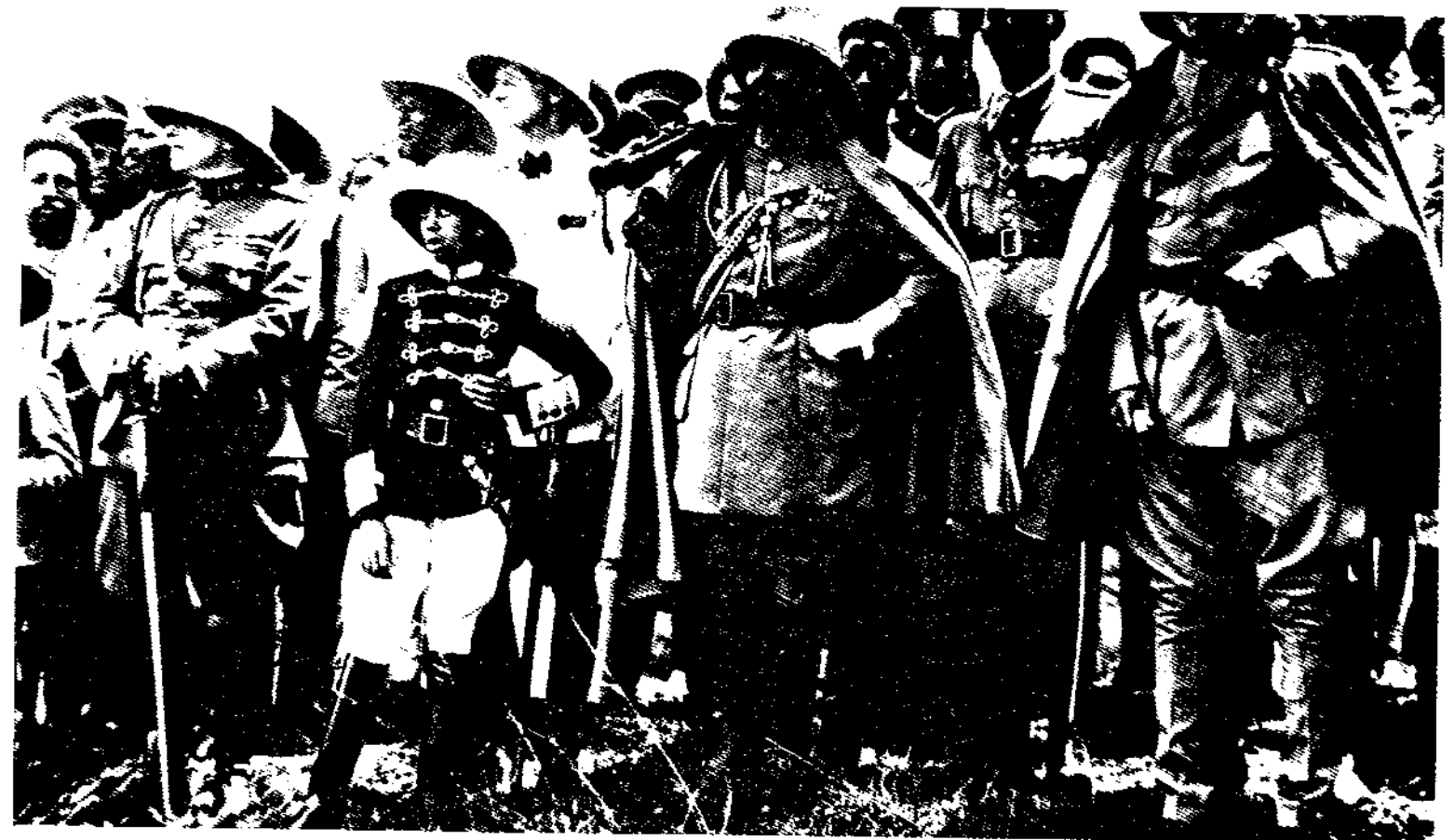
የዐር ሆላድ በንመለከት ዘገራ ልዑል መኩንን በቀኝ በኩል ደጃች ነሲቡና ደጃች ኃይለ ሥላሴ