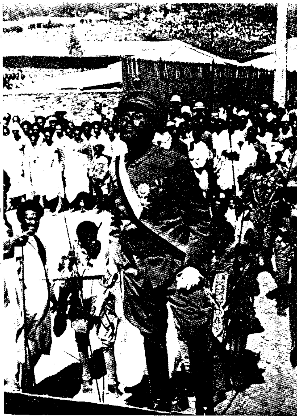
ዚቲወደድ ሙኩንን ደፃሎው ወደዘመቻው ለመሄድ በቆዩረ ሲሰናበተን ።