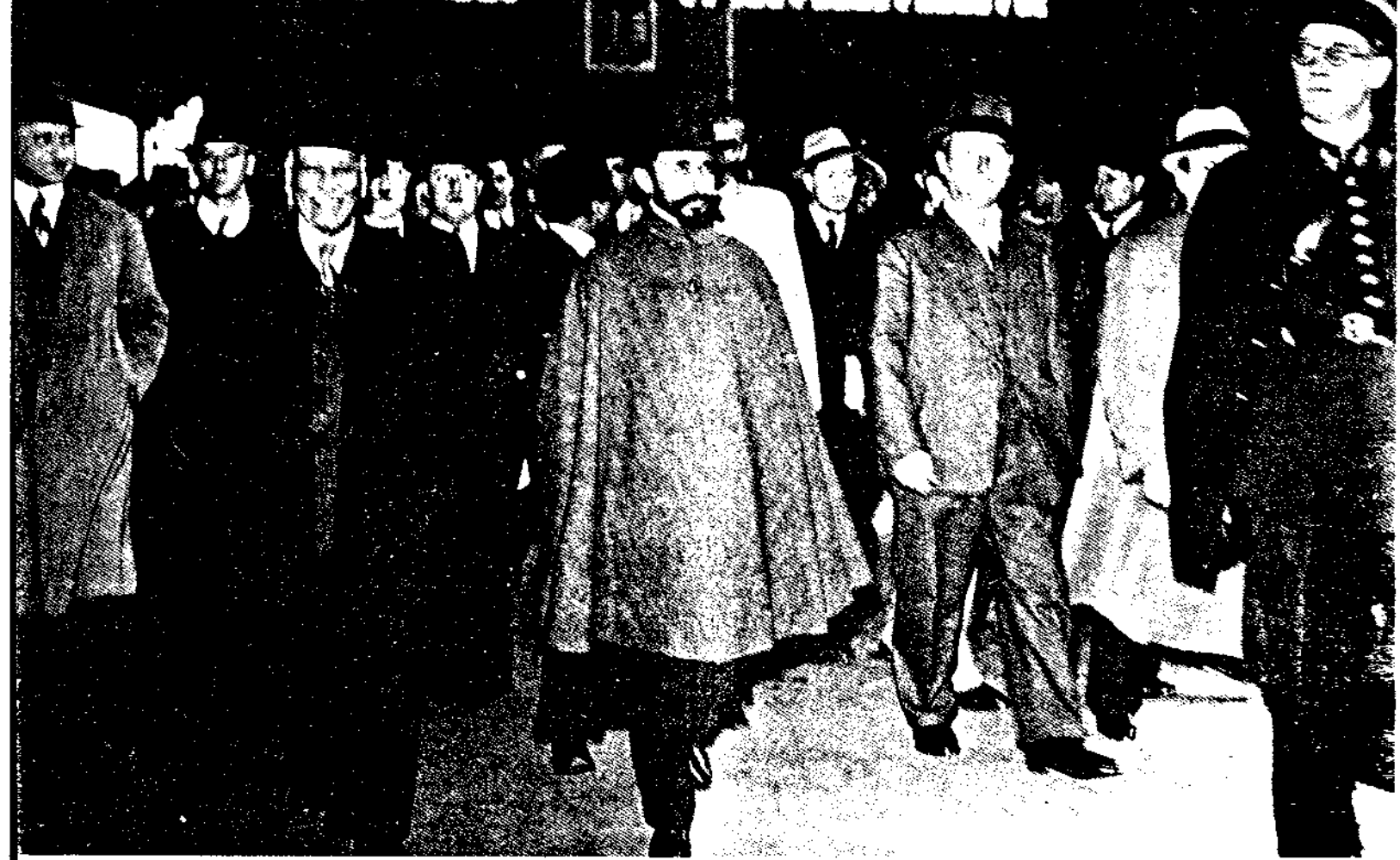
በስደት ወደ አንግሊዝ እንር ስንገባ ፡ በቀኝ በኩል አቶ ሱረኛን ስለነበሩ (በላይኛ ጌታ) አዳኝ ወርቅነዎ ፡