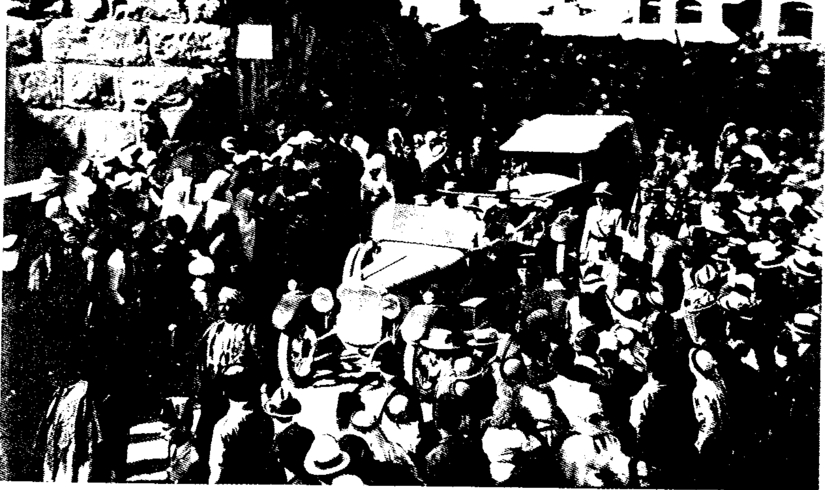
በስደት እ.የሩሳሌምን በጉብኝት ሰዓት