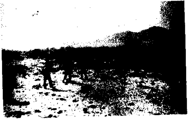
ከአሲምባ ቃሊም የሰራዊቱ ጉዞ

ሀይቅ መስሐል ስንደርስ አራቱ ጋንታዎች ወደ አጉላላ ሲሄዱ፣ እኔ የነበርኩባት ጋንታ ሀይቅመሳል እንድትቀር ተደረገች። የቀረነው አንድ ሕዝቡን ያስቸገረ ሸፍታ መኖሩን በመስማታችን እሱን ለመያዝ ነበረ። ሸፍታውን በቁጥጥር ስር አድርገን ለሦስት ቀናት የፖለቲካ ትምህርት እንዲሰጠው ተደረገና ትጥቁን አስፈትተን ለቀቅነው። አራቱ ጋንታዎች ያሉበት ቦታ ስንደርስ የአጉላላን ከተማ ተቆጣጥረውና የሄዱበትን ተልእኮ አሳከተው ጠበቁን።