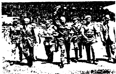
ጄኔራል አማን ግብረ-ገብርኤል ለአዲስ አበባ ስታዲየም ለአዲስ አበባ ሰብስቦ የሚገኙ የጉብኝት አባላት ሲሆኑ

ከጉብኝቱ መልስ የደርግ አባላትን ሰብስበው የጉብኝታቸውን ሁኔታ ካሰረዱ በኋላ ውይይት ተደረገ። አማን የኤርትራ ህዝብ ሠላም እንደሚፈልግና፤ ሠላም ማውረድ እንደሚቻልም ጠቅሰው “መንግስት መከተል ያለበት ሰጥቶ የመቀበልን መርህ ነው” የሚል ድምዳሜ አከሉበት። ይህንንም ሲሉ የኤርትራ አማካኝነት ትጥቅ ለማስፈታት ቢያንስ የፌዴሬሽን ጥያቄ ማንሳታቸው አይቀርምና ምላሽ ለመስጠት መዘጋጀት ከእኛ ይጠበቃል ለማለት ነው።