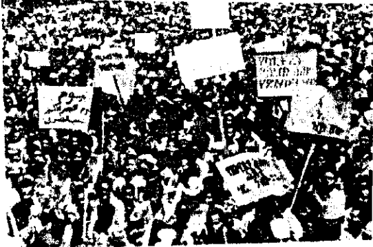
የመሬት አዋጅን ደግፈው ሰልፍ የወጡ ዜጎች ለአዋጁ ተግባራዊነትና ስኬታማነት፤ እንዲሁም ዘላቂነት ይረዳ ዘንድም፤ እንደአስፈላጊነቱ የመሬት ድልድል የማድረግ ስልጣን ያላቸውን

አዋጁ የመሬት ይዞታን በአስር ሐክታር ሲወሰን፣ ከዚያ የተረፈውንም ቀድሞ በሰው መሬት ላይ በጉልበቱ ያገለገል ለነበረው መሬት አልባ ጭሰኛ በመስጠት መሬት አልባውን ባለመሬት ያደረገ ሆነ።