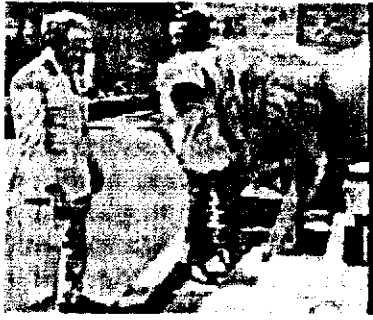
አንበሳ አገራዊ ጃንሆይ

ሁኔታው ያለቀለት መሆኑ ገሃድ ወጣ። አብዮቱ መያዝ ከሚገባው ትንፋሽ በላይ የያዘ የልጆች ፊኛ መስሎ ተወጥሯል። እንዳያስተነፍሱት በማይፈታ አስተሳሰር ከሜፍ ታሰሯል፤ የቀረው መፈንዳት ነው፤ ለዚህ ደግሞ ቅንጣት ምክንያት ብቻ በቂ ነበር። ያላቸውን ኃይል ተጠቅመው ያሳበጡት በውጭ አገር ያሉት ለሥልጣን ሲባሉ ይህን የሚያስቡበት ጊዜ አጡ፤ በቅርብ ያሉትም ከፈንዳ በኋላ ስለሚነኩት አዲስ የልጆች ፊኛ ሲያውጡት ነበር። በመሆኑም አገሪቱ በአስር አለቆች መመራትና ብዙ እልቂት መድረስ ነበረበት። በሌሎች ይሁንታ ያበጠውን አብዮት ማፈንዳት ለወታደሩ ቀላል ነበር። እናም “ለማስተባበር” በሚል መነሻ ከየጦር ክፍሉ ተውጣጥተው እንደቀልድ በላንድሮቨር መኪና ለሰብሰባ መጡ፤ በዚያው ተባብረው፤ አስተባብረው፤ በዚያው ስልጣን ይዘው፤ ባላሰቡት መንገድ አገር መርተው፤ በዚያው ቀሩ። ለማንኛውም ባየነው መልክ የኢትዮጵያ አብዮት አበጠ።