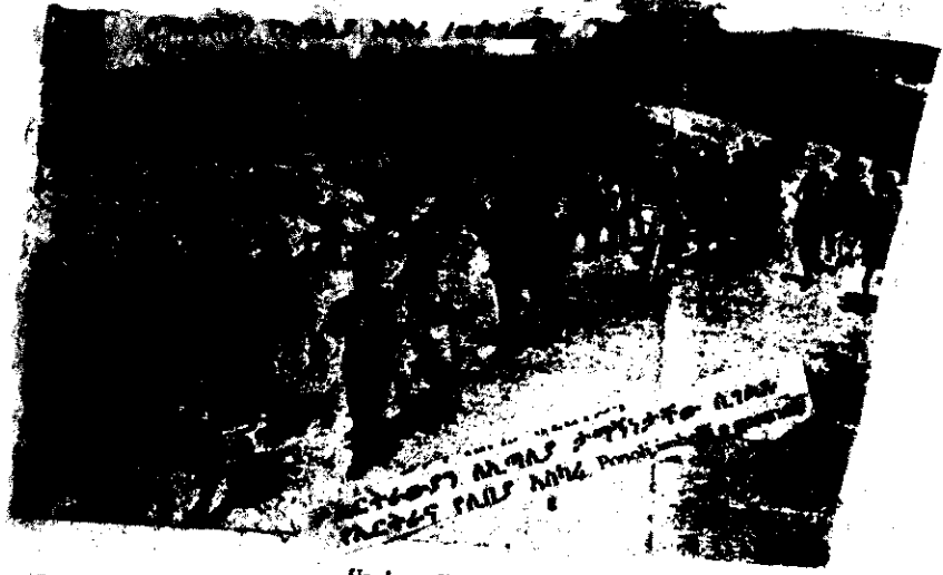
Un battaglione eritreo in marcia in Cirenaica