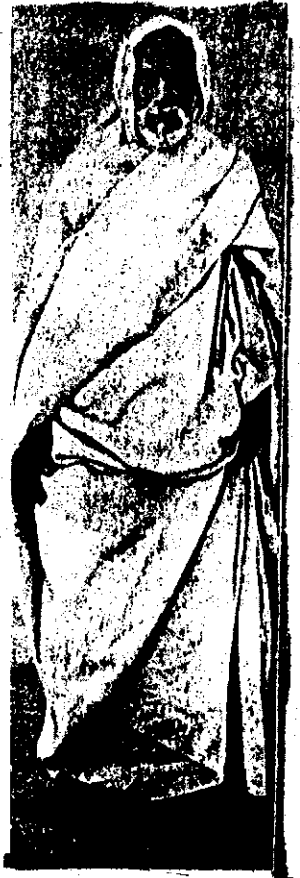
Omar el Muechtar Il leggendario capo della rivolta in Cirenaica. Aveva 69 anni quando fu imprigionato.

Nominato nel 1930 vice governatore della Cirenaica, Graziani chiede pieni poteri per eliminare la guerriglia