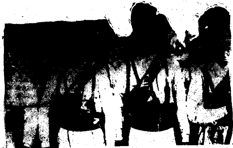
I NOSTRI FEBELI ASCARI ERITREI.

እንግሊዮችና ይሁደቱ አንድ መሆናቸውን የሚያረጋግጥ በረዥም የሁለቱ ሕዝቦች ሃይማኖቶች ተመሳሳይነት የሚያረጋግጥ ግንባርን በለው ያቀረበው ደሊዳ (Dell'Isola) የተባለው ጸሐፊ (3) ያወጣው ጽሑፍ ነው። በዲር ጊዜ እንግሊዮች ካተላከ ህዝብ ጊዜ ይሁደቱ በእንግሊዝ ህዝብ አልነበሩም። ከ1665 ዓ.ም. ጀምሮ ግን ከርምወል Cromwell እንዲገቡ ፈቀደላቸው። ከዚህ ጊዜ ጀምሮ የእንግሊዝ ሕዝብ ይሁደቱ እንዲገቡ መፍቀድ ብቻ ሳይሆን ከተመረጠውና ከተባረከው የአሰራራል ሕዝብ እንደሚወለድ የግል ታሪክ ለመፍጠሩ፤ በእውርሳውያን ብቸኛ ሕዝብ ያደርገዋል። ይሁደቱም ያላቸው ገንዘብ በሰንደን በግፍሰሰ ወረታውን ከፍሏል። ወደዚህ ለመድረስ ግን