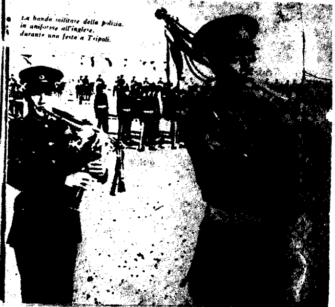
La banda militare della polizia in uniforme all'inglese durante una festa a Tripoli.

collaborazione, stima, amicizie senza rancori.