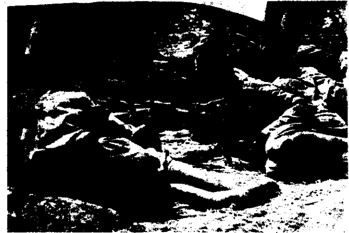
14. - Ascari Somali.