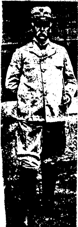
IL GOVERNATORE FIDELMARIO MARTINI