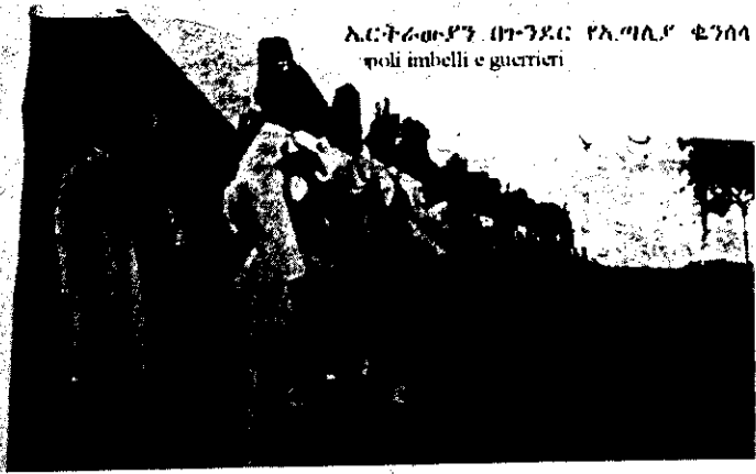
ኢርትሬውያን በጉንደር የኢጣሊያ ቁጥላ poli imbelli e guerrieri

ጦርነት በብሪታኒያና በጦር ጓዶቿ ለሸናፊነት ተፈጸመ። ከብሪታኒያ ጋር የተፋለመች ህገር ግን በአውሮጳም በሰሜን አፍሪካም ጀርመን እንጂ ኢጣሊያ አልነበረችም። ኢጣሊያ የጀርመን እንስተኛ ጭፍራ ከመሆን አልፋ ብቻም በጦርነት ከብሪታኒያ ጋር ለመውዳድር ደረጃ ደርሳ አታውቅም።