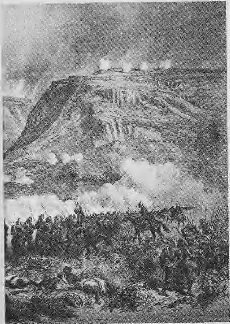
(በዚህ ምስል፣ ሁሉም ጋራዎች፣ ጳላና ስላሴ ተለይተው ይታያሉ፤ ከፋላ ጋራ የሚታየው ጭስ የአፄ ቴዎድሮስ መደሮች ሲተኮሱ ነው።)