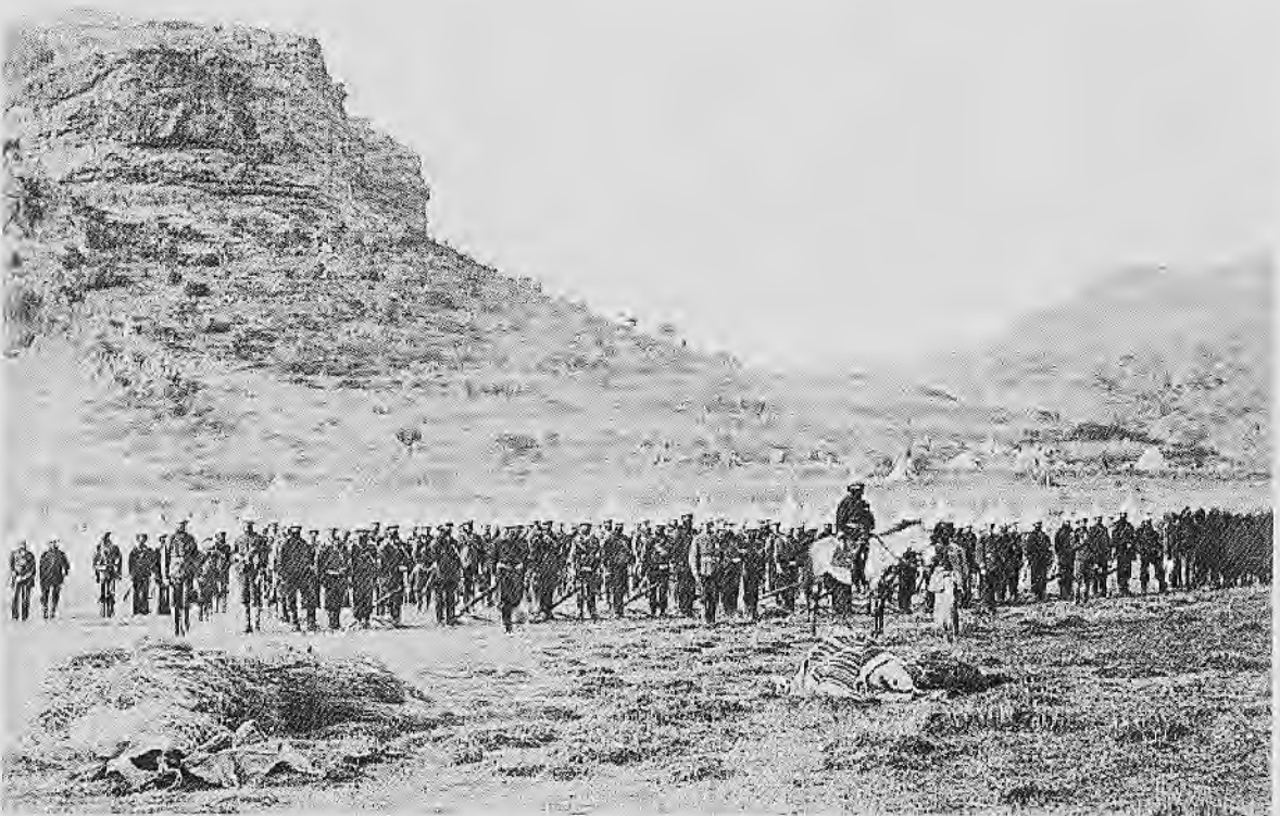
የእንግሊዞች ሮኪት ተኳሾች ብርጋድ (በአጃቸው የደዙት ትቦ የጫመሰሰ ገዢ ሮኪት መተካኛው ነው።)