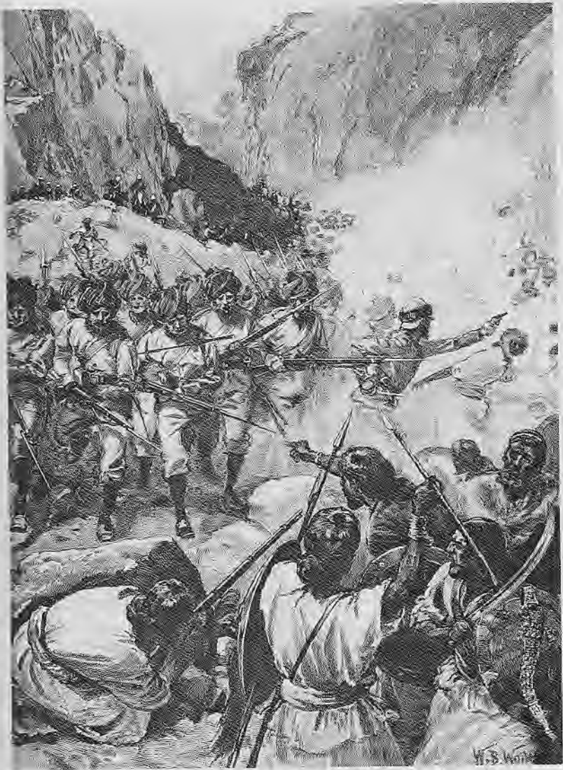
ፑንጅቦቹ ሳንጃ ወድረው አቢሲኒያውያንን ሲያጠቁ

William Barnes Wollen - the 1895 British book illustrated