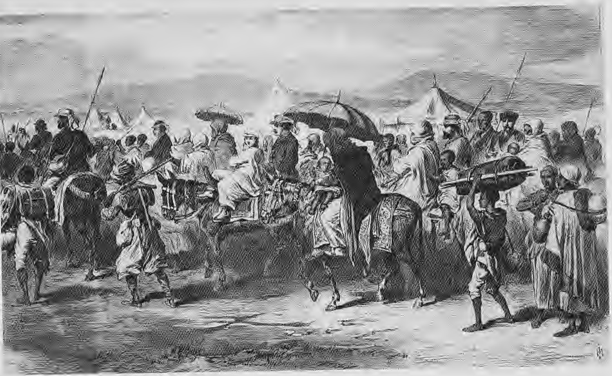
የተለቀቀች አባረኞች ከዚህ ቀደም ወይስ በኋላ ታሪክ (ገጽ 16)