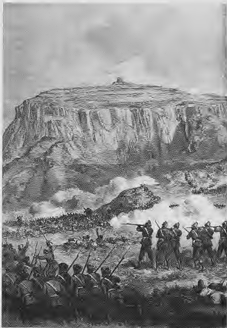
የአሮጌ ውጊያ (ዋቢ መጻሕፍት ተ.ቁ. 16)