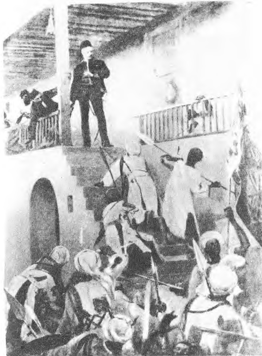
ጎርዶን ፓሻ ሲገደል (ከሰርድ ኤንድ ፋየር መጽሐፍ)