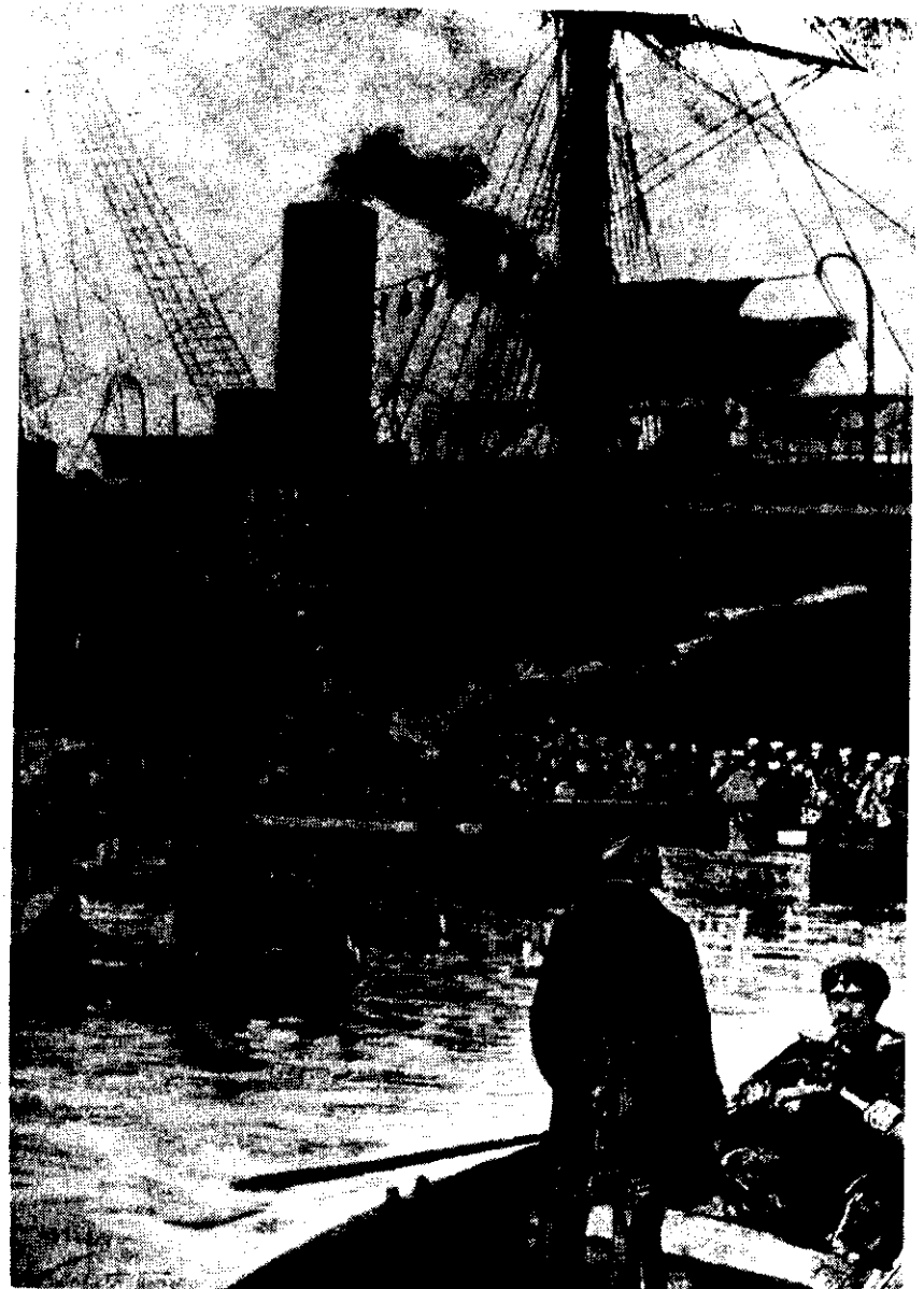
የኢጣልያ ጦር ምጥጥ ላይ ከመርከብ ሲወርድ

በየካቲት 5 ቀን ምጥጥን የያዘው የኢጣልያ ጦር እስከ ኅዳር ወር መጨረሻ ቦሮሮ ወራት ውስጥ ይዞታውን እያጠባበቀ ሲሔድ ከግብጽቹ ባለሥልጣናት ጋር እያደር ተስማማ ። በግብጽ ባለሥልጣናት ይታዘዙ ለነበሩት ለሲቪሎችም ለባሽ ቡዙቆችም ከግብጽ በኩል የሚከፈላቸው ቀለብ ስላቆመ ፣ አንዳንዶቹም ወደ አገራቸው ሲመለሱ ለቀሩት በሙሉ ቀለባቸውን እየከፈለ እንዳሉ ወደርሱ ዞረው እንዲያገለግሉት አደረገ ። በሚቀጥለውም ጊዜ በካይሮ የእንግሊዝና የኢጣልያ ባለሥልጣናት ከዲቭ ተውፊቅንና ጠቅላይ ሚኒስትሩን ነባር ፓሻን ገፋፍተውና አግባብተው ወደ ምጥጥ ትእዛዝ እንዲተላለፍ አድርገው አስተዳደሩም ፣ ጉምሩኩም ሁሉ በሙሉ ከታኅሣሥ 2 ቀን 1878 ዓ.ም. ዠምሮ በኢጣልያ መንግሥት እጅ እንዲዞር አደረጉ ። በኢጣልያ ባንዲራ ጉን ይውለበለብ የነበረውም የግብጽ ባንዲራ ወርዶ ከባለሥልጣናቹ ጋር ተጠቅልሎ አገሩ ገባ ።