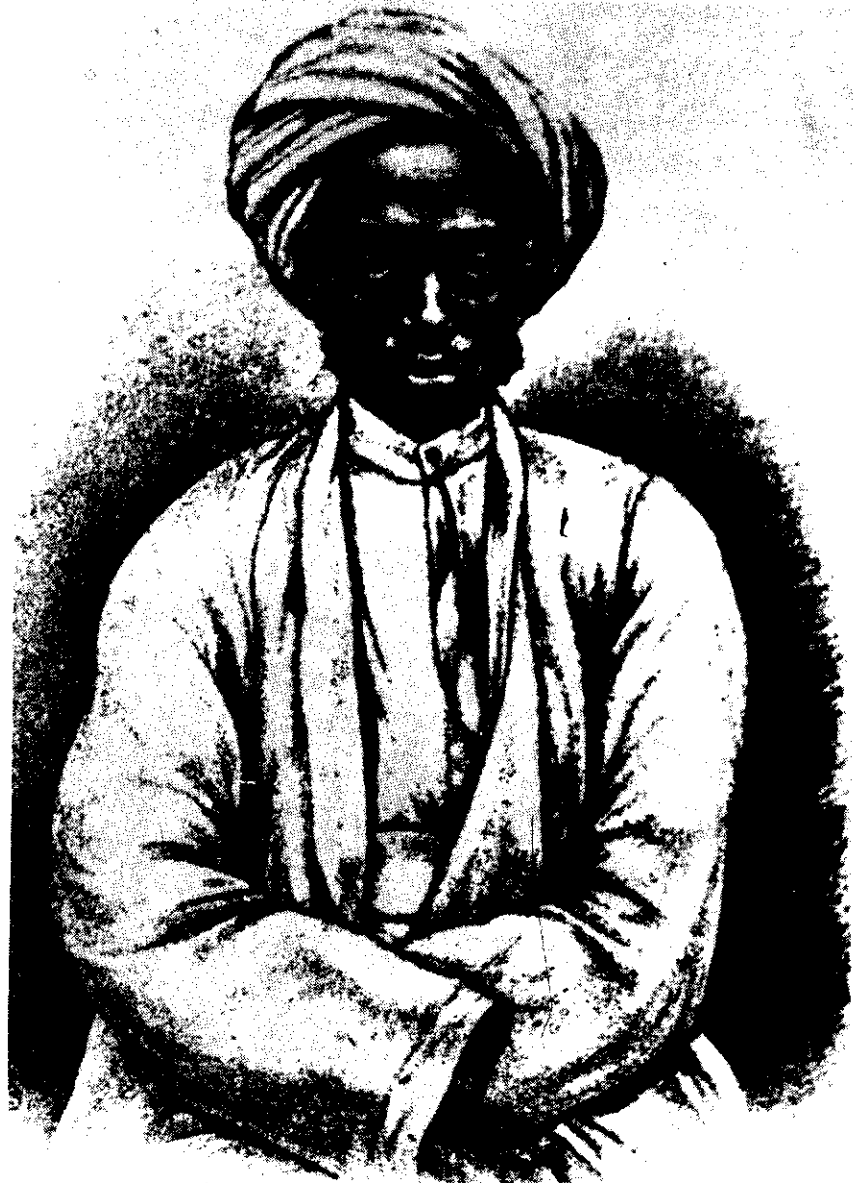
የመጨረሻው የሐረር ገዥ አሜር አብዱላሂ

ጥንት እነ ዐፄ ዓምደ ጽዮን፣ እነ ዐፄ ዘርዓ ያዕቆብ የነበሩበት፣ በግራኝ ወረራ ዋዜማ እነ አባ ገብረ እንድርያስ፣ እነ ራስ ደገልሃን፣ እነ ራስ ወሰን ሰገድ፣ ከግራኝ ወረራ ፍጻሜ በኋላ እነ አዝማች ፋኑ ኤል፣ እነ አቤቶ ሐመልማል የተጋደሉበት ሐረርጌ አሁን በመጨረሻ ዐፄ ምኒልክ ከያዙት ወዲህ ራስ መኩንን ከመኳንንቶቻቸው ጋር ከሸዋውና ከቤጌምድኝ፣ ከጉጃሚውና ከትግሬው፣ ከአሮሞውና ከጉራጌው ተወላጅ ጋር ለዚህ ምድር የአዕምሮና የጉልበት ኃይላቸውን አፍሰውበታል። የነዚህ የቀደምቱ የትክለኞቹ ተወላጆች ዛሬ በሕይወት የሚገኙት አገራ ሸዋ ነው፣ ቤጌምድር ጉጃም፣ ትግሬይ ነው በማለት ፈንታ የሐረር ተወላጅ ነን ይላሉ። ከሀገሬው ተወላጅ ከአደሬው፣ ከሱማሌው፣ ከአሮሞውና ከአሳው፣ ከአዳሉ ጋር ዘራቸውንና ልማዳቸውን ደባልቀው ይኖሩበታል።