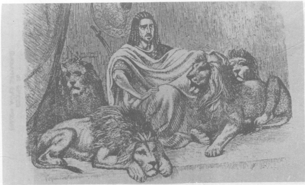
ዐጌ ቴዎድሮስ (ከሪፑብሊክ ፓንክሪስት መጽሐፍ)