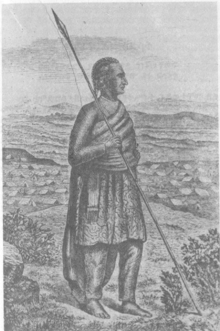
ዐጊ ቲዎድሮስ (ከወልደግዮር ቲዎሬል ማጽሐፍ)