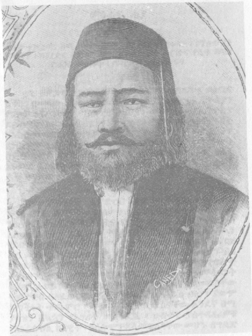
ՈՅԷ ՄԴ (ԻԼՈՂ ՊԻՏՆ ՍՔԻԿ)