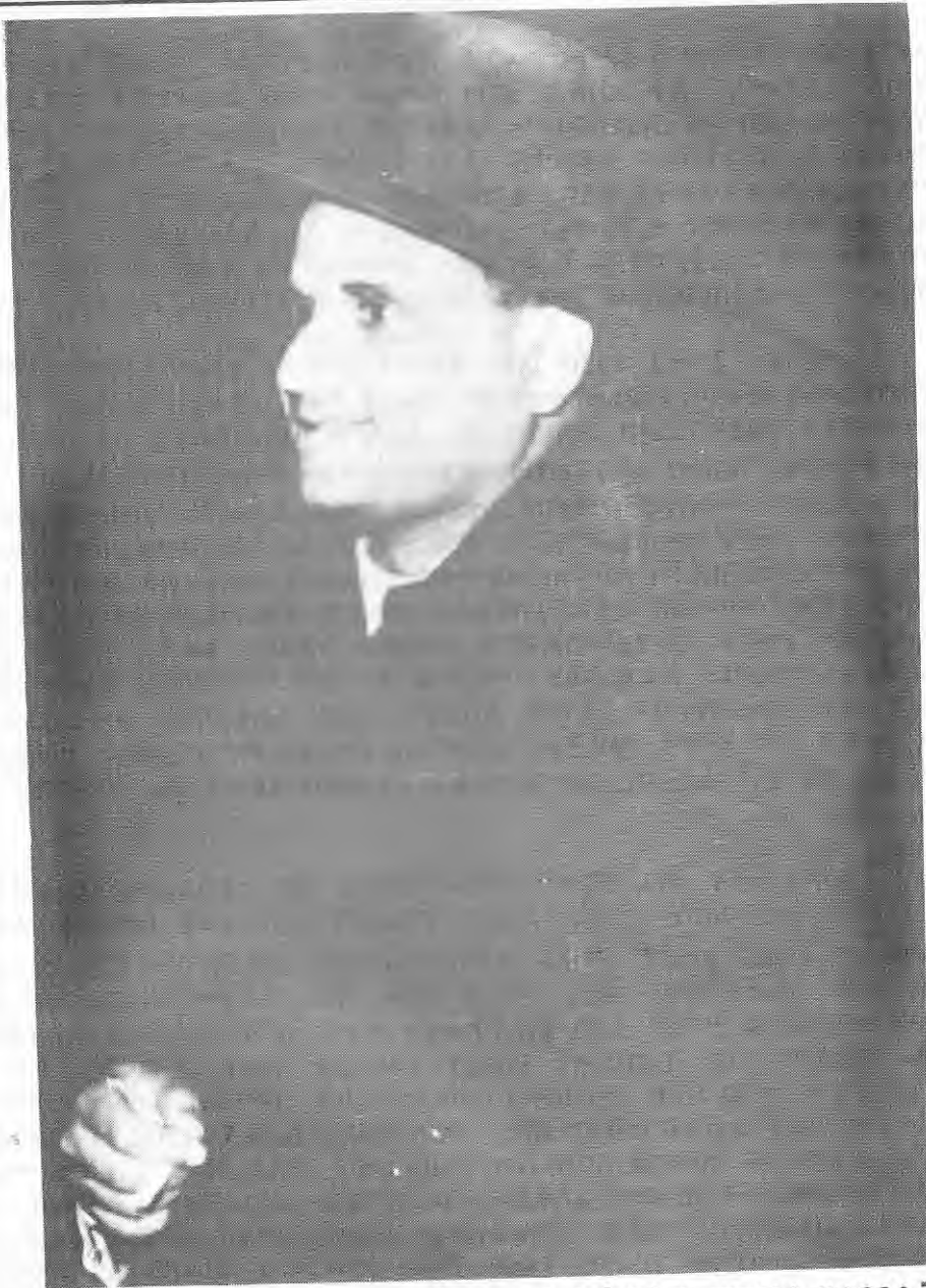
ታህሣሥ 2 ቀን 1950 ዓ.ም የኤርትራን ወደ ኢትዮጵያ መመለስ የተባበሩት መንግሥታት ሲወሰን፣ ለአክሊሉ ሀብተወልድ የመጨረሻ እጅይታ ነበር።