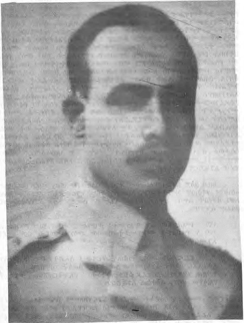
ኮሎኔል ነጋ ኃይለሥላሴ (ጳላ ሊዩትናንት ገሮኔራል) በአሥመራ የንጉሠ ነገሥቱ ላይዘን አፊሰር፤