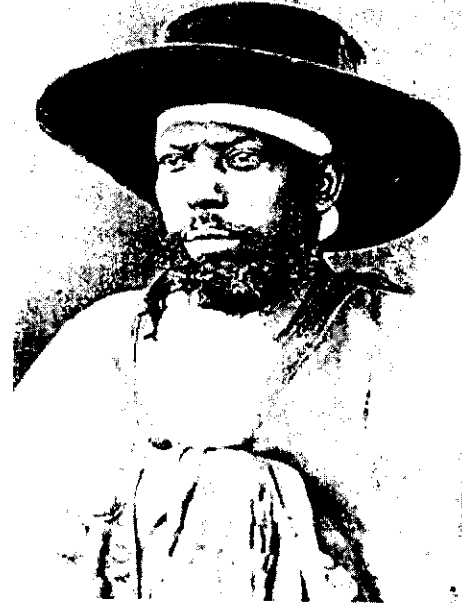
ዳግማዊ አፄ ምኒልክ

አፄ ምኒልክ ወደ ሥልጣን በወጡበት ወቅት ባገር ውስጥ ካፄ ቴዎድሮስና ካፄ ዮሐንስ ጋር ሲነፃፀር ሰላም ነበር ማለት ይቻላል። ይህ ማለት ግን ግዛትን ለማስፋፋት ሲሉ በምሥራቅ፣ በደቡብና በምዕራብ ኢትዮጵያ የሰበሰቡ ፍልሚያ አላካሄዱም ማለት አይደለም። ኃይለኛ የሥልጣን ተፎካካሪ አልገጠማቸውም ለማለት እንጅ።