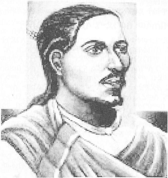
አዲስ የሐንሰ 4ኛ