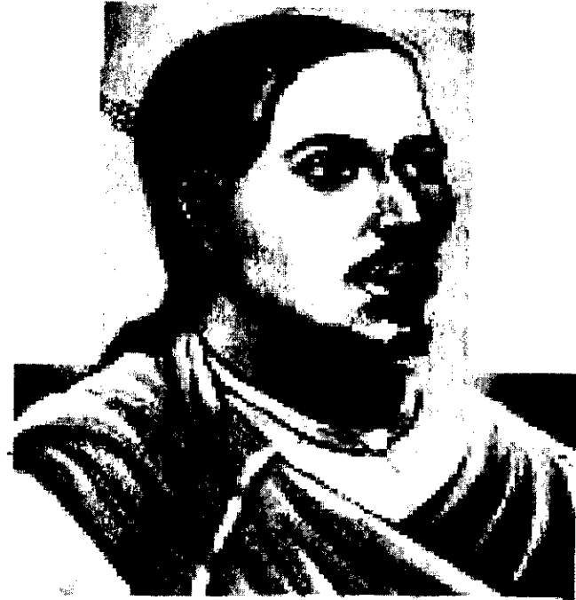
አፄ ዮሐንስ 4ኛ

በዝብዝ ካሣ (በዝብዝ የፈረሃቸው ስም ነው) እንደዚያን ዘመን ወጣቶችና ጎልማሶች ከትውልድ ቀያቸው (ከተምቤን) ወደ ጎንደር በመሄድ ያፄ ቴዎድሮስ ጭፍራ (ወታደር) ሆኑ። ቴዎድሮስ ለወታደሮቻቸውና ለመኳንንቶቻቸው ማዕረግና ሹመት ሲሰጡ ለካሣም የባላምባራስነት ማዕረግ ሰጥተዋቸው ነበር። ካሣ ምርጫ ግን በዚህ ማዕረግ ባለመርካታቸው አኩርፈው በመከዳት ወደ ተምቤን ተመለሱ።