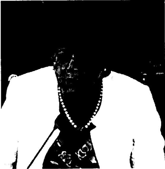
ያውሮፓ ኅብረትን ወክለው የታዛቢዎች ሰብሳቢ የነበሩት ወ/ሮ እና ኅሚዝ

ያ ወቅት ደግሞ ኢሕአዴግ በቅንጅት የተሸነፈበት ወቅት ስለነበር <ድምፃችን ይከበር> ባሉ ወጣቶች ላይ በወሰደው አሸማቃቂ የግድያ ርምጃ በዓለም ዙሪያ ውግዘትና ጩኸት የበዛበት በመሆኑ አይከፍሉ መሥዋእትነት ከፍሎ ወይንም አሜሪካ የጠየቀችውን ባውንታ ተቀብሎ ያንን ኢሥፊሪ ጊዜ ከሷ ሥር ተሸጉ ማለፍ ነበረበት። በመሆኑም ሁለቱ ተፈላላጊዎች ጊዜ አገናኝቻቸውና ባሜሪካ ያፍሪካ ጉዳይ ኃላፊዎ በጄንዳይ ፍሬዘር በኩል በሚሰጡ አለቀ። ከዚህ በኋላ አሜሪካ የቅንጅትን ጉዳይ ቀዝቃዛ ውሃ ቸለሰችበት። አንዲት ነገር ሣትተነፍስ <ውሾን ያነሳ ውሾ> ብላ ጭጭ እንዳለች ቀረች።