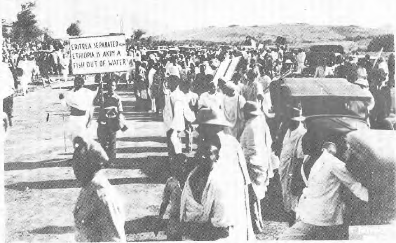
የኤርትራና የኢትዮጵያ አንድነት ማህበር አባሎች ለመርማሪው ኮሚሽን ስሜታቸውን ሲገልጹ። (ጎዳር 1947)