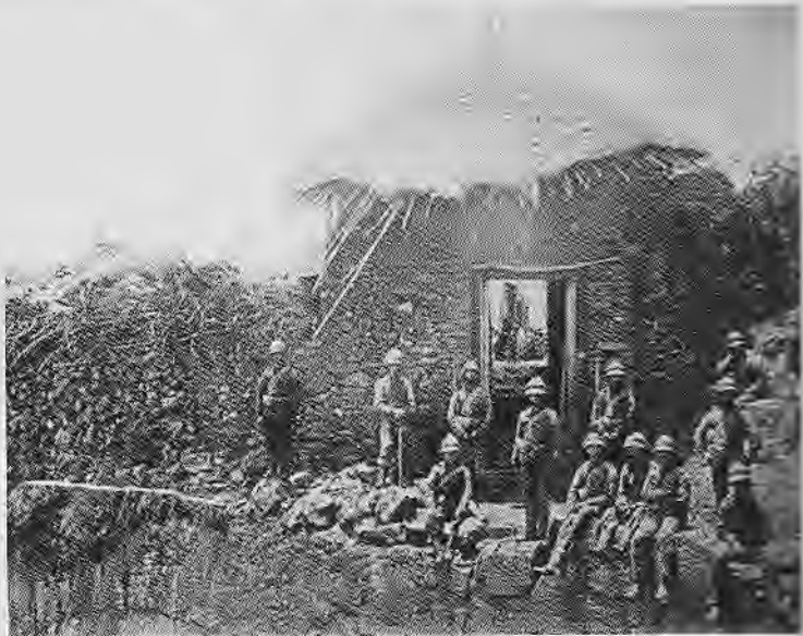
ኮኪት በር በአንግሊዝ ወታደሮች ሲጠበቅ

(ወደ መቅደላ መግቢያ በር፣ በፅሁፉ የተገለፀው የምሽግ መግቢያው የድንጋይ ካፕሬን ስራው የአንጠት መሰናክል በዚህ ፎቶግራፍ ተለይቶ ይታያል።)