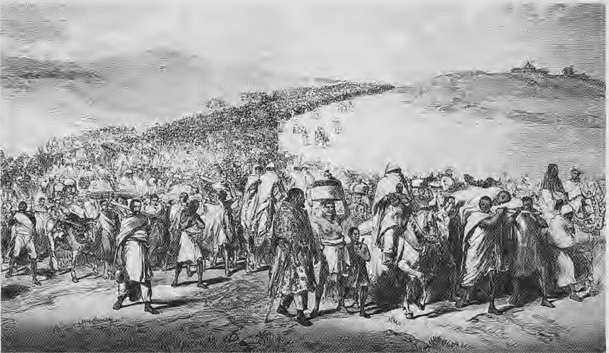
ՐԱՅ ԿՔԵՐԸՆ ՓԸ ԱՆՔԻ ԻՍՓՅԵՆ ԱՄՈՂ (Roger Acton)