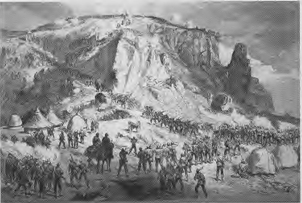
ԲԱՅՅՈՒՆԻ ՄԵՆ ժողովուրդի Բնակավայրերի Ժամանակ (Roger Acton)