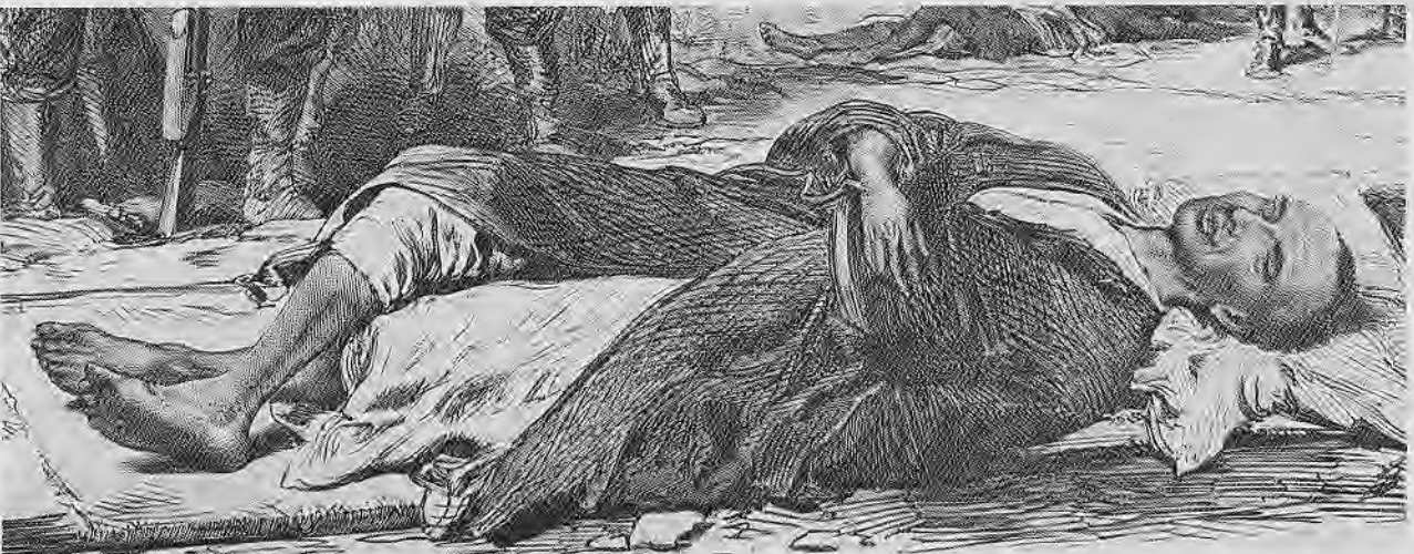
ԲԻԺ ԷԺԸՆԻ ԳՂՈՋ