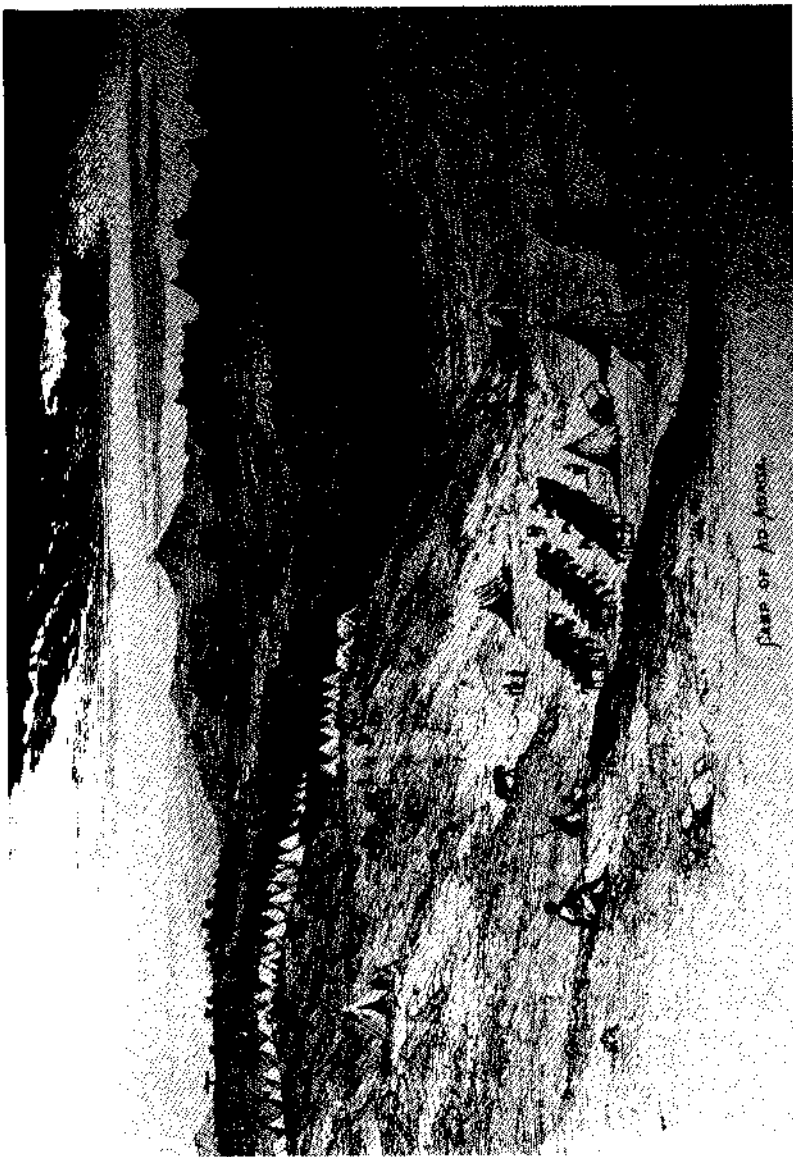
የእንግሊዞች ካምፕ በአድ አባጋ (ዋቢ መፅሐፍ ተ.ቁ. 16)

ራቅ ብሎ፣ ሜዳማ ቦታው፣ የቁልቁል ተከሎች አልፎ አልፎ አንደ ነጠብጣብ እየታዩበት የወይን ጠጅ ቀለም ባለው መልኩ ተንጣሎ ይታያል። ተራራማው ደብር ደምባ በጫፎቹ ጠቆር ያሉ ደመናዎችን በሰቶ ይታያል፤ ከሜዳዎቹ፣ ከጎድጓዳ ሰፍራዎችና አነስ ካሉ ኮረብታዎች በላይ የተለያዩ በድፍረት የቆሙ አምባዎች በተለያየ አቅጣጫ ይታያሉ።