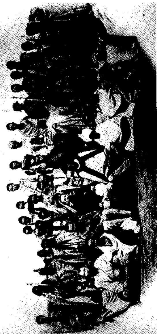
የደጃዝማች ካሳ መልከተኛና ተከታዮች (Record of the Expedition to Abyssinia)

በሚቀጥለው ቀን ስር ሮበርት ናፒየር ከሚመቸው የአድ አባጋ ሸለቆ ካምፔ፣ 500 አግረኛ፣ 300 ፈረሰኛ፣ የተወሰኑ የሮያል ኢንጂነርስ ሰዎች እና አራት 12-ፓውንደር የሚባሉ መድፎች አሰልፎ ወጣ። በጣም የተደራጀ እነሱተኛ ጦር፣ ነገር ግን በማሾፍም አይነት የትግሬው መሰፍን ከጠበቀው የአንግሊዝ ጦር መጠን ያነሰ ወይም የተለየ ነበር።