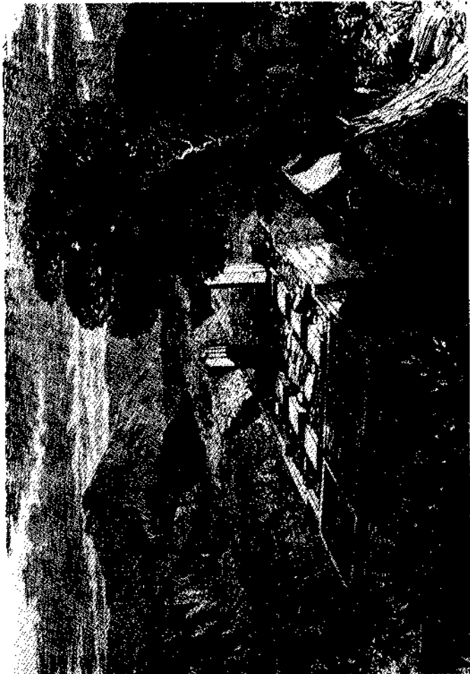
የግሪክ ቤተ መቅደስ ፍርስራሽ በአጉላ፤ የሰታንሊ ድንኳን

ከአጉላ ወንዝ ወደ አንጣሎ ያደረግነው ጉዞ ምንም የሚያስደስት አልነበረም። በመጀመሪያው ቀን ማምሻውኑ ከአጉላ 19 ማይሎች ርቀት ቦታ የሚገኝ ዶራሎ የሚባል ቦታ ደረሰን፤ በሁለተኛው ቀን፤ 9 ማይሎች ርቀት ላይ እህኩሳት ደረሰን፤ በሶስተኛው ቀን ከ14 ማይሎች ጉዞ በኋላ አንጣሎ ገባን።