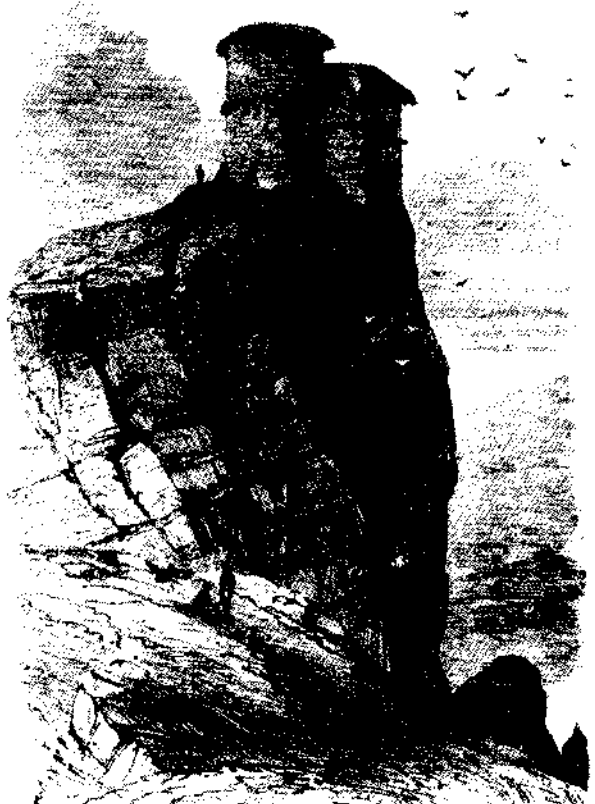
በማይ የሂዝና በአዳ አባጋ መካከል የሚገኝ ግምብ ቤት

አሁንም አሁንም፣ ሰየት ያለ ሳቅ ይሰማል፤ የእንግሊዝ ሰዎች አይነት ነው፤ በጣም ጎርጎን ያለ በመሆኑ፣ ከሩቅ ሲሰማ ስውነቱ ግዙፍ ከሆነ ሰው የሚመጣ የማይቋርጥ ሳቅ ይመስላል። ቀይ ዩኔፎርም የለበሱ ወታደሮችና