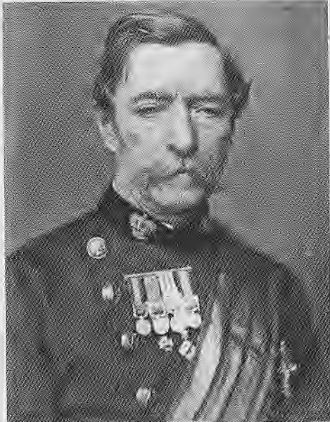
ሌፍተናንት ጄኔራል ሮበርት ናፒየር የአቤሲኒያው ጦር ጠቅላይ አዛዥ by John Watkins (1860s)

በዚህ ጉዳይ ላይ፣ ካሳም የግድ ሀሳቡን መቀበል ነበረበት። የእንግሊዞችን እርዳታ እሱ ማግኘት ካልቻለ፣ ሌላ ራስ ወይም ሥልጣን ፈላጊ ስለማይገኝ በዚህ ረከቷል።