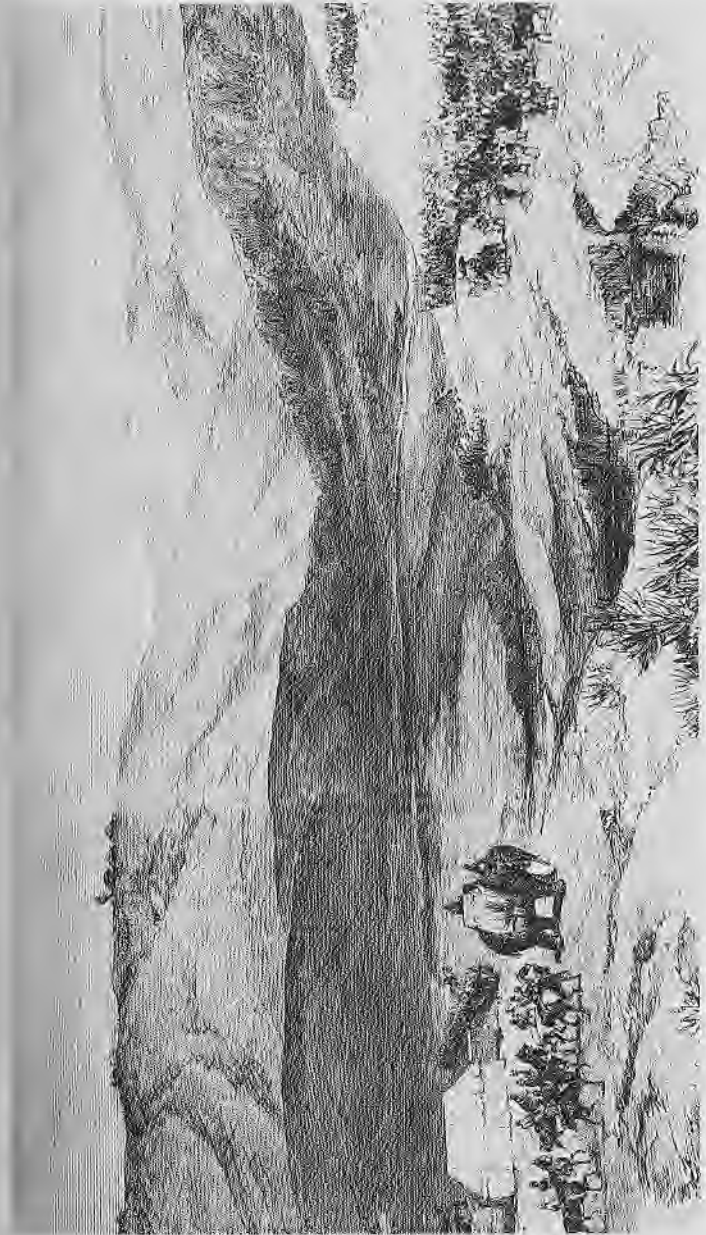
የደጃች ካሳና የሮብርት ናፒየር ግንኙነት (ዋቢ መጻሕፍ ተቁ. 16)

ጄኔራሉ ከድንኳኑ ሲወጣ፣ የአመት በአል ሪባኖች አልባሳት የተደረገባት ትልቅ ዝሆን በበሩ በኩል ቆሞ ነበር። ጄኔራሉም ዝሆኑ ላይ ተሳፈረ። በዚህ ዝሆንና ሌላም በማከተል፣ በረዳቶቹም ተከቦና በፈረሰኞች ታጅቦ፣ ጄኔራል ናፒየር ወደ ወራጅ ውሃው አመራ።