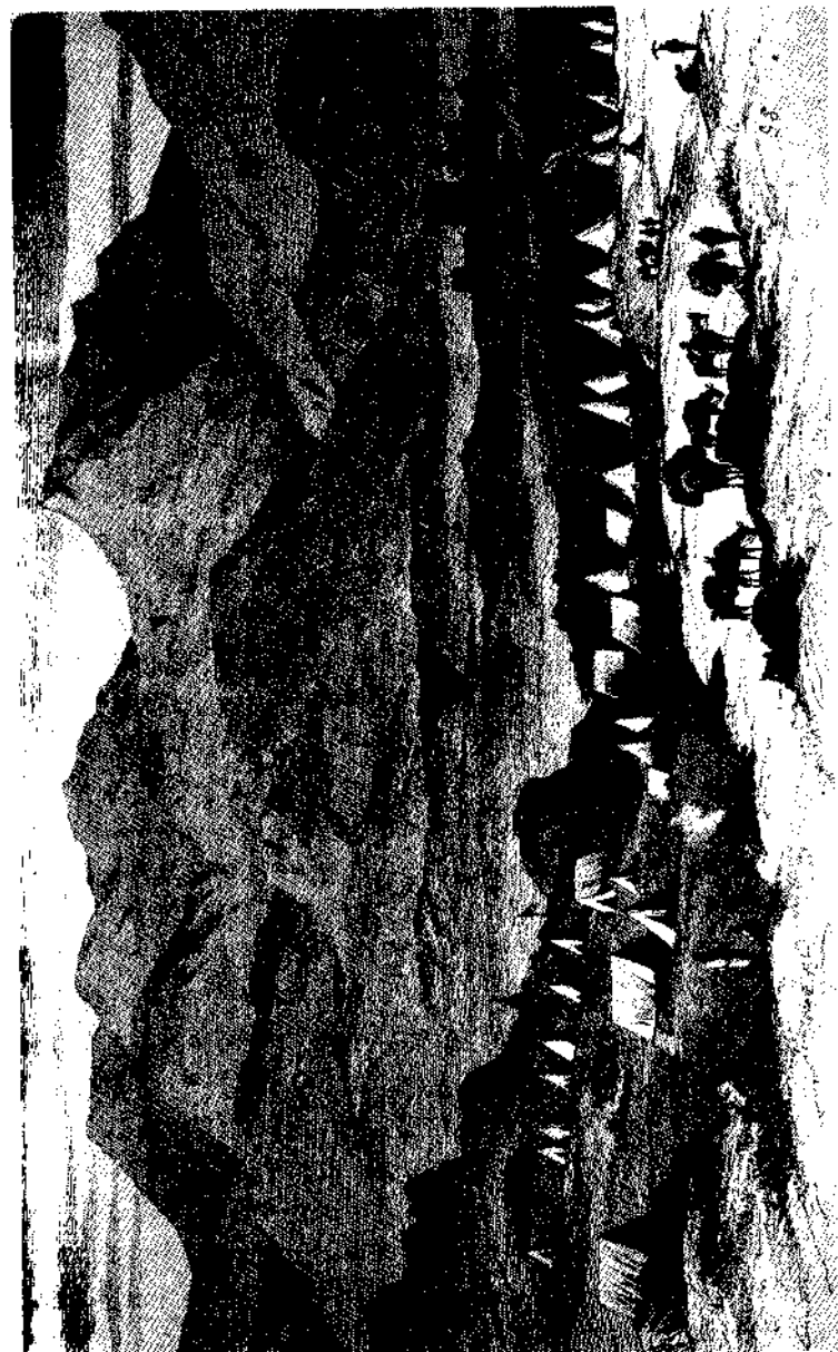
የእንግሊዞች ካምፕ በአዲግራት (ዋቢ መፅሐፍ ተቁ. 16)

ያን ቀን ባደረግነው ጉዞ አንደዛ አይነት ቀማኞችም አላጋጠመንም፤ ተጉዘንም፣ ከትልቅ ግዙፍ ከሆነ አለት ስር ባለ፣ ቅጠል የበዛበት መሹዋለኪያ ቦታ ደረሰን፤ ይህም ቀጥለን ለምናደርገው ጉዞ መተላለፊያ ነበር። በዚህ ቦታ