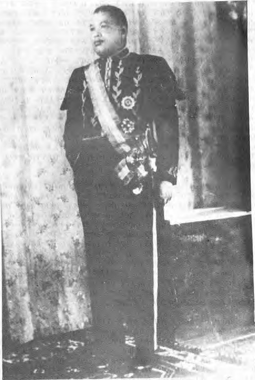
ፊታውራሪ አስፍሐ ወልደሚካኤል (ኋላ ደጃዝማች፣ ቢትወደድ)