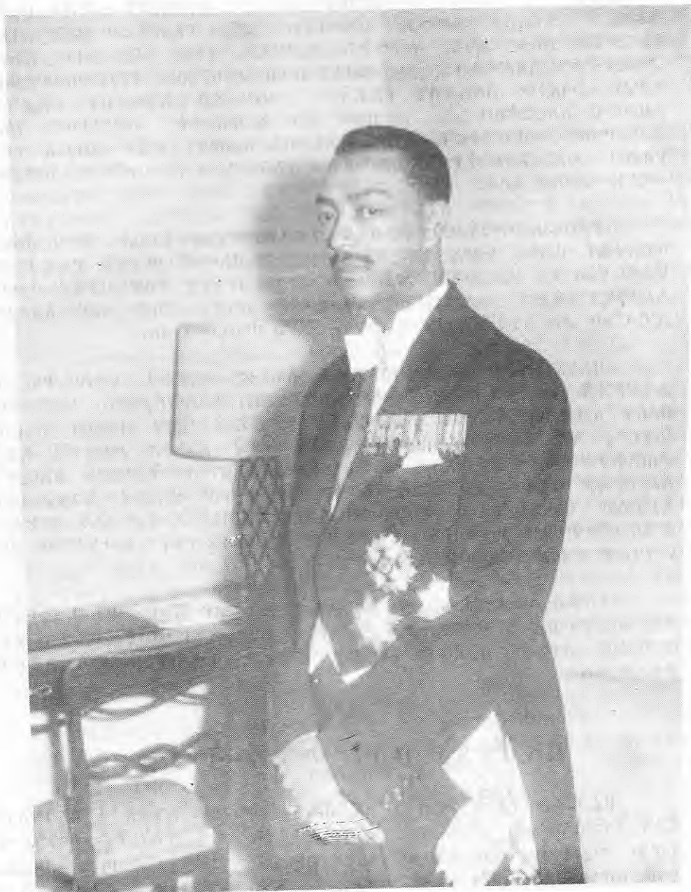
ሌፍትናንት ገፍኔራል ዐቢይ አበበ፡

በኢርትራ የግርማዊነታቸው እንደራሴ፡ (በፌ.ዲ.ሪ.ሸኑ ዘመን፡ 1960 - 1962) የኢርትራ ጠቅላይ ግዛት እንደራሴ፡ (ከፌ.ዲ.ሪ.ሸኑ በኋላ፡ 1963 - 1964)