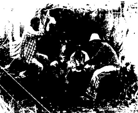
በጉምላክ የዘመቻ ጣቢያ

ቀስ በቀስ፣ በተለይም ደግሞ ወደ ምግብ እና መጠጥ ቦታዎች መሄድ ካቆምኩኝ በኋላ፣ ሁለታችን አንዳች ዓይነት ያልተለመደ ግንኙነትን ማዳበር ጀመርን። አንድ ላይ ሆነን የቀኑን ሞቃትና ወበቃማ አየር ንብረት ከሚያመጡት ውጤት ለማገገም ስንል ቀዝቃዛውን የጉምላክን አየር በምሽት የምናጣጥምበትን የረጅም ርቀት የአግር ጉዞዎችን እናደርግ ጀመርን። እርሱም ቀስ በቀስ ልቡን እየከፈተ በእግዚአብሔር ስላለው አምነት እና ያ ደግሞ እንዴት የእርሱን ሕይወት እንደሚመራው አሜውተኝ። መጽሐፍ ቅዱስን እንደሚያነብብ እና ሕይወቱን የሚመራበትን መርጭዎች ከዚያ መጽሐፍ እንደሚያወጣ ሲነግረኝ፣ ስለ መጽሐፍ ቅዱስም ሆነ ስለ ክርስትና አምነት መስማቱ ለእኔ ያልተለመደ ነገር ነበር። አማኝ ሆኖ ምሁር የመሆኑም ነገር እንዲሁ ለእኔ ያልተለመደ ነገር በመሆኑ፣ ስለ ሃይማኖት ጉዳዮች በሰፊው መሐይም ሆኜ ራሴን አገኘሁት።