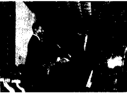
ከኮ/ል መንግሥቱ እጅ የመጀመሪያ ዲግሪዬን ሰቀበል

የማዕረግ ልብስ ተሰጥቶኝ ቀምሳጥን ውስጥ እንዳሰቀመጥኩት ትኩረት ሳልሰጠው ቀርቼ ተረሳ። ለምረቃ ከብረ-በዓሉ አርፍጄ አሰከነቃ ድረስ ከምርቃት ቀኔ በፊት ባለው የዋዜማ ሌሊት በጣም አሰከሰከር ጠጥቼ ነበር። በዚያ ዕለት ከአንቅልፌ እንደ ነቃሁ ከራሰ ምታት ሕመም ጋር ሆኜ ከብረ-በዓሉ ወደሚደረግበት የራሰ