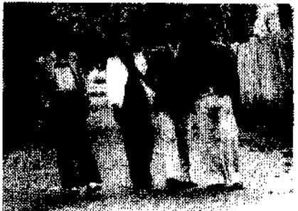
የጆሊት መከራ ግራ ሲጋባ

ከቅርብ ጊዜ የፖለቲካ ተሞክሮው የዝነ ታሪኩን ካካፈለኝ በኋላ፣ በአዲስ የማርክሲስት እና ሌኒኒስት ድርጅት ውስጥ ይሳተፍ አንደ ነበረ ምንም ሳይደብቅ ነገረኝ። ከዚያም ለጥቆ፣ አብዮታዊ ትግሉን ለመቀጠል ምርጥ የሆነው መንገድ ማሌሪያ 39 ተብሎ የሚጠራውን ተራማጅ ድርጅት መቀላቀል አንደ ሆነ አጽንዖት ሰጥቶበት ነገረኝ። ስለ ድርጅቱ ብዙም ባላውቅም፣ ከወታደራዊው መንግሥት ጋር የሚሠሩ በተለያዩ የፖለቲካ ቡድኖች የተቋቋሙ በርካታ የፖለቲካ ድርጅቶች በመኖራቸው፣ በመንግሥት ምሪት ሥር የሚንቀሳቀስ ማርክሲስት ቡድን አንደ ሆነ ገመትኩ። 40 ከእነርሱ