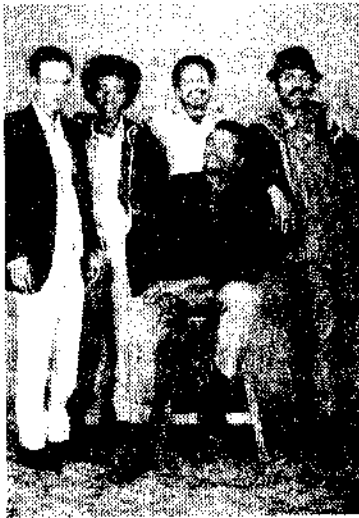
እና ጓደኞቼ በአብዮቱ ዘመን

ይጽፍ ነበር። ሁለተኛው ሳምንት ላይ የተሳካ የሥነ-ልቦና በሽታዬ የታከመበት ሁኔታ ውስጥ አንዳለፍኩ እና የተለመደውን መደበኛ ሕይወቴን መቀጠል እንደምችል በሚገልጽ ወረቀት ከሆስፒታል ተለቀቅኩ። ያን ጊዜ ከመንግሥት ማሰገደጃዎች ነጻነት ማግኘት ብለን የምንጠራውን ነገር ለመጨበጥ ስል ያንን ሠነድ ለመጠቀም ፈለግሁና የሚያመጣው አደጋ ቢገባኝም፣ አንደ ሰብብ ልጠቀምበት እንደማያስፈልገኝ ሆኜ በምትኩ ላልተወሰነ ጊዜ አዲስ አበባ ልቆይ ወሰንኩ።