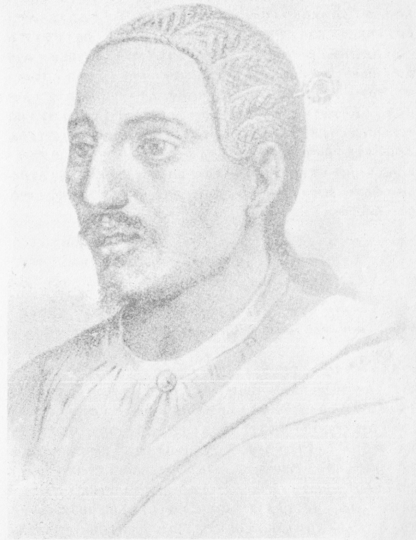
— ዐፄ ፡ ዮሐንስ —