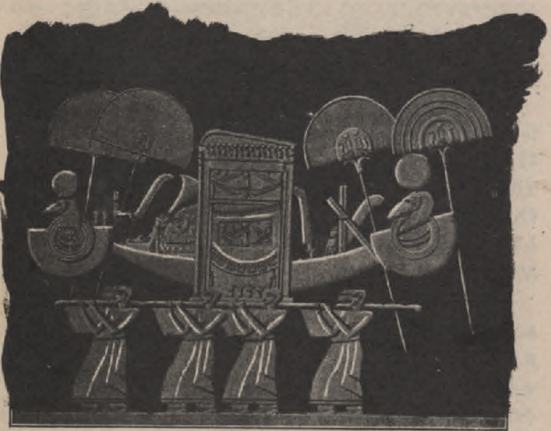
የአሞን : በዓል : በሚውልበት : ቀን : ቀላውስት : ምስሉ : ያለበትን : ታንኳ : ተሸክመው : ሲዞሩ = ( ደስከሪፕሊየን ደ : ሌጂፕት = )