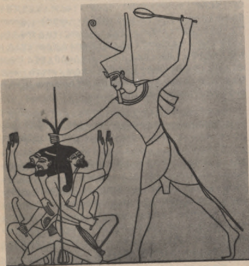
ዳግማዊ : ራምሴስ : የሥርዖን : ምርኮኞች : እየመታ : ሲሠዋ ። ( ገሮ ገሮ ፡ ከሌር ። )

ይኸን፡ጽሑፍ፡ከጥንቱ፡ፊደል፡(ሂዮሮግሊፍ)፡ላይ፡የገለበጡትና፡የተረጎሙት፡በግብፅ፡አገር፡በታሪካዊ፡የከተማ፡ፍራሾች፡በሉክሶርና፡በካርናቅ፡ብዙ፡ዘመን፡በጥናት፡የኖሩት፡ሙሴ፡አጉሱት፡