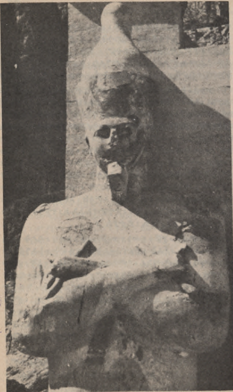
ሐታሱ፡ (ሐትስ፡ ሐፕሱዊት፡) ሻምዱር ።

ቤተ፡ መቅደስ፡ አገልግሎት፡ የሚውል፡ ዕጣን፡ ከርቤ፡ ሽቱ፡ ሌላም፡ የከበረ፡ ነገር፡ እንዲያመጡላት፡ ጦር፡ አዘጋጀች ። አዘጋጅታ፡ ከጨረሰች፡ በኋላ፡ እንደደንቡ፡ በሊቀ፡ካህኑ፡ አማካይነት፡ ዘመቻው፡ የሚቀናት፡ መሆኑን፡ አምላኳን፡ ብትጠይቀው፡ የተሰጣት፡ መልስ፡ ፑንትን፡ ሰጥቼሻለሁ፡ እስከዛሬ፡ እስከ፡ አማልክት፡ አገሮች፡ ድረስ፡ ያለውን፡ መንገዱን፡ ማንም፡ የማያውቀውን፡ ማንም፡ እስከ፡ ዛሬ፡ ወደ፡ ዕጣኑ፡ አገር፡ የደረሰ፡ የለም። የቀድሞ፡ ሰዎች፡ በወሬ፡ ያወሩት፡ ከመሰማቱ፡ በቀር፡ ከግብፃውያን፡ ማንም፡ አልሔደበትም፡ የሚል፡ ሆነ ።