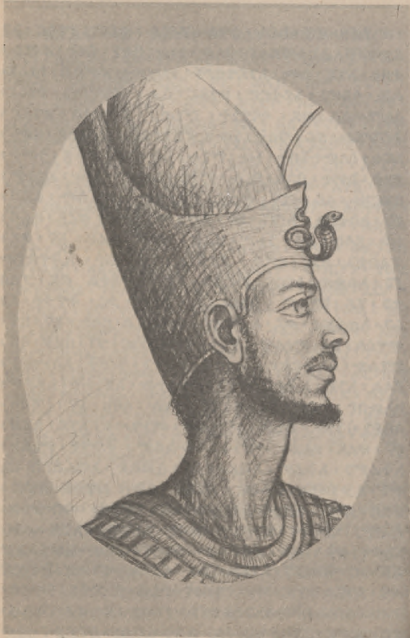
ድል ፡ አድራጊው ፡ ኢትዮጵያዊ ፡ ፒያንኪ ፡ ሚሪያሚን ፡ ሥዕሉ ፡ በዘመኑ ፡ አለ ባበሰና ፡ አቅዋም ፡ በገነኛው ፡ ሠዓሊ ፡ አፈ ፡ ወርቅ ፡ ተክሌ ፡ እጅ ፡ የተሳለ ።

እነዚህ ፡ ሁሉ ፡ ነገሥታት ፡ መቀመጫቸውን ፡ በናፓታ ፡ በርታ ፡ ያሉት ፡ በላዕላይ ፡ ግብፅ ፡ በቴብ ፡ አድርገው ፡ ከግብፆቹ ፡ እየተዋ ጉም ፡ እየታረቁም ፡ እየተጋቡም ፡ እምነታቸውንም ፡ እንደግብፃው ያኑ ፡ በአሞንና ፡ በሌሎች ፡ የጣዖት ፡ አማልክት ፡ አድርገው ፡ እንዲ ያውም ፡ አማኝ ፡ ከመሆን ፡ አልፈው ፡ ራሳቸው ፡ ሚስቶችና ፡ እገቶ ቻቸው ፡ ጭምር ፡ የጣዖታቱ ፡ የነአሞን ፡ ቤተ ፡ መቅደስ ፡ የቀሳው ስት ፡ አለቃ ፡ እየሆኑ ፡ ስለሚያገለግሉ ፡ የታሪኩ ፡ መጽሐፍ ፡ ሁሉ ፡ ቀሳውስቱ ፡ ነገሥታት ፡ እያለ ፡ ይጠራቸዋል ። የሆነ ፡ ሆኖ ፡ እነ ዚህ ፡ ነገሥታት ፡ የመንፈሳዊና ፡ የሥጋዊ ፡ ሥራ ፡ ደርበው ፡ በመ ሥራትና ፡ እያደር ፡ በመግነን ፡ የግብፅን ፡ ግዛት ፡ ከአገራቸው ፡ ከና ፓታ ፡ ከነቀሉ ፡ ወዲህ ፡ እንደ ፡ እንደ ፡ ጊዜም ፡ የላዕላይ ፡ ግብፅን ፡ እየወረሩ ፡ ሲያስቸግሩ ፡ ቆይተው ፡ እነሆ ፡ አሁን ፡ የሴራህ ፡ ፪ኛ ፡ ልጁ ፡ ፒያንኪ ፡ ፪ኛ ፡ የሚባለው ፡ ፈጽሞ ፡ ላዕላይና ፡ ታሕታይ ፡ ግብፅን ፡ ወርሮ ፡ እንደገዛትና ፡ የኑብያ ፡ ኢትዮጵያውያንን ፡ ለጽጌ ኛው ፡ ሥርወ ፡ መንግሥት ፡ (ዲናስቲ) ፡ ለዋና ፡ ፈርዖንነት ፡ እንዳ በቃቸው ፡ በሚቀጥለው ፡ ምዕራፍ ፡ ከደንበኛ ፡ የሐውልት ፡ ታሪኩ ፡ ተተርጉሞ ፡ ከወጣው ፡ ላይ ፡ አሁን ፡ ወደአማርኛ ፡ የተረጎሙሁ ትን ፡ እንመለከታለን ።