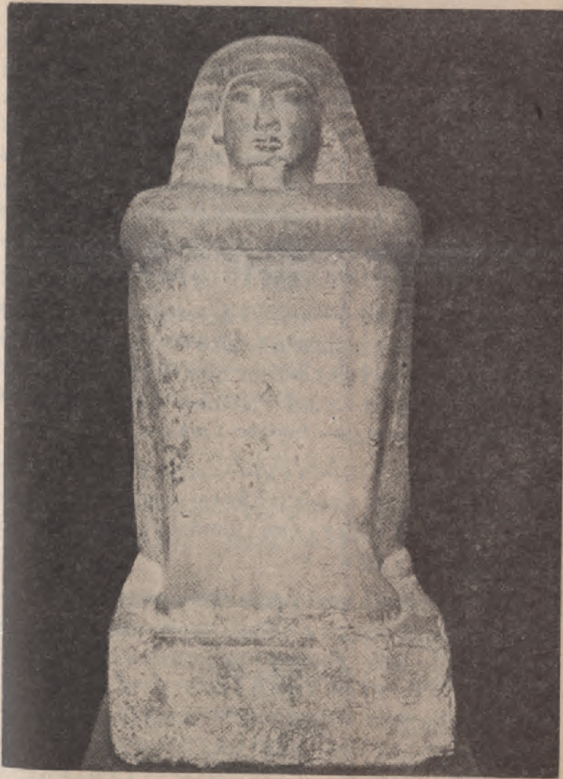
ሮሚ—ሮይ ፡ የሚባለው ፡ ትልቁ ፡ የአምን ፡ ሊቀ ፡ ካህን ፡ ( ሐውልቱ ፡ በካይሮ ፡ መዘውም ፡ ጉስታቭ ፡ ለፌቫር ። )

በዚህ ፡ ላይ ፡ ላስታውስ ፡ የምፈልገው ፡ ብሉይ ፡ ኪዳን ፡ የግ ብፅን ፡ ነገሥታት ፡ ሁሉንም ፡ ፈርዖን ፡ እያለ ፡ ከመጥራት ፡ በቀር ፡ የየግል ፡ ስማቸውን ፡ አይለይም ። ግብፆቹ ፡ በጥንት ፡ ዘመን ፡ ንጉ ሣቸውን ፡ «ፓር-አእ ፡ (ወይም) ፡ ፓራ-ኡኡ ፡ ይሉት ፡ ነበር ፡ ትር