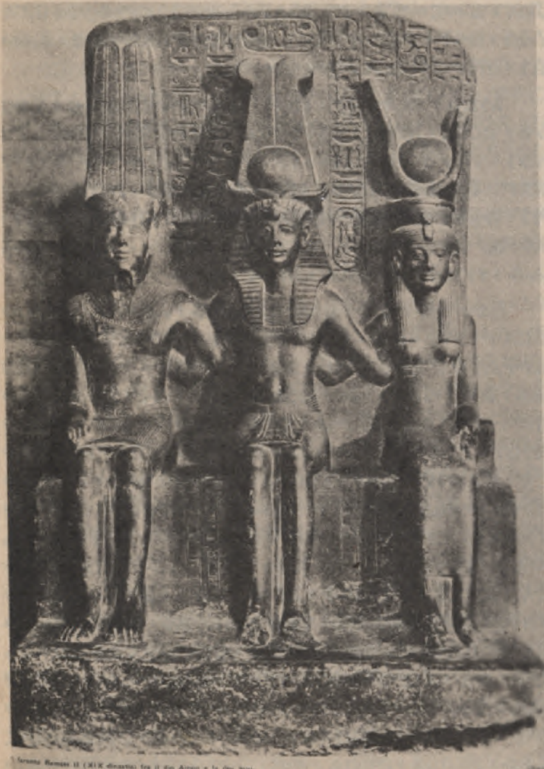
Statue de Ramsès II (XIXe dynastie) au musée du Louvre.

ዳግማዊ ፡ ራምሲስ ፡ በቀኙ ፡ አሞንን ፡ በግራው ፡ መጠን ፡ ( ሴት ፡ አምላክ። ) ፡ እድርጎ ፡ እርሱ ፡ በመካከል ፡ ተሠልሶ ፡ ያሠራው ፡ ሐውልት ፡ ሐውልቱ ፡ በተራሮ ፡ የሚገኝ ፡ ( ፕራምፖሊኒ ) ።