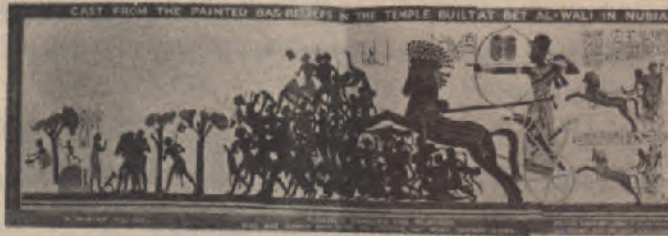
ዳግማዊ ፡ ራምሴስ ፡ በሠረገላ ፡ ሆኖ ፡ የኑብያን ፡ ወታደር ፡ በቀስት ፡ ሲወጋ ፡ ( ቤት ፡ አል ፡ ዋሊ ። )

ያን ፡ ጊዜ ፡ በሰፊው ፡ የኢትዮጵያውያን ፡ ግዛት ፡ ብለው ፡ ግሪ ኮቹ ፡ የሚጠሩትን ፡ ግብፆቹ ፡ የደቡብ ፡ ምድር ፡ የኩሽ ፡ አገር ፡ የሚ ሉትን ፡ ወሰኑን ፡ በትክክል ፡ መለየት ፡ ይቸግራል ። ቢሆንም ፡ ከሰሜን ፡ ግብፅ ፡ ከአንደኛው ፡ የዓባይ ፡ ፈሳሽ ፡ ውድቀት ፡ ( ካታራክት ) ፡ ይዋሰንና ፡ ከምሥራቅ ፡ የኤርትራ ፡ ባሕር ፡ ከአዲስ ፡ እስከታች ፡ እስከ ፡ ኤል ፡ ማንደብ ፡ ድረስ ፡ ነው ። ከደቡብና ፡ ከምዕራብ ፡ ወገን ፡ ግን ፡ በዚያን ፡ ዘመን ፡ በዚህ ፡ ክፍል ፡ የታወቀና ፡ የሚከላከል ፡ መን ግሥት ፡ ስለአልነበረ ፡ እዙፋን ፡ እንደወጡት ፡ ነገሥታት ፡ ድካምና ፡