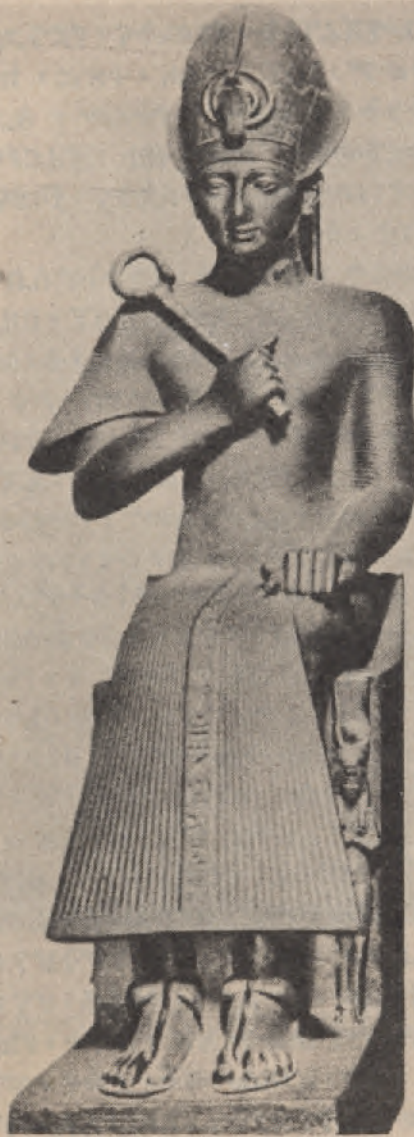
ሙሴ ፡ በቤቱ ፡ ያደገው ፡ ዳግማዊ ፡ ራምሴስ ፡ በዙፋኑ ፡ ሐውልቱ ፡ ዘቶሪኖ ፡ የሚገኝ። ( ፕራምፖሊኒ )

ኤድዋርድ ፡ ማሪዬት ፡ (AUGUSTE EDUARD MARIETTE) የሚባሉትና ፡ ሙሴ ፡ ቪኮንት ፡ ኤማኑኤል ፡ ደ ፡ ሩገ። (VICOMPTE EMANOUEL DE ROUGÉ) ናቸው (፩) ።