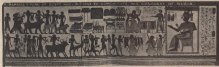
ከድሉ ፡ በኋላ ፡ ከ፱ ፡ አገሮች ፡ የኑብያ ፡ መልክተኞች ፡ ያመጡለትን ፡ ግብርና ፡ ገጸ ፡ በረከት ፡ ሲቀበል ። ( ቤት ፡ አል ፡ ዋሊ ። )