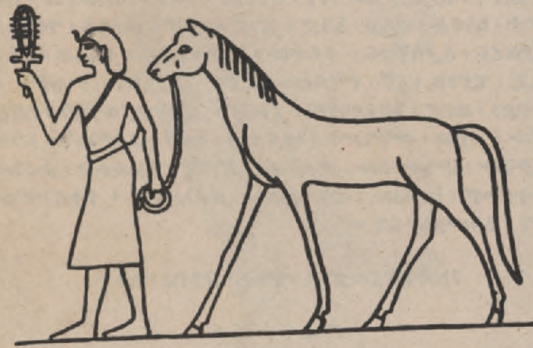
ነምሩድ፡ በቀኝ፡ እጁ፡ ፈረሱን፡ በግራ፡ እጁ፡ ጸናጽል፡ እንደያዘ፡ ወደ፡ ድል፡ አድራጊው፡ ወደ፡ ፒያንኪ፡ ሲቀርብ፡ (ገር፡ ገር ከሌር)፡ ከጭንቅላቱ፡ በላይ፡ በክስቡ፡ ውስጥ፡ ያሉት፡ እራት፡ ፊደሎች፡ በጥንቱ፡ ፊደል፡ (ሂዮርግሊፍ)፡ የተጻፈው፡ የነምሩድ፡ ስም፡ ነው። (ገብርኤል፡ ሐኖቶ።)