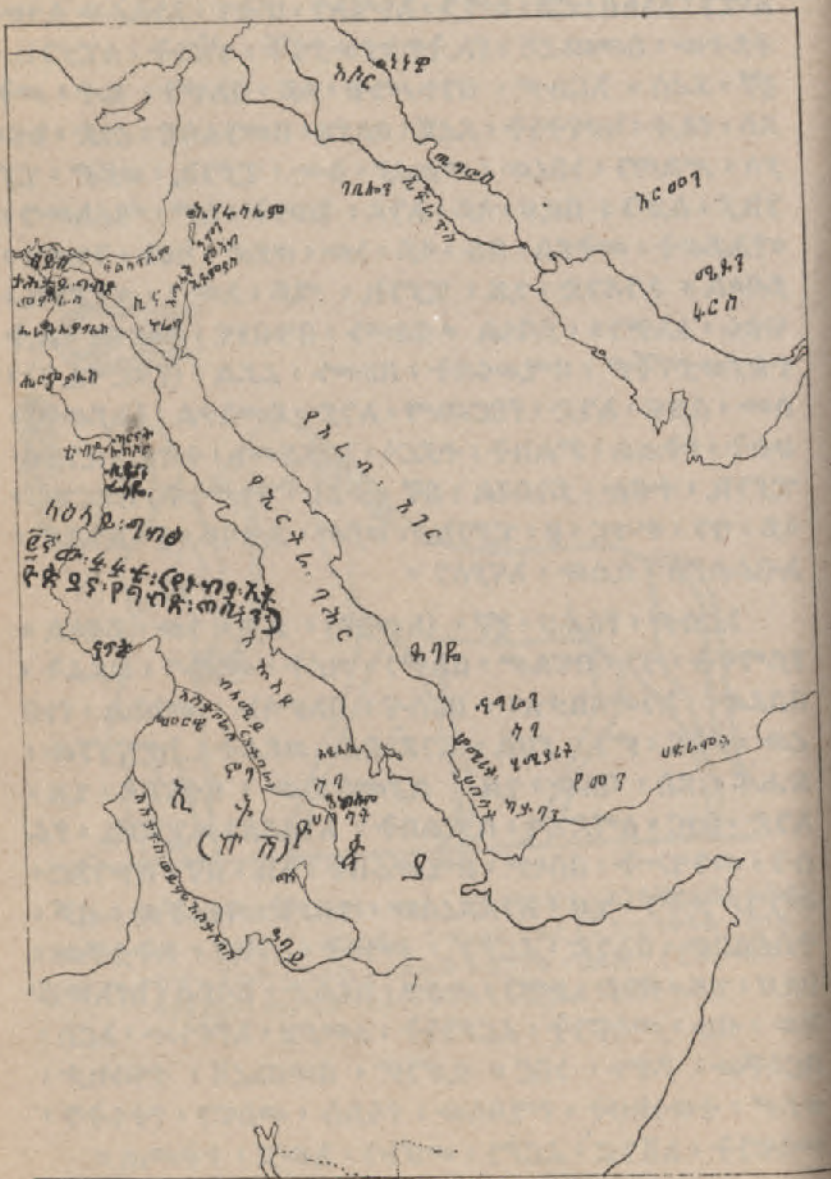
ቀ. 9. ፱፱

አቶዮድን ከግብፅ ከመካከለኛው ምሥራቅና ከዓረብ አገሮች ጋር የሚያላይ (በስኬል ያልተሠራ ።)