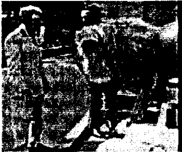
አንበሳ አገራዊ ጽንሆይ

ሁኔታው ያለቀለት መሆኑ ገሃድ ወጣ። አብዮቱ መያዝ ከሚገባው ትንፋሽ በላይ የያዘ የልጆች ፊኛ መስሎ ተወጥሯል። እንዳያስተነፍሱት በማይፈታ አስተሳሰር ከሜፍ ታስሯል። የቀረው መፈንዳት ነው፤ ለዚህ ደግሞ ቅንጣት ምክንያት ብቻ በቂ ነበር። ያላቸውን ኃይል ተጠቅመው ያሳበጡት በውጭ አገር ያሉት ለሥልጣን ሲባሉ ይህን የሚያስቡበት ጊዜ አው፤ በቅርብ ያሉትም ከፈነዳ በኋላ ስለሚነፉት አዲስ የልጆች ፊኛ ሲያውጡበት ነበር። በመሆኑም አገሪቱ በአስር አለቆች መመራትና ብዙ እልቂት መድረስ ነበረበት። በሌሎች ይሁንታ ያበጠውን አብዮት ማፈንዳት ለወታደሩ ቀላል ነበር። እናም “ለማስተባበር” በሚል መነሻ ከየጦር ክፍሉ ተውጣጥተው እንደቀልድ በላንድሮቨር መኪና ለስብሰባ መጡ፤ በዚያው ተባብረው፣ አስተባብረው፣ በዚያው ስልጣን ይዘው፣ ባላሰቡት መንገድ አገር መርተው፣ በዚያው ቀሩ። ለማንኛውም ባየነው መልኩ የኢትዮጵያ አብዮት አበጠ።