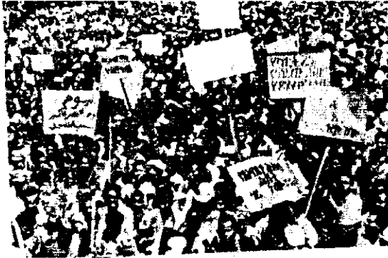
የመሬት አዋጅን ደግፈው ሰልፍ የወጡ ዜጎች ለአዋጁ ተግባራዊነትና ስኬታማነት፤ እንዲሁም ዘላቂነት ይረዳ ዘንድም፤ እንደአስፈላጊነቱ የመሬት ድልድል የማድረግ ስልጣን ያላቸውን

አዋጁ የመሬት ይዞታን በአስር ሐክታር ሲወስን፤ ከዚያ የተረፈውንም ቀድሞ በሰው መሬት ላይ በጉልበቱ ያገለግል ለነበረው መሬት አልባ ጭሰኛ በመሰጠት መሬት አልባውን ባለመሬት ያደረገ ሆነ።