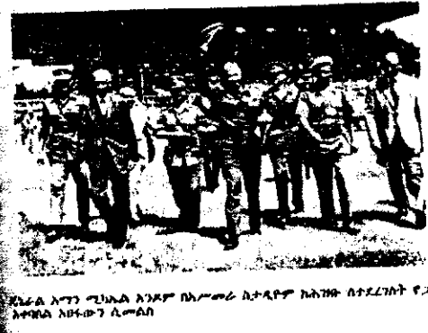
የአማን ገለፃ በቀና ትርጓሜ ቢመረመር የኤርትራ አማፅያን ለዓመታት ሲታገሉለት የቆዩት ዓላማ የመገንጠል ጉዳይ ስለሆነ ያለምንም ድርድር ትጥቅ ፍቱ ቢባሉ ምንን መሠረት አድርገው ትጥቅ ይፈታሉ? የንጉሠ መውደቅ አለመውደቅ የአማፅያን መሠረታዊ ጥያቄ አይደለም። ስለዚህ የኢትዮጵያ የመጨረሻው መደራደሪያ ከመገንጠል የተሻለውንና የማይከፋውን ፌዴሬሽን መስጠት ይሆናል። ስለ ሠላም መደራደር ካስፈለገ ምርጫው ያ ብቻ ነበር። ከዚህ ውጪ ከሆነ ደግሞ አማን የሄዱት ወይም የሚሄዱት ለማስፈራራት ብቻ መሆን ነበረበት። “እጅ ብትሰጡ ሰጡ፤ ያለዚያ ወጥላችሁ” ብሎ ለመመለስ እንደማለት። ምክንያቱም ለዓመታት የተደራጁና ለእኩይ ዓላማቸው መፈፀም ብዙ ደም ያፈሰሱ ተገንጣዮች በባዶ ሜዳ ሠላማዊ ድርድር የሚያደርጉበት መነሻ አይኖርምና። ከዚህ አንፃር የጄኔራሉ ሀላብ ሠላም እንዲወርድ እስከተፈለገ ድረስ አንድ ነገር መደረግ አለበት የሚል ስለሆነ ተገቢነቱ አያጠያይቅም። ስለሆነም ሊያስጠረጥራቸው ባልቻለ ነበር። ሆኖም

ከጉብኝቱ መልስ የደርግ አባላትን ሰብሰበው የጉብኝታቸውን ሁኔታ ካሰረዱ በኋላ ውይይት ተደረገ። አማን የኤርትራ ህዝብ ሠላም እንደሚፈልግና፣ ሠላም ማውረድ እንደሚቻልም ጠቅሰው “መንግስት መከተል ያለበት ሰጥቶ የመቀበልን መርህ ነው” የሚል ድምዳሜ አከሉበት። ይህንንም ሲሉ የኤርትራ አማፅያንን ትጥቅ ለማስፈታት ቢያንስ የፌዴሬሽን ጥያቄ ማንሳታቸው አይቀርምና ምላሽ ለመስጠት መዘጋጀት ከእኛ ይጠበቃል ለማለት ነው።