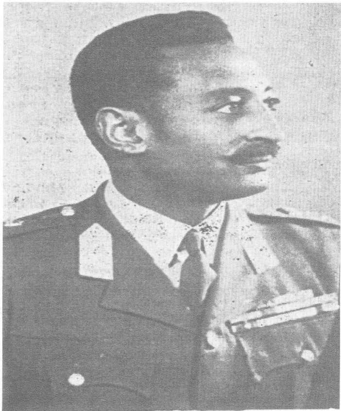
ብርታኤር ጅኔራል መንግሥቱ ንግይ