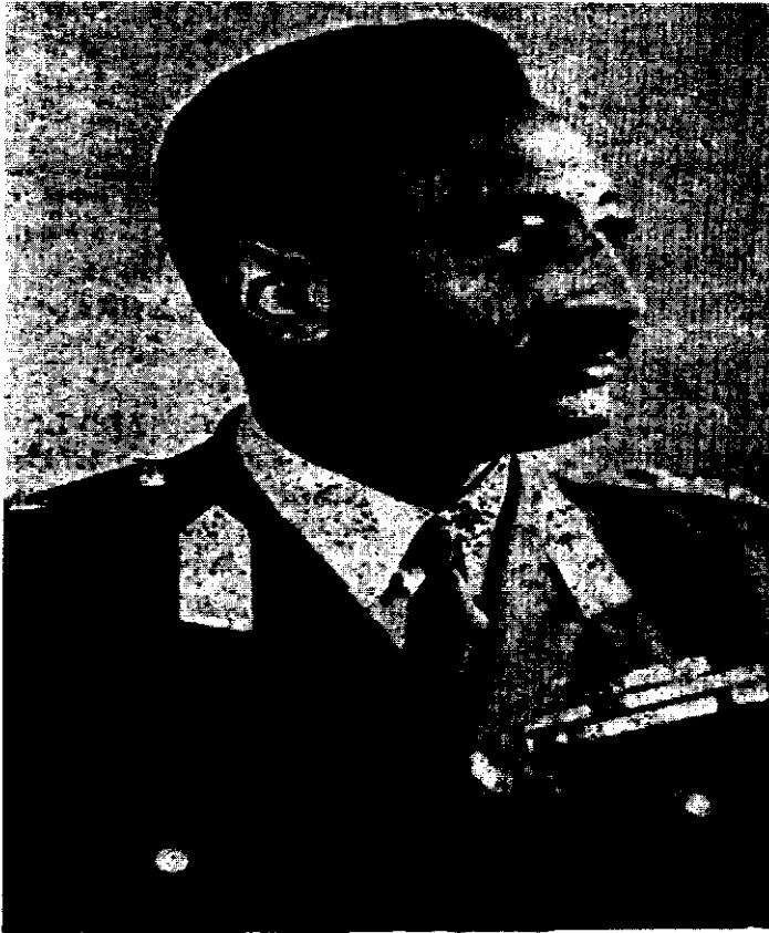
ብርጋዴር ጄኔራል መንግሥቱ ንዋይ