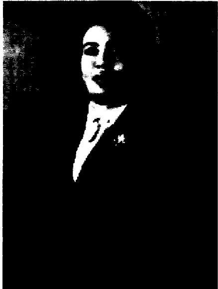
ወይዘሮ ቆንጂት አብነት

የተገለጠ ነገር ባለማግኘቱ ነገሩ ትንሽ ግር አለኝ። የሆነው ሆኖ ወደ ሌላ ቦታ በመደወል ነገሩን ማጣራት ያለብኝ ሆኖ አገኘሁት። በዚህም መሠረት ወደ ጄኔራል መንግሥቱ ቤት ደወልኩ። ያገኘሁትም መልስ “የሉም” የሚል ነበር። “ወደየት ሄደዋል” ብዬ ብጠይቅም «አናውቅም የሚል መልስ ተሰጠኝ። ከዚህ ቀጥሎ ደግሞ ወደ ጄኔራል ከበደ ቤት ደወልኩና ለጊዜው «የለም» አሉኝ። ወዲያውም ወደ ጄኔራል ኢሣይያስ ዘንድ ደወልኩና አገኘሁት። እርሱም የሰማው ነገር እንደሌለ ነገረኝ። ጉዳዩ በጣም ግር አለኝ። «ምን ይሆን?» እያልኩ ሳወጣና ሳወርድ በግርማዊት ላይ ሳይሆን በመንግሥት ላይ አንድ ነገር እንደተደረገ ተሰማኝ። 28