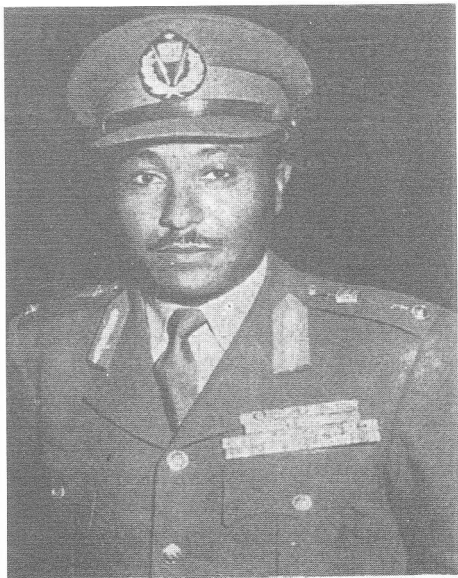
ሜጅር ጄኔራል መርዕድ መንገሻ የጦር ኃይሎች ኤታ ማጅር ሹም