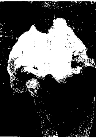
ክቡር ቀኛዝማች ገብሩ ገብረ መስቀል!

ወያኔው “ይህም 255 ዓመት ይሆናል” ይላቸዋል። ክቡር ቀኛዝማች ገብሩ “እንግዲያውስ ልጆቼ በነዚህ ዓመታት ውስጥ ወልቃይት በትግራይ አለመተዳደሯን እናውቃለን። ወልቃይት ሲተዳደር የነበረው በበጌምድ ግዛት ሁኖ ነው። ሰው እሽ በሌ አምቢል የሚለው ተክዜ ወንዝ ደንበራችን ሁኖ በጉርብትና በመረዳዳት በግቢና በመተዛዥን አብረን መኖራችን ልክ ነው ይህ የታሪካችን አንዱ ገጽታ መሆኑን እናገራለሁ” ብለው እንቅጫን ሲነገሩአቸው ወያኔዎች ደሀና አደሩ ሳይሉ ከቤታቸው ወጥተው ሕደዋል።