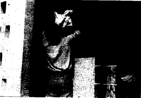
ጥበቡ ሕፃን አምነትን ሲያጫውታት