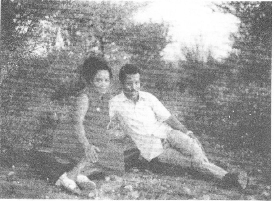
ቀበሌደሃር ጥር ወር 1969 ዓ.ም.