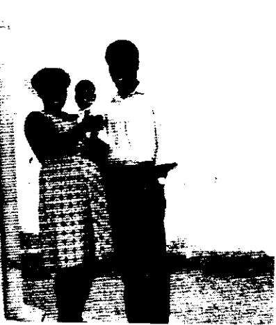
እኔና ጥበቡ ከአምነት ጋር

ተሳሰመን ኔታን ለማመስገን ልቤ ችኩኋል። ልጄንም አጻጻድተው ሌላ ሕፃናት ክፍል ሰላሰተኛት ገና አላየኋትም። ሆይም ምግብ ፈልጎ አጅጉን ረሃብ ይሰማኛል። ዘረሃቡ ይልቅ ግን የልጄን ዓይኖች ባይኔ ለማየት በእጆቼ እቅፌ ከንዴ ላይ ለማስተኛ ናፍቆቱ አስቸግሮኛል። አንዱ የዋርዱ ሐኪም በመጨረሻ ሊያየኝ ሲገባ “እባካችሁ ልጄን አጠገቤ አምጡልኝ ላያት አፈልጋለሁ” አልሁት። “ደግሞስ መቼ ነው ወደ ተያዘልኝ መኝታ ክፍሌ የምትወስዱኝ? ከቤተሰቤም መገናኘት አልቻልኩም?” ብዬ ሆድ በባሰው መልክ መጠየቄን አስታውሳለሁ። ሐኪሙም “እስካሁን ለምን ልጄን አላመጣችሁላትም? ወደ መኝታ ክፍሏም ትወስድ እንጂ” ብሏቸው ከክፍሉ ወጣ። ከብዙ ጥበቃና ትዕግሥት በኋላ ልጄን እምነትን በሕፃን አልጋ አምጥተውልኝ ለመጀመሪያ ጊዜ ሳያት በውስጤ ተቀርጾ የቀረውን ትዝታ አሁንም አስታውሳለሁ። በጸጥታና በሚያስደንቅ ሰላም የተሞላው ገጽታዋ የሚገባኝ ነገር ነበረው።