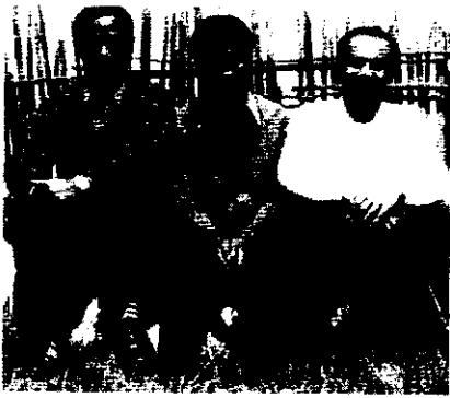
ገባቡ ከሚልክሮስ እና ከብርሃኑ ጋር

“ጌታዬ ሆይ ሚስት እንዳገባ የምትፈልግ ከሆነ እሺ ለፈቃድህ እታዘዛለሁ። ነገር ግን አንተ ለኔ ያዘጋጀሃትን እህት መርጠህ አሳየኝ እንጂ እኔ በሰጋዬ የማያቸውን እህቶች ሁሉ ይቺ ትሆን ያቺ? አያልኩ ስህተት ውስጥ አልገባም። ደግሞም እግዚአብሔር ሆይ ብቻ አንተ ለእኔ ያዘጋጀሃት ሴት ትሁን። ፊደል የቆጠረኛ ትሁን ወይም ሀሁ እንኳ የማታውቅ ገጠሬ፣ መልክ ያላት ትሁን የሌላት፣ በፊትህ የማስቀምጠው የእኔ የሆነ አንዳች ምርጫ የለኝም። ሁሉን ላንተ አተወጥለሁ። እግዚአብሔር ሆይ ደግሞ እንተ ባዘዝከኝ መሠረት የሕክምናውን ትምህርት በማገባደድ ላይ ነኝ። እኔን በሕክምናው ሥራ እንድሰማራ የምትፈልግ ከሆነ በሥራ ዓለም በመባከን ብዛት አንተን ሰበድልና ሳባዝን ልገኝ እችላለሁ። ስለዚህ የማገባት ሴት ስለእኔና ስለቤትህ ስለ ሕዝብህና ስለአገልጋዮችህ በቤት ሆኖ የምትማልድ እንድትሆን አለምንሃለሁ” ብዬው ነበር።