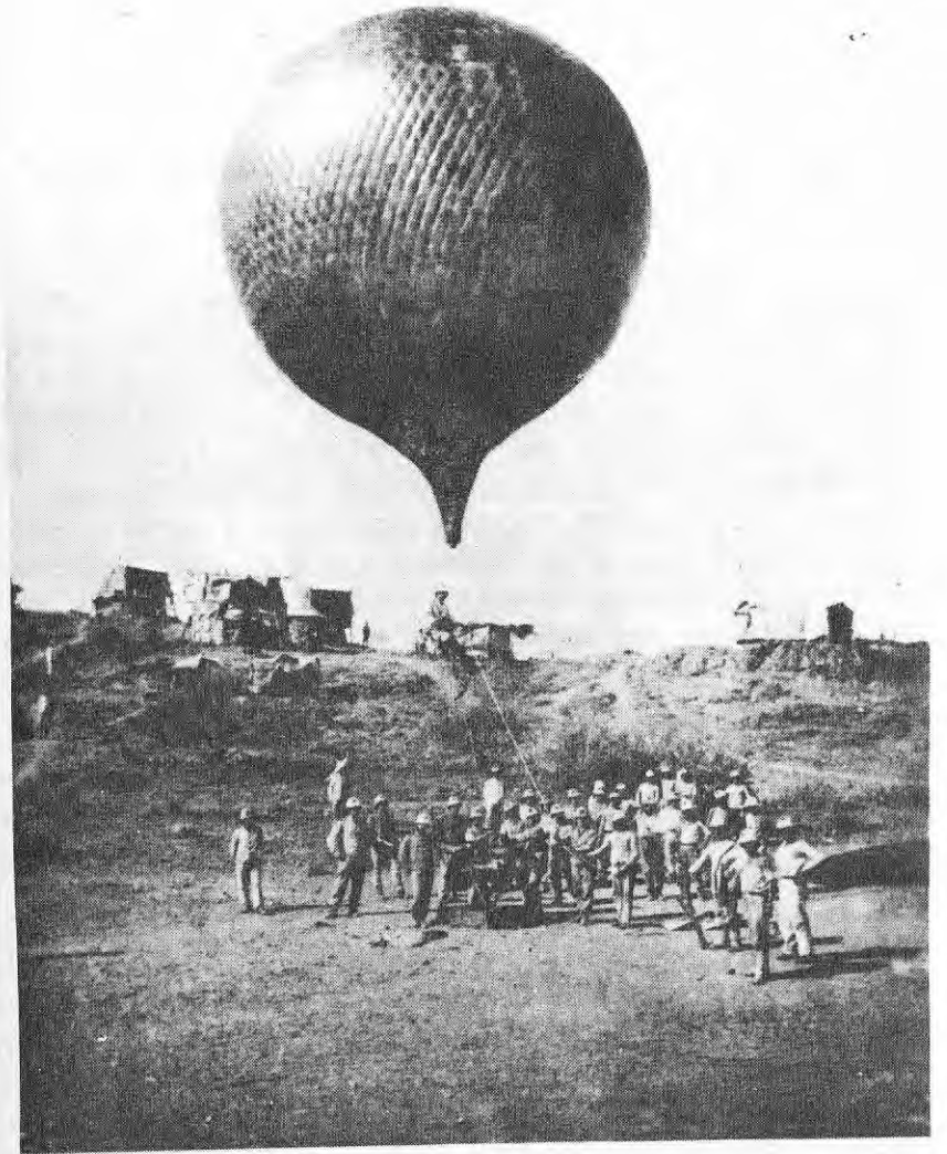
ኢጣሊያኖች ለማስፈራሪያነት ባዩር የተሞላ ኳስ ወደ ሰማይ ሲለቁ