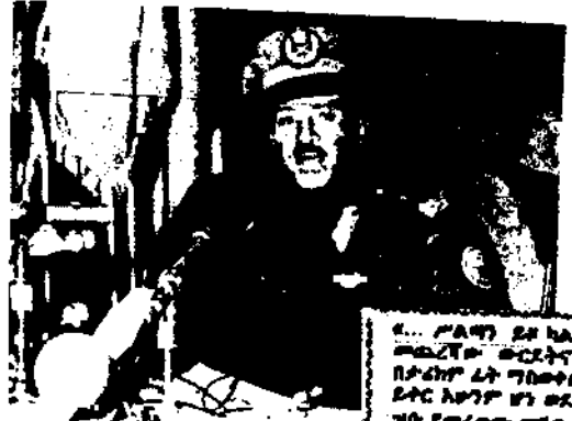
... የሰለግን ደብራራት መደገፍ ወርሶች ገጠን በቀርባ ለት ግብታዎች ለግ ደግሞ ለግን ሆነ ወረረት ል ሆነ የሚረገፍ ማግኘት ለ ደብራ ስርሰ የአገሪቱ ሰለግን ወጥ ለንደራሌ ለግርግ ለግታዎች የም ነው...

የአርትራ ፖሊስ አዘነሩ የወብር ከበኛ አዘነሩ (ለደሌ) የባህር ደይሌ አዘነሩ የረገግ ደራሽ አዘነሩ የአደሰ አበበ ፖሊስ አዘነሩ የቀደም የወሱ ፖሊስ አዘነሩ የላይር ወለድ አዘነሩ የገሥ የላይብ ወቆ የአርግሪ ለቪየን አዘነሩ ከፖሊስ ሠራዊት ለፖ ተርጉሞ ፍ ወብር ከበኛ ገሰሰ ደርግ ከአርግሪ ለቪየን