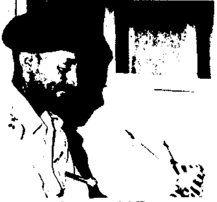
ኩ/ ዓለም-ዘውድ ፣ ተለማ የአየር ወሰድ ጸሃፊ ጻነበረ

የኩሳ ኔሉ ዓለም-ዘውድ በሰው-ጠ ውስጥ የነበረው ታሪክ ይህ ሲሆን በሱ ታሪክ ውስጥ እያሉ ነገሮች ተወሰሰው ቀርተዋል።