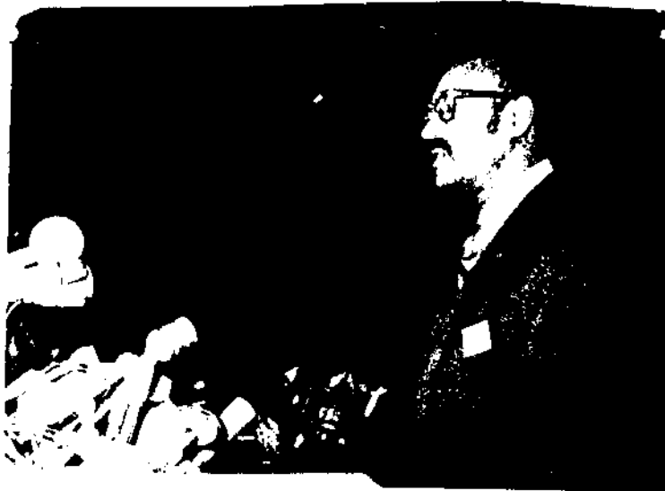
ብርባሪ ጄኔራል ተፈሪ በንቲ የጊዜያዊ ወታደራዊ አስተዳደር ደርግ ጥያቄ ተመንግቦ