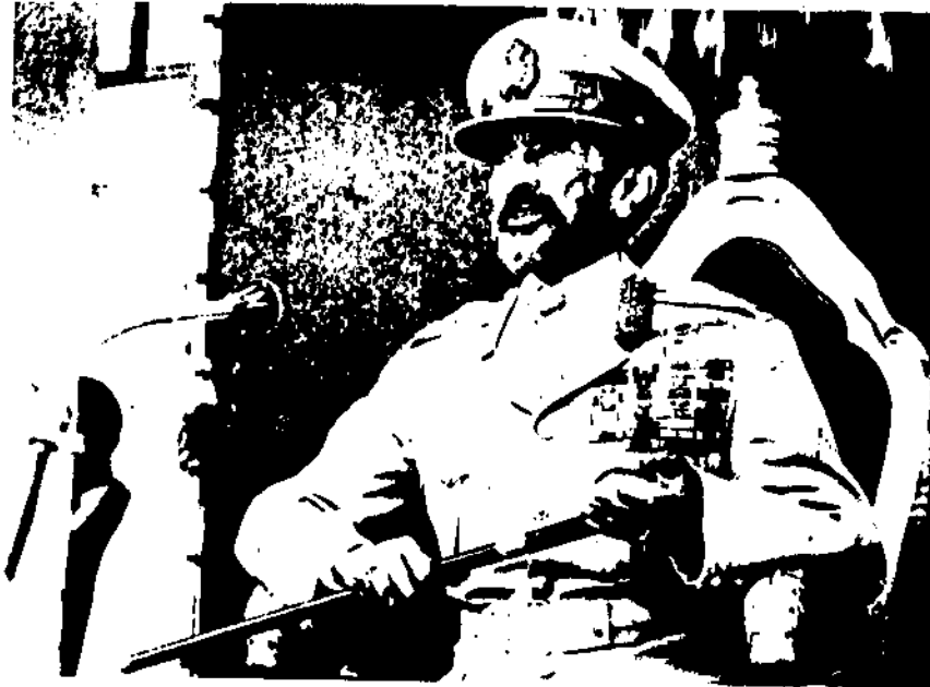
ገርግጥ ገንጠ ለገጠት ቀላጥጥ ርዳላ ሥላሴ