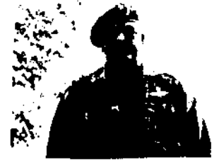
ብ/ጀ ጌታቸው ፡ ፍደው የኢርትራ ስለተደደሪና የጠረ የበሳይ ሸዛኑ

ሁኔታውም የተፈጸመው ሐምሌ 1968 ዓ ም ሲሆን ስለጄነራሉ መገደል ግን የተገለጸው በሌሎች አባሎች ላይ ግድያ በተፈጸመበት ከ8 ቀን በኋላ ነው። ይህም የተደረገው በፍርድ የተገደሉ ለማስመሰል የነበረ መከራ ነው። እነ ዳንኤል ብዙ የሠራዊቱ አባሎችንና ንጹህ ሰዎችን በእንደት ያለ ዘዴ ይገድሉ እንደነበር ከሞላ ጉደል ለመግለጽ ተሞክሯል። የጄነራሉ አገደል በብዙ ሰዎች ዘንድ አጠያያቂ ሆኖ የቶቸውን በጭር ለማስረዳት እንደሚረዳ እምናለሁ።