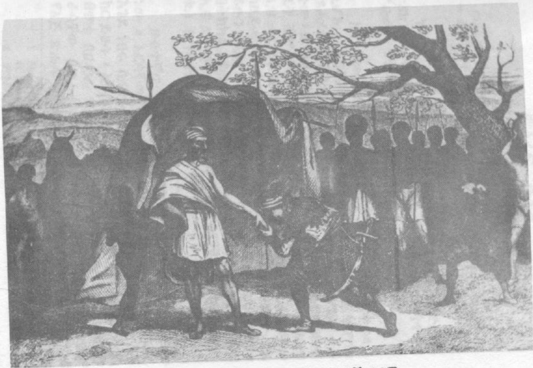
ጆምስ ብሩስ የራስ ስሑል ሚካኤልን እጅ ሲሰጥ (ከስቲር ዱ ሞንድ መጽሐፍ)