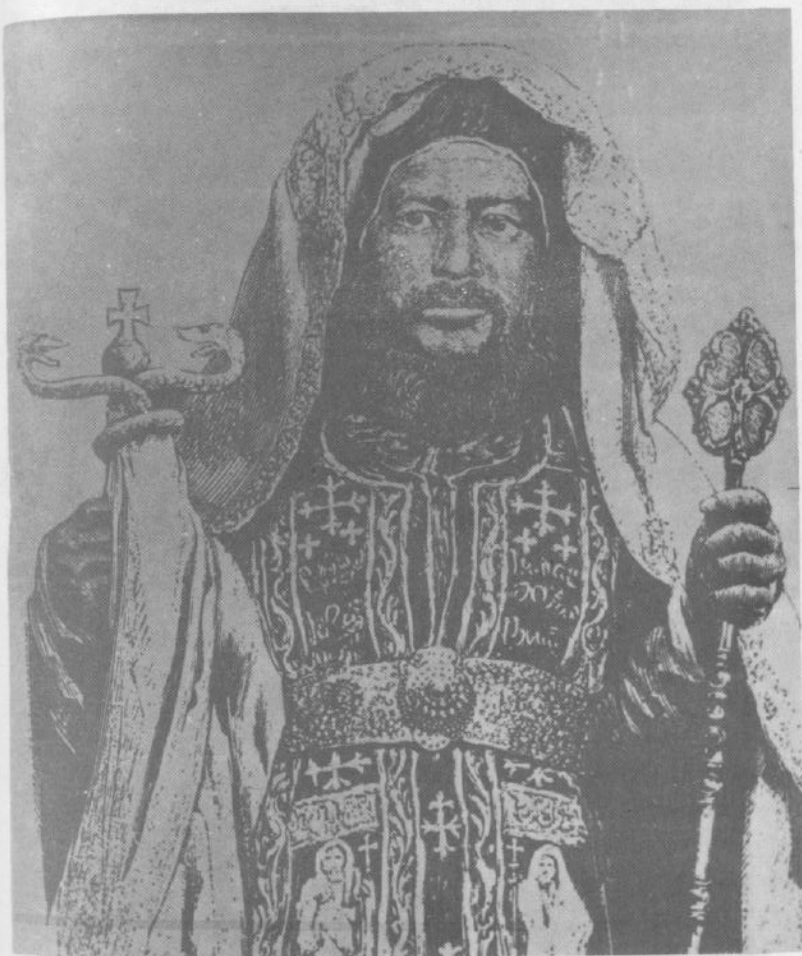
አቡነ ሰላግ (ከጉስታቭ አሬን መጽሐፍ)