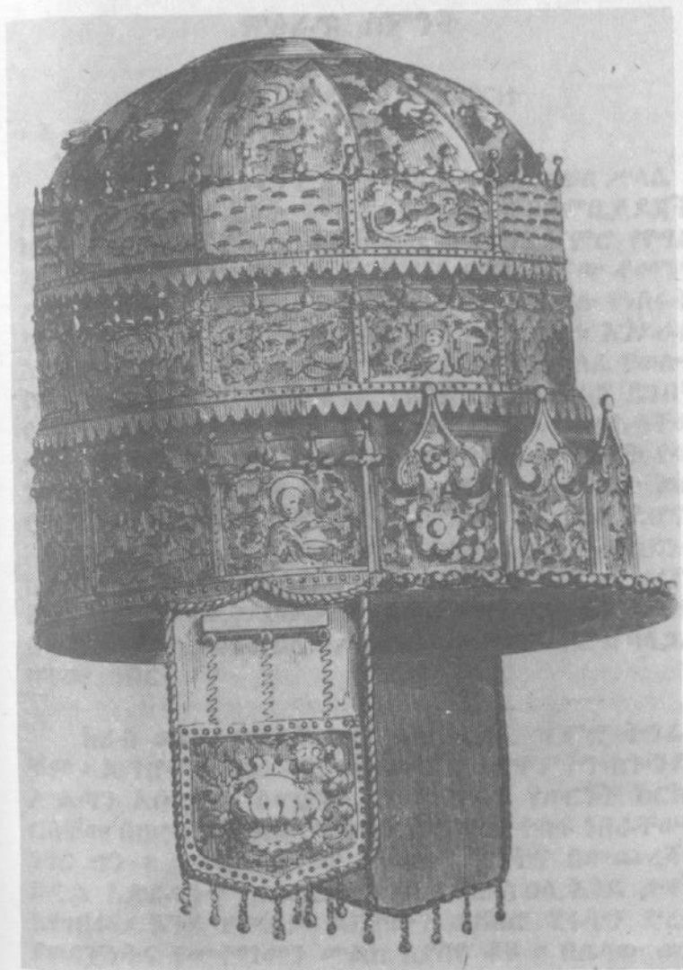
የአቡነ ሰላማ ዘውድ (ከሮገፍ እክቶን መጽሐፍ)