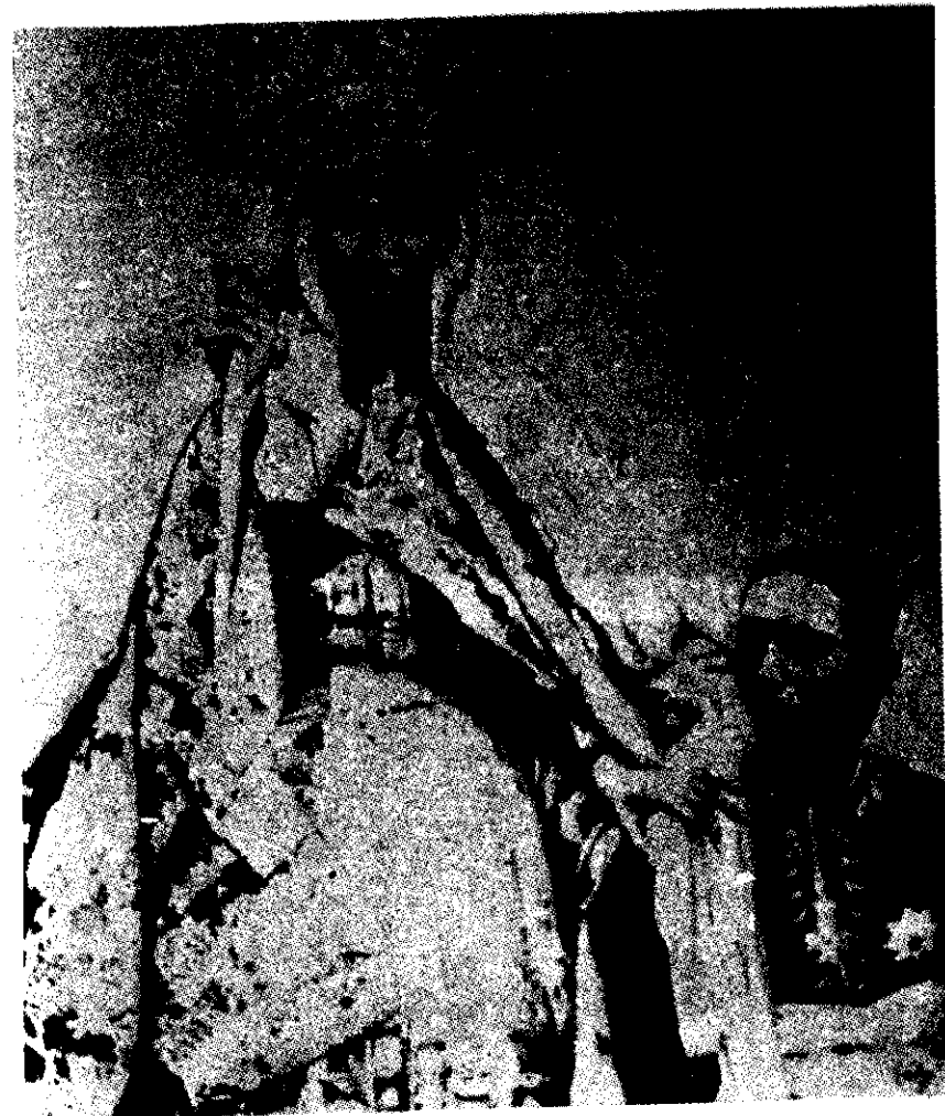
ዐፄ ዮሐንስ ከልጃቸው ከራስ አርአያ ጋር

ይኸም ስለሆነ፣ ያው ስለ ርሳቸው ዙፋንና ሥልጣን ከተዋጋው ውስጥ የሞተው ሞቶ በሕይወት የተረፈው ወታደርና መኳንንት በን ግሣቸው ጊዜ በመብል፣ በመጠጥ፣ በሽልማት፣ በሹመት ሲደሰት፣ የተ ሸናፈው የተከለ ጊዮርጊስ ወገን ግን፣ በተለይ የላስታና የለቆጣው ተወላጅ ሐዘንተኛ ነበር። ምርኮኛውም ከነጌታው በግዞት ይማቅ ቃል። የተከለ ጊዮርጊስ ባለቤት እቴጌ ድንቅነሽ ብቻ በእህትነታቸው ብዙ መጉላላት ሳይደርስባቸው፣ ላጭር ጊዜ በግዞት ወደ ሽሬ ተል ከው በመጨረሻም ይኸው አገር እንደ ግዛት ተሰጥቷቸው 2 ያዪ ዮሐንስን እንደራሴ ራስ ቢቶደድ ገብረ ኪዳንን እግብተው ደጃዝማች ሥዩም አባ ጉበዝን ወልደዋል። ምንም ዐፄ ዮሐንስ የንጉሠ ነገ ሥት ዘውድ ቢጭኑ ተከፋፍሎ መኖር የለመደው የሐማሴን፣ የቤገም ድር፣ የወሎ፣ የጉጃም፣ የሸዋ መሳፍንት ሁሉ ገና አሜን ብለው አልገ በሩላቸውም። እንኳን እነዚህ ራቅ ያሉት ከመረብ ወዲያ ያሉትም የሐጸጋና የጸሐዘጋ ባላባቶች እነ ወልደ ሚካኤል (እምቢ አለ ወልዱ) ገና አልተቀበሏቸውም። በአከለ ጉዛይም ደጃዝማች ካሳ ጉልጃ (ካሳ አባ ከይሲ) በዚሁ በነገሡበት ዓመት ሸፍተው ሲዋጉ ተማርከው ሳለ በ1867 ዓ.ም. ላይ ተገደሉ። 3 ነገር ግን፣ ከነገሡ ዝምሮ እስከ ሰባት ዓመት ድረስ ከሁሉ የበለጠ ላይ ዮሐንስ ዋና ባላንጣ ሆነው የተገ ኙት፣ የሸዋው ንጉሥ ምኒልክ ናቸው። የርሳቸውንም ሁኔታ በሚቀጥ ለው ምዕራፍ እናነባለን።