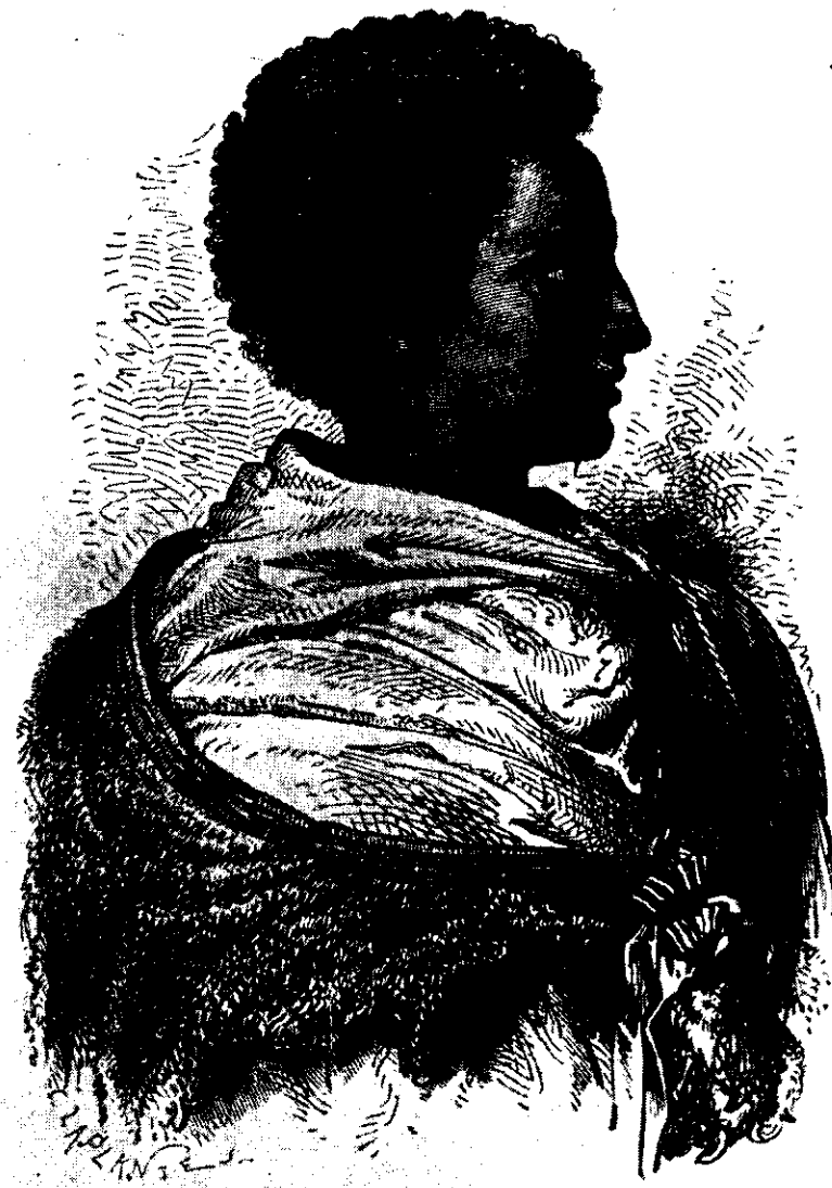
ራስ አርአያ ሥላሴ ድምፁ በዓልጋዳ በተባሉበት ዘመን