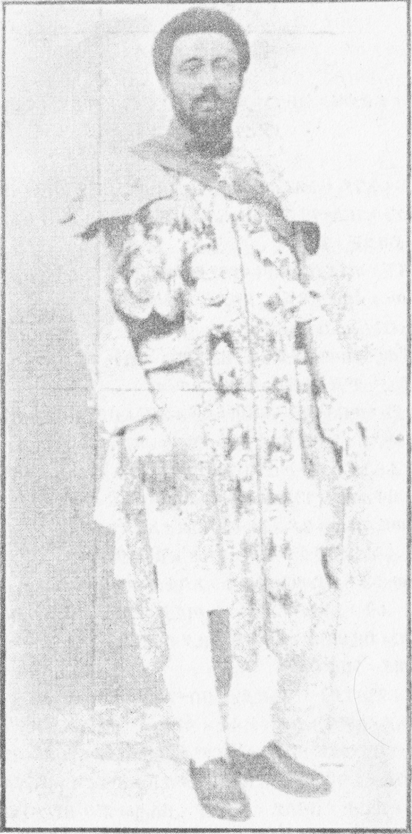
ክቡር ራስ ደስታ ዳምጠው

እንደ ሆነ ለመርከባችን ተሳፍረን ወዳገራችን እናመልጣለን እናንተ ግን የምትሄዱበት ስፍራ የላችሁምና በወረራችሁ ጊዜ ወንዶቹን እየሰለቡ ሴቶቹን ጡታቸውን እየቆረጡ ይበሉታል ምግባቸውም የሰው ሥጋ ነው ስለዚህ እኛ ድል ሳንሆን ነጋዴ ነን ገበሬ ነን ሳትሉ ባንድነት እንዋጋ እያለ ሐሰት የመላበትን ወሬ እየሞረ ይሰብክ ያሰብክ ነበር የሱማሊያ ሕዝብም እውነት እየመሰለው ገበሬውም ነጋዴውም ወደ ኢጣሊያ መጋዘን እየቀረበ ስሙን እያጻፈ ብረት እየተቀበለ በሃይማኖት ከሚመስሉት ከሊቢያ ወታደሮች ጋር ለውጊያ ተሰለፈ ።