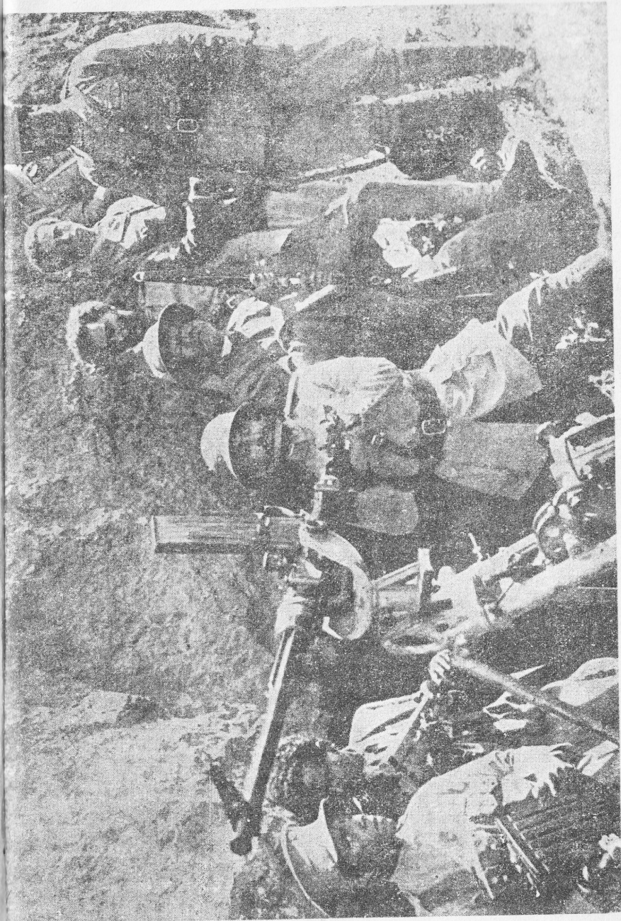
ግርማዊነታቸው : በጦርነቱ : መካከል ።