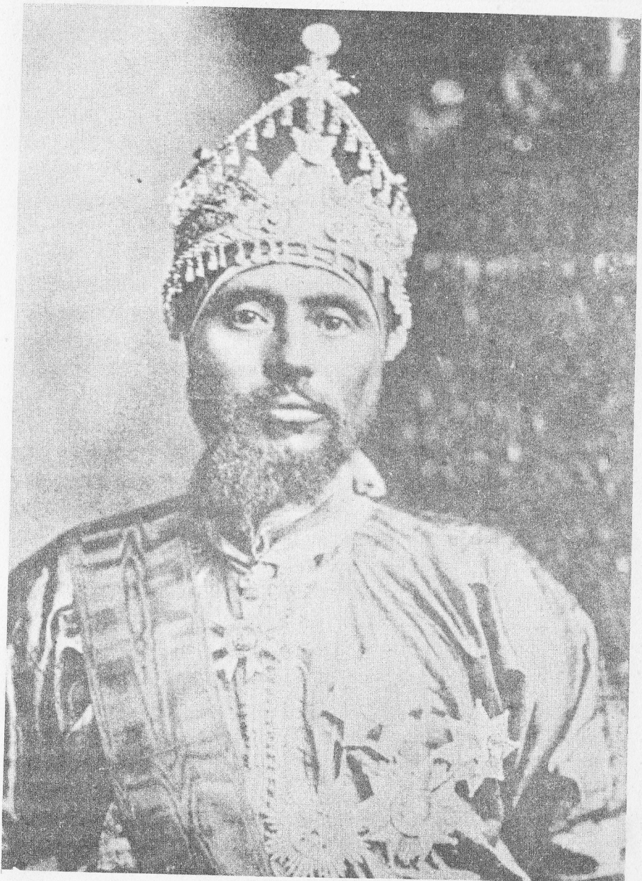
ራስ ፡ መኩንን ።

በዚህ ፡ ጊዜ ፡ ጄኔራል ፡ አሪሞንዲ ፡ የሚባለው ፡ ፩ኛው ፡ የጦር ፡ አዝማች ፡ ሸሽተው ፡ ከአምባላጌ ፡ ወደ ፡ መቀሌ ፡ የሚሄዱትን ፡ ለመርዳት ፡ መጥቶ ፡ ካባ ራራዎቹ ፡ ጋራ ፡ ጥቂት ፡ እንደ ፡ ተዋጋ ፡ ብዙ ፡ ወታደር ፡ በኮሎኔል ፡ ጁሴፔ ፡ ጋሊያኖ ፡ አዛዥነት ፡ እመቀሌ ፡ ላይ ፡ ትቶ ፡ ወደ ፡ ስፍራው ፡ ተመለሰ ። ኮሎ ኔል ፡ ጁሴፔ ፡ ጋሊያኖም ፡ ብዙ ፡ ወታደርና ፡ መሣሪያ ፡ ለብዙ ፡ ጊዜ ፡ የሚያስ ፈልገውን ፡ ሥንቅ ፡ ይዞ ፡ መቀሌ ፡ እንዳ ፡ አያሱስ ፡ ላይ ፡ መሸን ፡ ተቀመጠ ። በዚህ ፡ ጊዜ ፡ ራስ ፡ መኩንን ፡ «የተላከ ፡ ከራስ ፡ መኩንን ፡ ይድረስ ፡ ከኮሎ ኔል ፡ ጁሴፔ ፡ ጋሊያኖ ፡ ይህን ፡ አሁን ፡ መሸገኸ ፡ ያለኸበትን ፡ ስፍራ ፡ ለቀኸ ፡ ወደ ፡ ኋላ ፡ እንድትመለስ ፡ በወዳጅነት ፡ አሳስብኻለሁ ። አለቅም ፡ ያልኸ ፡ እንደ ፡ ሆነ ፡ ግን ፡ የግድ ፡ ጦርነት ፡ አድርገን ፡ የማጆር ፡ ቶኬሊ ፡ ዕድል ፡ እንዳ ያገኝኸ» ፡ ብለው ፡ ለኮሎኔል ፡ ጁሴፔ ፡ ጋሊያኖ ፡ ፪ ፡ ጊዜ ፡ ቢልኩበት ፡ «በን ጉሤ ፡ ታዝዧ ፡ የያዝኩትን ፡ አገር ፡ ለመልቀቅ ፡ አልችልም ፡ ጦርነትም ፡ ቢፈ ልጉ ፡ እኔ ፡ ዘንድ ፡ ብዙ ፡ መድፍና ፡ መሣሪያ ፡ እንዳለ ፡ ይወቁ» ፡ ብሎ ፡ መልሰ ፡ ላከባቸው ። ከዚህ ፡ በኋላ ፡ ራስ ፡ መኩንን ፡ ወታደራቸውን ፡ ይዘው ፡ ወደ ፡ ፊት ፡ እየገፉ ፡ መቀሌ ፡ ደረሱ ። ወዲያውም ፡ ምሽጉን ፡ ከበው ፡ ካስጨነቁት ፡ በኋላ ፡