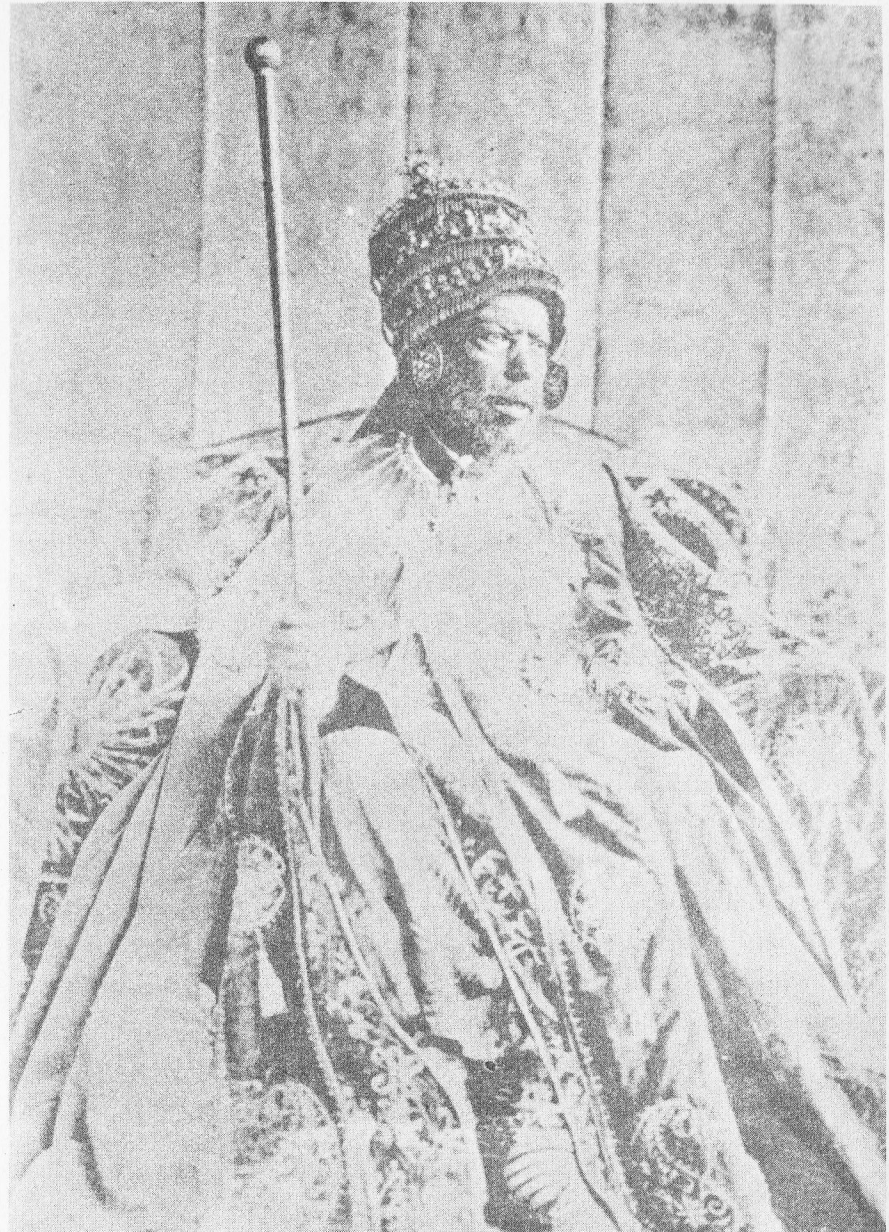
- ዐይ ፡ ምኒልክ ።

በዚያም ፡ ከታመኑ ፡ አሽከሮቻቸውና ፡ ከናታቸው ፡ ከወይዘሮ ፡ እጅግ ፡ አየሁ ፡ ጋራ ፡ ሆነው ፡ ከሸዋ ፡ ባላባቶች ፡ ጋራ ፡ ውስጥ ፡ ውስጡን ፡ እየተላላኩ ፡ ምቹ ፡ የማምለጫ ፡ ጊዜ ፡ ሲፈልጉ ፡ ወዲያው ፡ ዐይ ፡ ቴዎድሮስ ፡ የትግረና ፡ የጎንደር ፡ የቤኔምድር ፡ ሕዝብ ፡ ሸፍቶባቸው ፡ ወደ ፡ ላይና ፡ ወደ ፡ ታች ፡ ሲሮጡ ፡ አቤቶ ፡ ምኒልክ ፡ ከወሎዎች ፡ ጋራ ፡ ውስጡን ፡ ተስማምተው ፡ ከመ (፳፮)