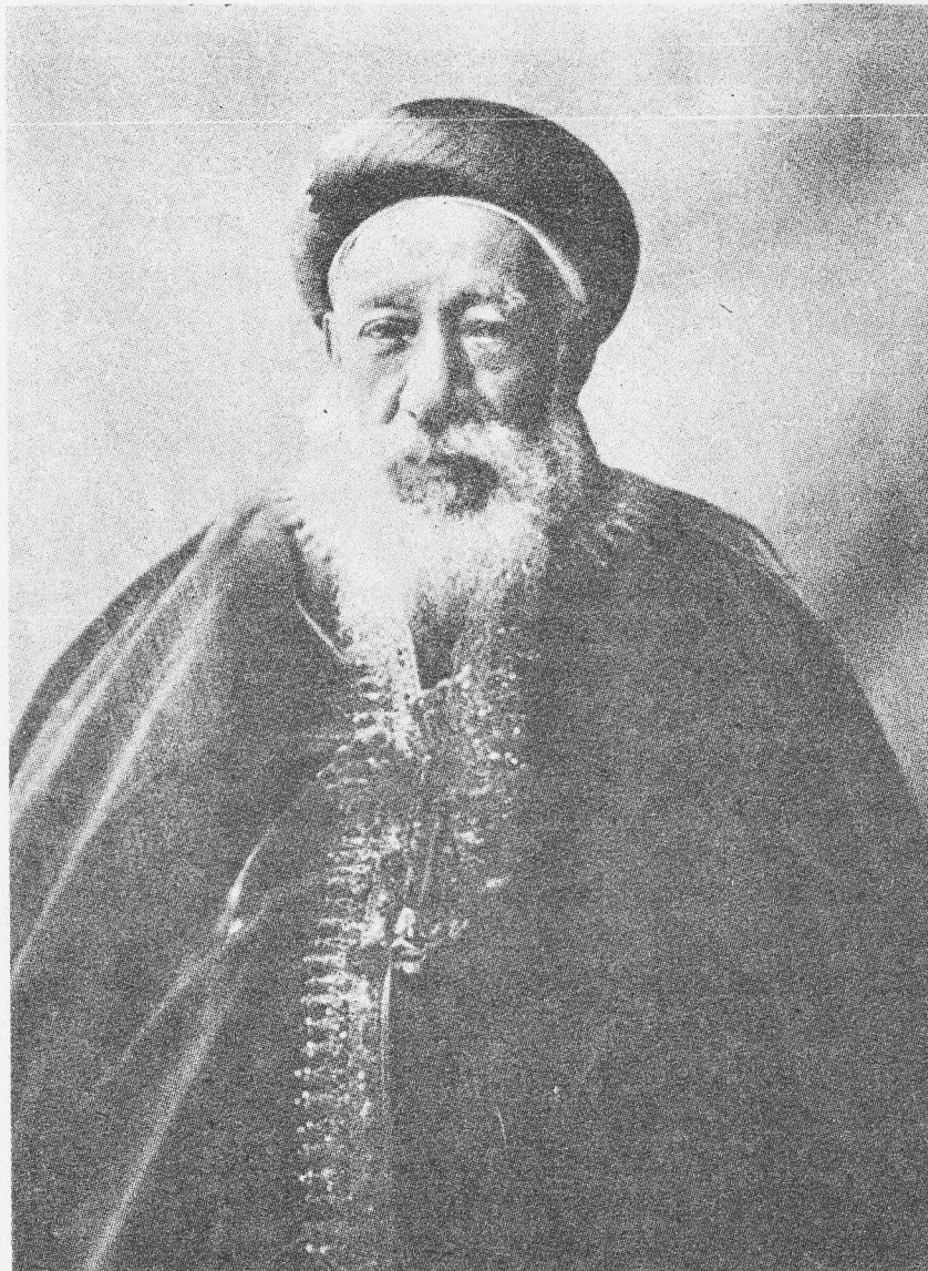
በዓድዋ ፡ ጦርነት ፡ ተዋጊውን ፡ በማበረታታት ፡ የሚሸሸውን ፡ በመገዘት ፡ ያዋጉት ፡ ጳጳሱ ፡ አቡነ ፡ ማቴዎስ ።

፩ ፡ ራሳቸው ፡ ንጉሠ ፡ ነገሥቱ ፡ ዳግማዊ ፡ ምኒልክ ፡ ዐድዋ ፡ አጠገብ ፡