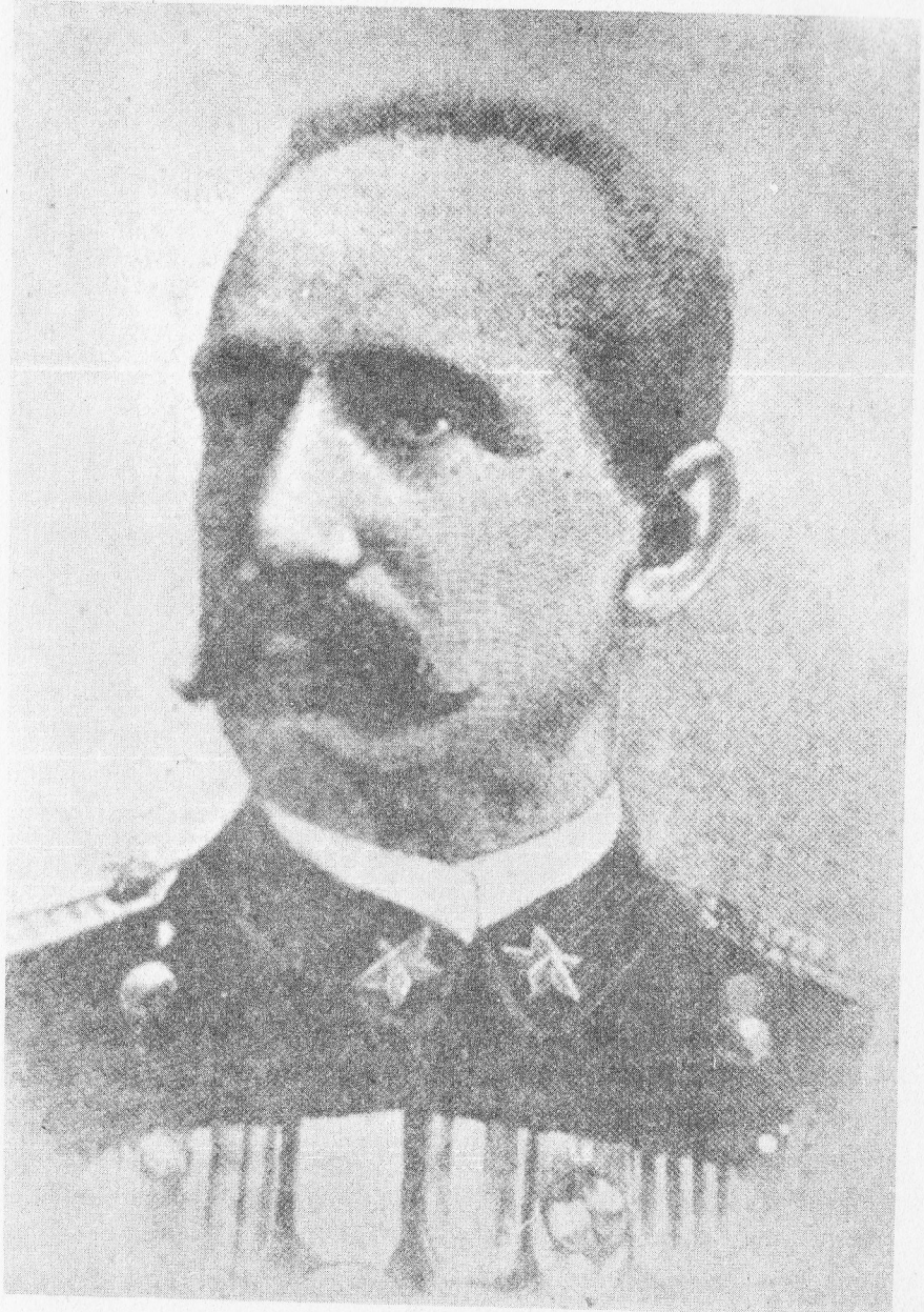
ተማራኪው ፡ ጄኔራል ፡ አልቤርቶኒ ።

ኮሎኔል ፡ ጁሴፔ ፡ ጋሊያኖም ፡ ሄዶ ፡ ከጄኔራል ፡ ባራቲዬሪ ፡ ጋራ ፡ ተገና ኝቶ ፡ ጥቂት ፡ ቀን ፡ ከቄየ ፡ በኋላ ፡ የዐድዋ ፡ ጦርነት ፡ በተደረገበት ፡ ቀን ፡ ሲዋጋ ፡ እጦርነቱ ፡ ላይ ፡ ሞተ ።