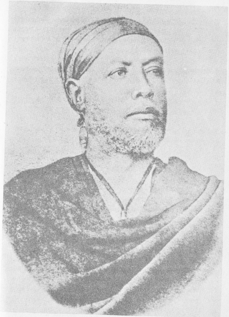
ራስ ፡ ዳርጌ ።