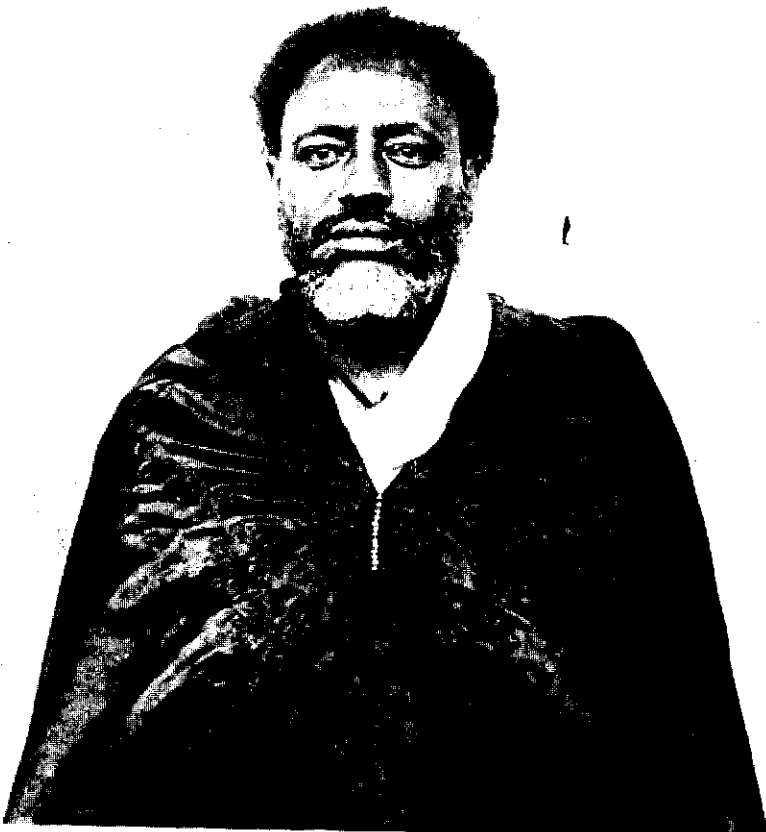
ራስ ሚካኤል (ከጥሪስ ደ ኮፒ)